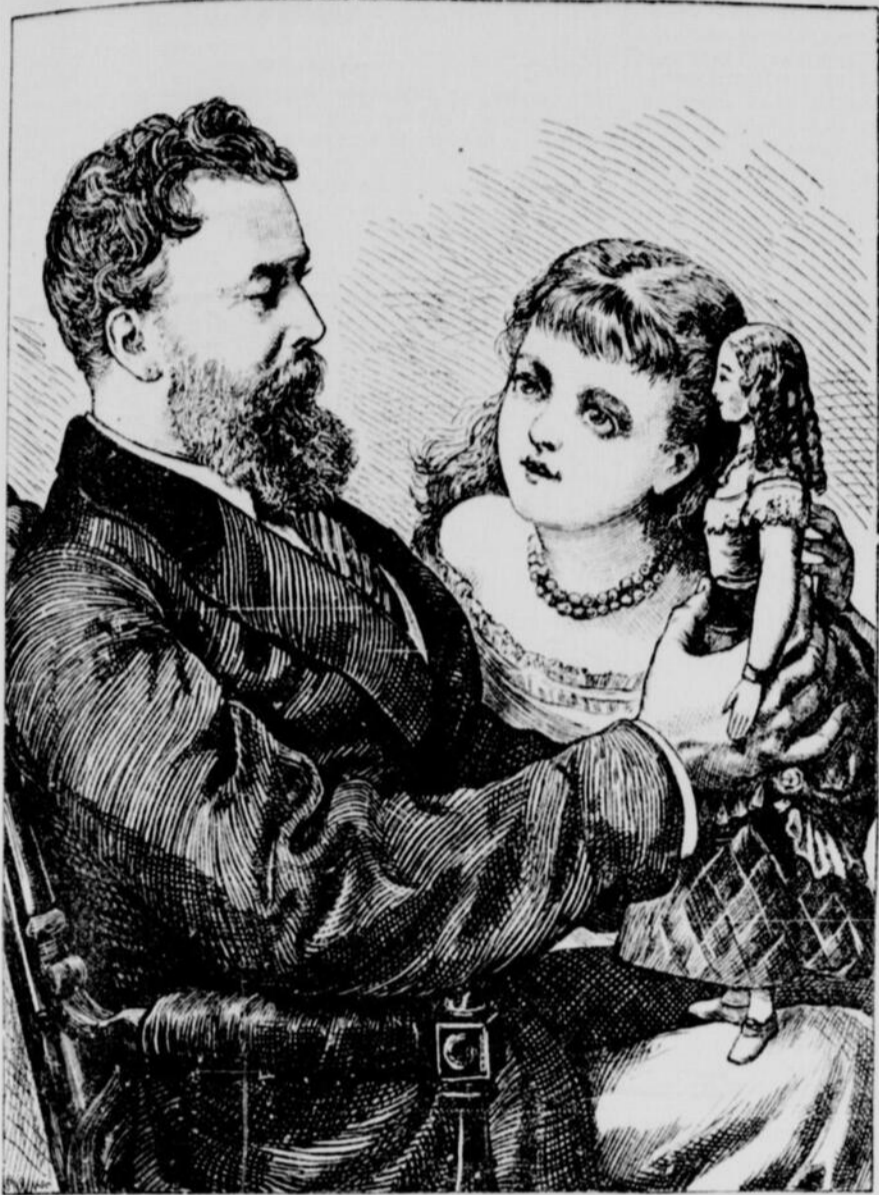
LA POUPEE NOUVELLE