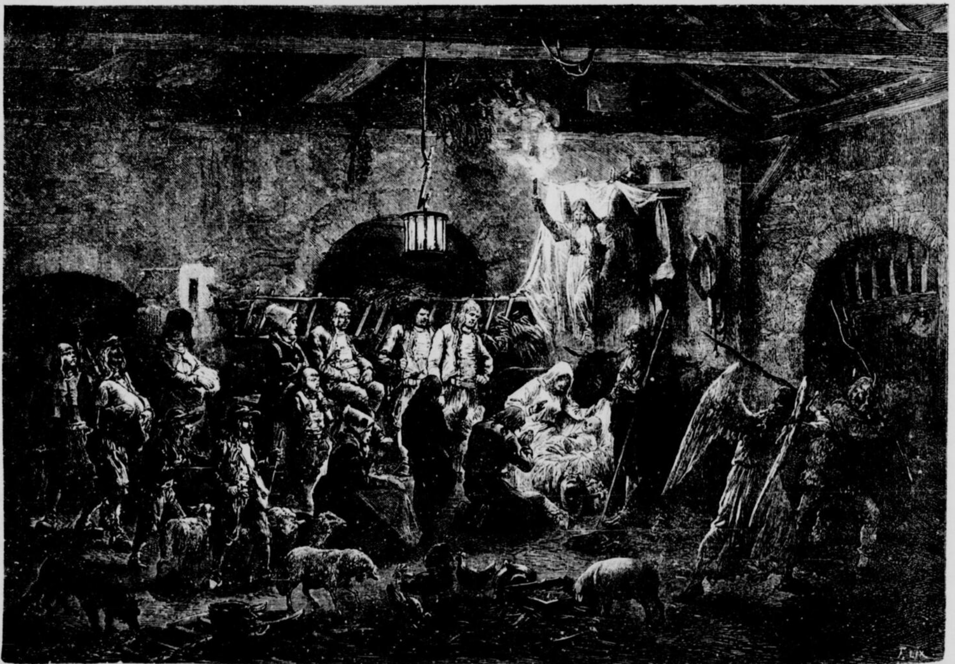
LA FÊTE DE NOEL EN BRETAGNE

La municipalité de Séville offre 50,000 francs à qui fera découvrir les auteurs de ce vol étrange.