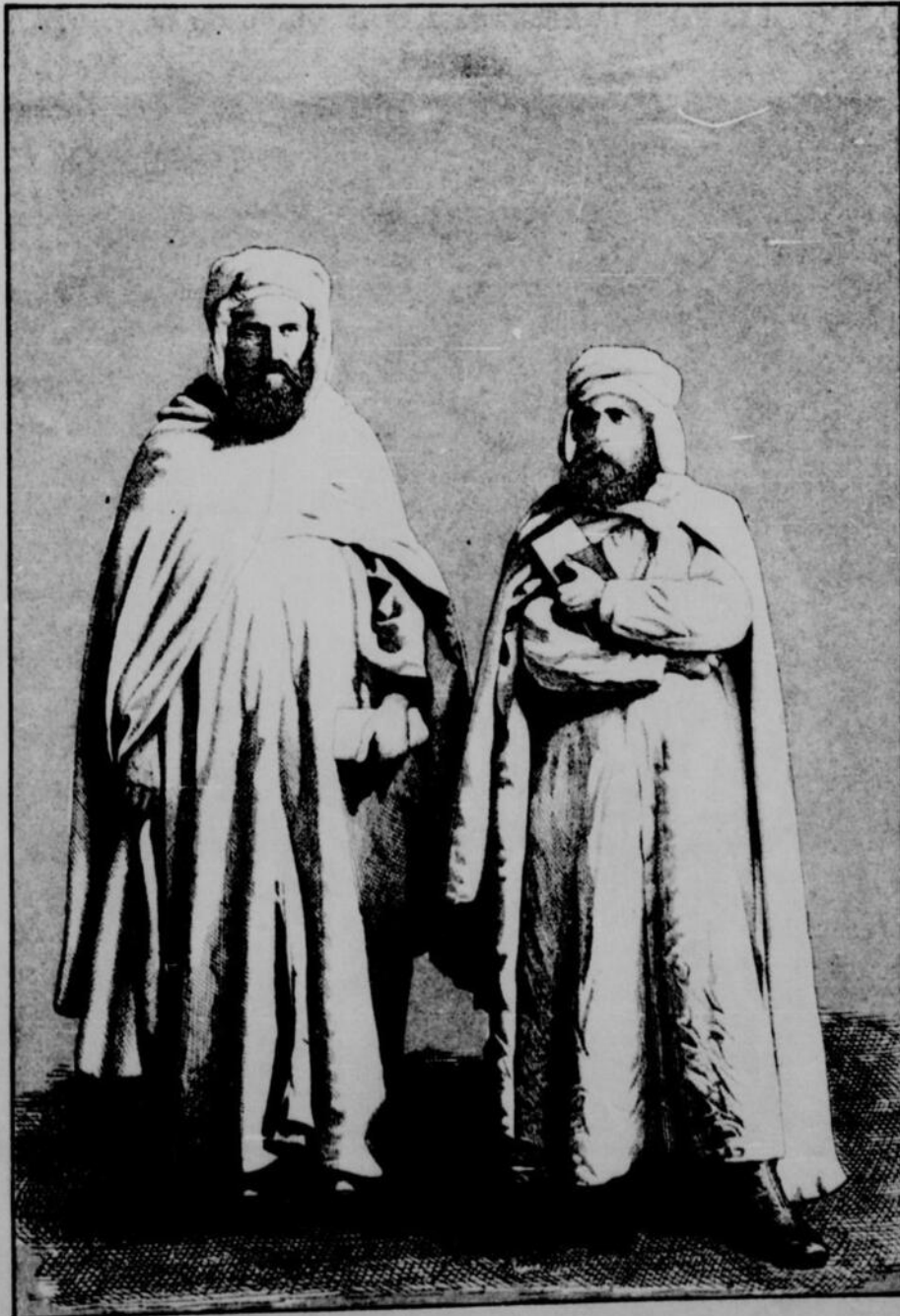
LES MISSIONNAIRES D'ALGÉRIE

plus de cinquante millions d'habitants; parmi eux l'on peut reconnaître différents groupes qui ont conservé quelques traditions chrétiennes; ce sont les restes dispersés des anciennes églises d'Afrique qui ont compté autrefois jusqu'à 800 sièges épiscopaux.