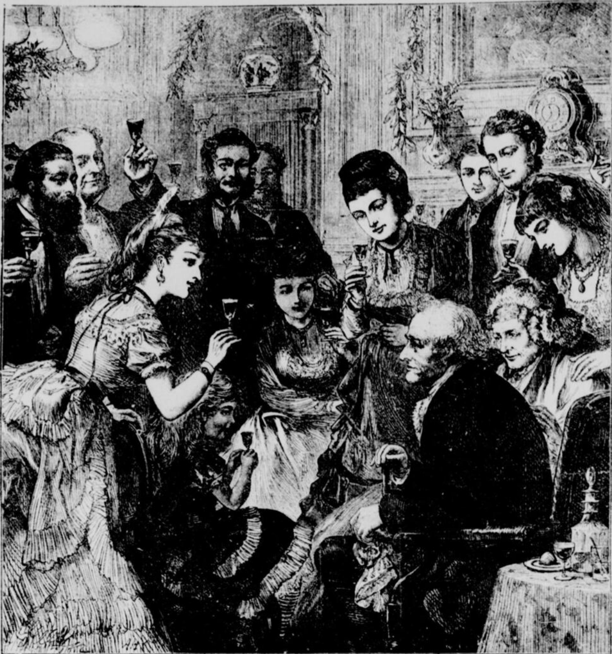
À LA SANTÉ DE GRAND PAPA ET DE GRAND'MAMAN

Nous trouvons les lignes suivantes dans les journaux de Paris, à propos du vol du tableau de Murillo, dont nous a padé une dépêche :