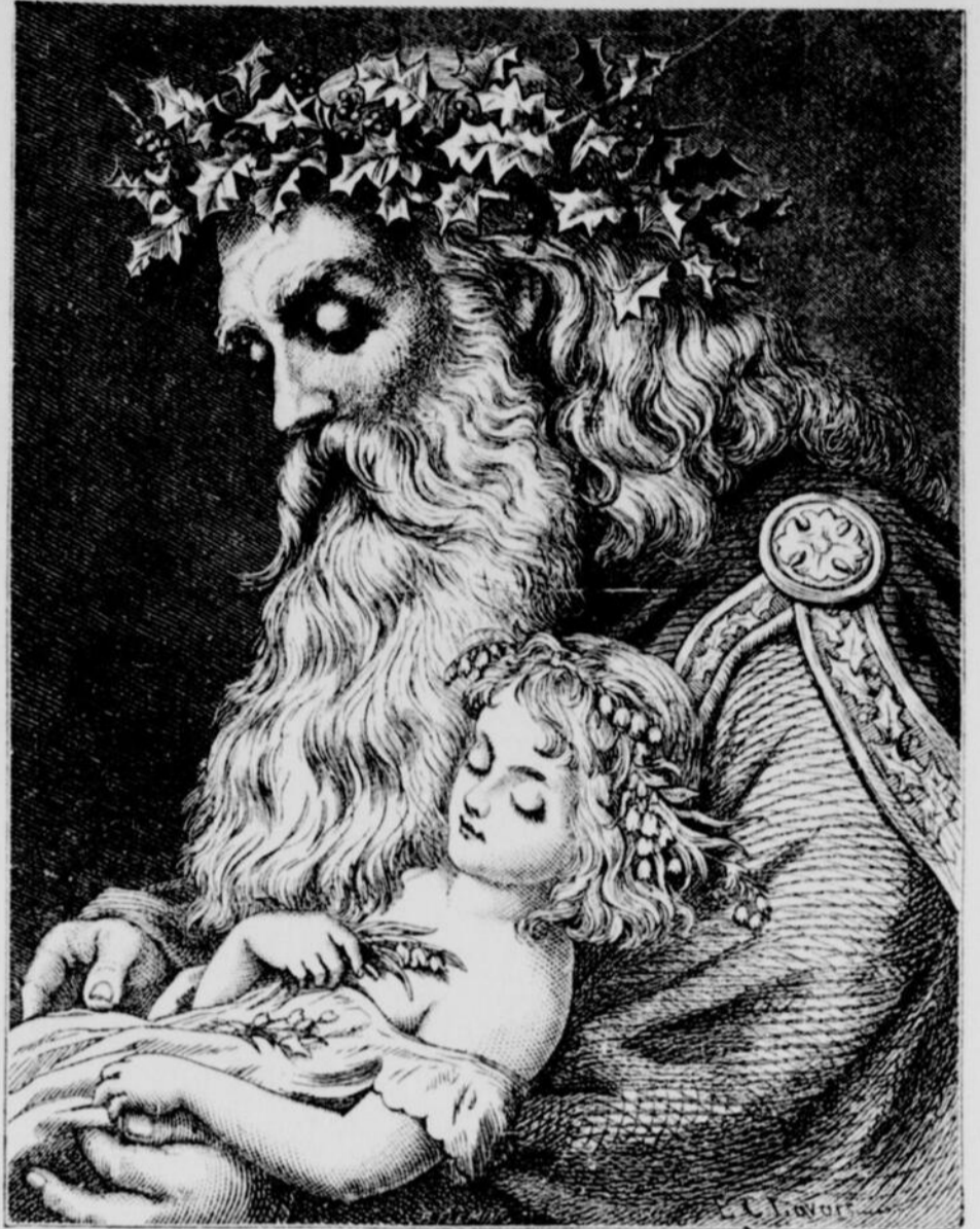
LE PERE NOEL ET SA FAVORITE