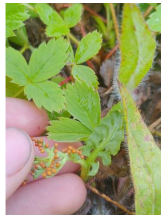
Figure 16. Botrychium aff. spathulatum .