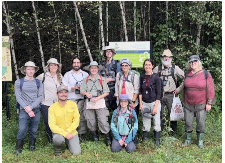
Figure 22. Une partie des nombreux participants de la première journée.

Le samedi matin, les membres de FloraQuebeca se sont retrouvés pour la première journée du Rendez-vous botanique annuel, qui allait se dérouler sur un territoire protégé par Nature-Action Québec, en périphérie de la tourbière Red Mills, à Trois-Rivières (Figure 22). Ce site exceptionnel comporte plusieurs types de milieux, dont une tourbière ombrotrophe en partie arbustive et en partie boisée, des zones sableuses ainsi que des étendues d'eau. La journée a débuté par l'exploration des zones sableuses. Bien que ces dernières soient perturbées et que leur flore semblait plutôt banale, elles recelaient quelques surprises. Nous y avons notamment observé des cypéracées peu communes, telles que le bulbostyle capillaire ( Bulbostylis capillaris ; Figure 23), le rhynchospore capillaire ( Rhynchospora capillacea ) et le fimbristyle d'automne ( Fimbristylis autumnalis ). Plusieurs orchidées ont également été vues, comme le liparis de Loesel ( Liparis loeselii ), la pogonie langue-de-serpent ( Pogonia ophioglossoides ) ainsi que plusieurs magnifiques spiranthes en pleine floraison. D'ailleurs, ces dernières ont intrigué plusieurs membres par la grande variabilité de leurs pièces florales. Le rare jonc de Greene ( Juncus greenei ; Figure 24) a été repéré à plusieurs endroits dans ces zones.