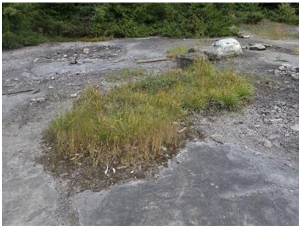
Figure 36. Second site sur l’affleurement.

introduits est plus grande : Scirpus pendulus , Scirpus sp., Sporobolus neglectus , Panicum philadelphicum , Lycopus americanus , Agrostis stolonifera , Poa compressa , Echinochloa muricata ainsi que diverses espèces des genres Taraxacum , Lythrum , Hieracium et Phleum . Certaines populations de leucospore se trouvent autour de restes de feux.