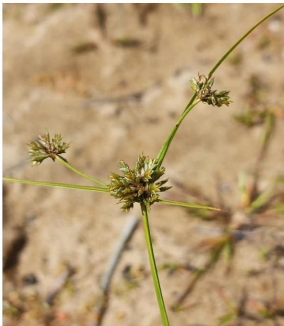
Figure 25. Souchet grêle ( Cyperus lupulinus subsp. macilentus ).