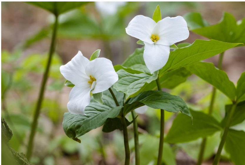
Figure 5. Trille blanc ( Trillium grandiflorum ).

Une dizaine de personnes étaient présentes pour explorer les érablières, les chênaies et les cédrières riches de ce secteur de la Rive-Sud de Québec, durant le pic de la floraison printanière. Plusieurs espèces typiques de ces milieux ont été observées, tels le trille rouge ( Trillium erectum ), l'érythron d'Amérique ( Erythronium americanum subsp. americanum ), le ginseng à trois folioles ( Panax trifolius ) et l'uvulaire à feuilles sessiles ( Uvularia sessilifolia ). L'exploration de certains secteurs d'affleurements calcaires humides a mené à la découverte de plusieurs colonies d'hépatique à lobes aigus ( Hepatica acutiloba ; Figure 4) et d'hépatique d'Amérique ( H. americana ) ainsi que d'un petit nombre de spécimens de trille blanc ( Trillium grandiflorum ; Figure 5), ce qui constitue une nouvelle mention de cette espèce pour la région et une de ses localités les plus nordiques.