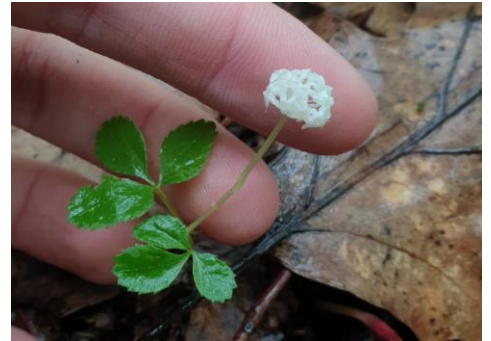
Figure 8. Ginseng à trois folioles ( Panax trifolius ).

Le groupe s'est ensuite déplacé à Cantley dans une riche érablière à caryer présentant en sous-bois des affleurements rocheux calcaires. Nous avons pu observer de grandes colonies de Cardamine concatenata , d'autres plantes printanières ainsi que de nombreuses espèces de carex ( Carex albursina , C. hirtifolia , C. pedunculata , etc.) et de Poacées ( Schizachne purpurascens , Milium effusum ). Nous avons aussi relevé la présence de plusieurs fougères ( Cystopteris tenuis , Adiantum pedatum et Dryopteris marginalis ), d'orchidées ( Cypripedium parviflorum et Galearis spectabilis ) et de quelques spécimens de Panax trifolius (Figure 8).