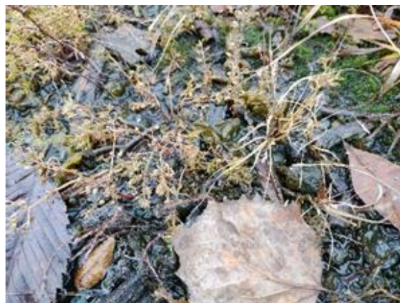
Figure 32. Milieu humide.

Lors d'une brève excursion à la forêt Boucher, une forêt urbaine située dans le secteur Aylmer de la ville de Gatineau, en Outaouais, une petite plante aux feuilles très divisées a attiré notre attention : la leucospore multifide [ Leucospora multifida (Michx.) Nutt.]. Il s'agit d'une espèce indigène annuelle nord-américaine de la famille des Plantaginacées. Ses feuilles rappellent celles de la petite herbe à poux ( Artemisia artemisiifolia ), et son port ressemble à celui des Gratiola , avec ses tiges rameuses. On la retrouve dans les milieux ouverts calcaires souvent inondés, sur les sables humides, sur les berges vaseuses et au bord des étangs (Figure 32).