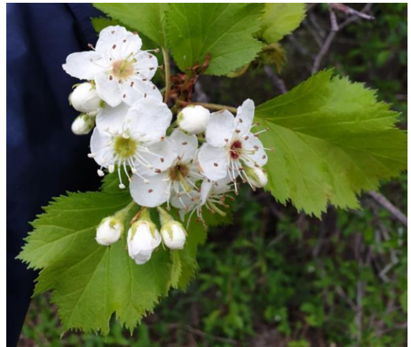
Figure 7. Fleurs et feuilles doublement dentées de l’aubépine du Canada ( Crataegus canadensis ).