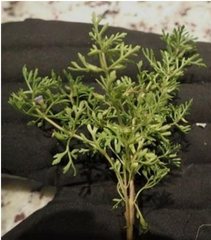
Figure 38. Plante entière.