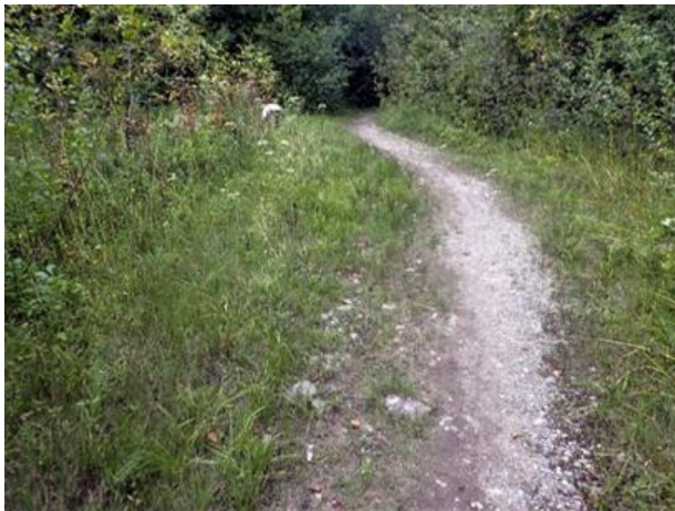
Figure 34. Premier site le long du sentier.

Sur le site, on retrouve des espèces de petite taille dont les Cyperus bipartitus , Muhlenbergia uniflora , Euphrasia stricta , Juncus articulatus , Juncus dudleyi , Proserpinaca palustris , Agalinis tenuifolia , Ambrosia artemisiifolia , Carex aurea , C. conoidea , C. viridula et Lycopus uniflorus ; parmi les espèces adjacentes plus grandes figurent les Scirpus pendulus , Euthamia graminifolia , Rhamnus cathartica , Lythrum salicaria et Equisetum variegatum .