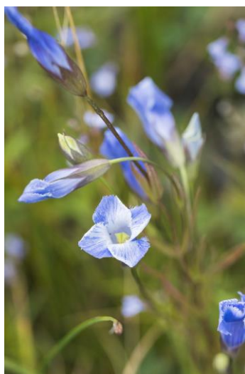
Figure 20. Gentiane de Victorin ( Gentianopsis virgata subsp. victorinii ).