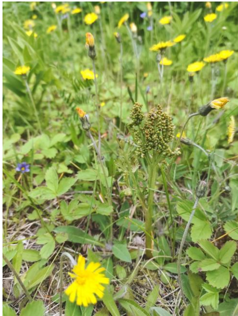
Figure 17. Botrychium matricariifolium .

Hormis les botryches, certains taxons intéressants d'un point de vue biogéographique ou encore peu fréquents ont été observés. Parmi ceux-ci, notons l'osmorhize obtuse ( Osmorhiza depauperata ), le carex atratiforme ( Carex atratiformis ), l'éléocharide naine ( Eleocharis parvula ) ainsi que le pâturin superbe ( Arctopoa eminens ). Dans un milieu humide situé près du rivage se trouvait aussi une belle population de carex vacillant ( Carex vacillans ; Figure 18).