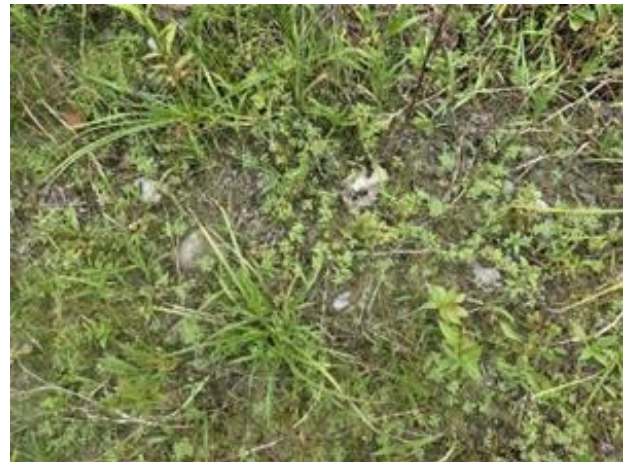
Figure 35. Leucospore multifide ( Leucospora multifida ) sur le premier site.

Au second site, sur l'affleurement calcaire presque dénudé (Figure 36 et Figure 37), des mares temporaires occupent les faibles dépressions. Les sols adjacents sont du type loam de St-Bernard à surface argileuse (2). La végétation y est très clairsemée. La leucospore multifide s'observe en bordure des mares asséchées, à l'est de l'affleurement. On y retrouve moins d'espèces compagnes, et la proportion de taxons