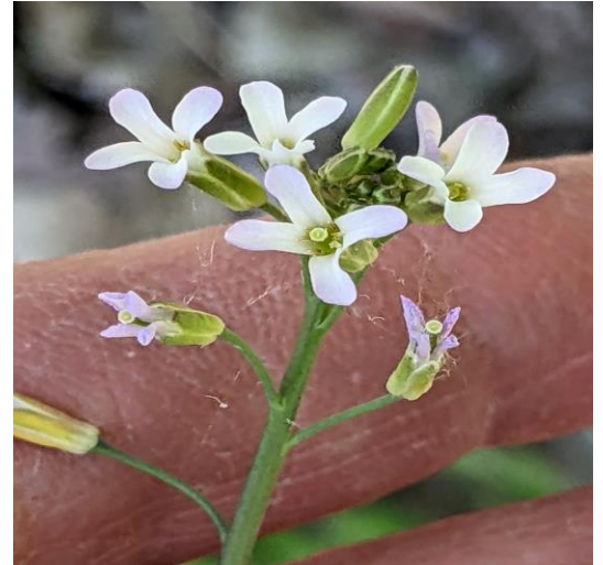
Figure 10. Arabette de Graham ( Boechera grahamii ) colonisant les affleurements de grès.

Le 18 juin 2023 : tourbière du lac Joncas, forêt Montmorency (réserve faunique des Laurentides); sortie organisée par Frédérick Létourneau et Martine Lapointe, une dizaine de participants. Texte de Frédérick Létourneau