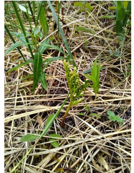
Figure 14. Botrychium angustisegmentum .

Comme l'île est assez longue (5,6 km) et que plusieurs secteurs semblaient propices aux botryches, une première visite a été effectuée le 2 juillet 2023 uniquement dans la partie ouest de l'île (2 participants). À notre arrivée à la pointe ouest, nous constatons que le milieu n'est pas propice à la présence de botryches, puisqu'il s'agit d'une prairie dominée par le rosier rugueux ( Rosa rugosa ), le pigamon veiné ( Thalictrum venulosum ) et l'élyme des sables ( Leymus mollis ). À notre grande surprise, nous observons tout de même un botryche à segments étroits ( Botrychium angustisegmentum ; Figure 14) poussant sur un tapis de mousses humide! Nous continuons notre prospection autour du lac à Canards, près de la pointe ouest de l'île. Cette fois-ci, nous trouvons un milieu humide dominé par des cypéracées et des fougères. Encore une fois, le milieu n'est pas optimal pour les botryches. Nous trouvons tout de même un petit bouton plus sec où se trouvaient quelques botryches, possédant tous le même morphotype : segments en éventail peu divisés, segments basilaires embrassant quelque peu le sporophore et trophophore sessile ou courtement pédonculé (Figure 15 et Figure 16). Ces spécimens ont été identifiés au Botrychium aff. spathulatum .