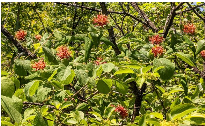
Figure 9. Chèvrefeuille dioïque ( Lonicera dioica ) en fleur.

La forêt Deschênes est l'un des derniers vestiges des forêts de chênes qui ont donné leur nom aux rapides et au lac du même nom, dans la rivière des Outaouais. Elle est un des rares endroits au Québec où l'on peut trouver trois espèces de chênes ( Quercus alba , Q. macrocarpa et Q. rubra ) et abrite la population québécoise de caryer ovale ( Carya ovata ) située le plus à l'ouest. On y trouve aussi des affleurements de grès gris occupés par des espèces associées aux sols secs et acides.