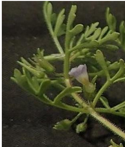
Figure 39. Fleur.