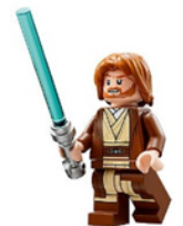
Figure 43. L'égo du Jedi Obe-Wan Kenobi

Plusieurs questions se posent. Pourquoi cette espèce se retrouve-t-elle là? Il s'agit manifestement d'une plante calcicole, et les sites où elle a été trouvée semblent indiquer que ce n'est pas une échappée de culture. Le sentier du premier site, peu fréquenté depuis nombre de décennies, longe des terres très humides et arbore une flore majoritairement indigène. L'affleurement calcaire du second site se situe à l'écart des routes et des