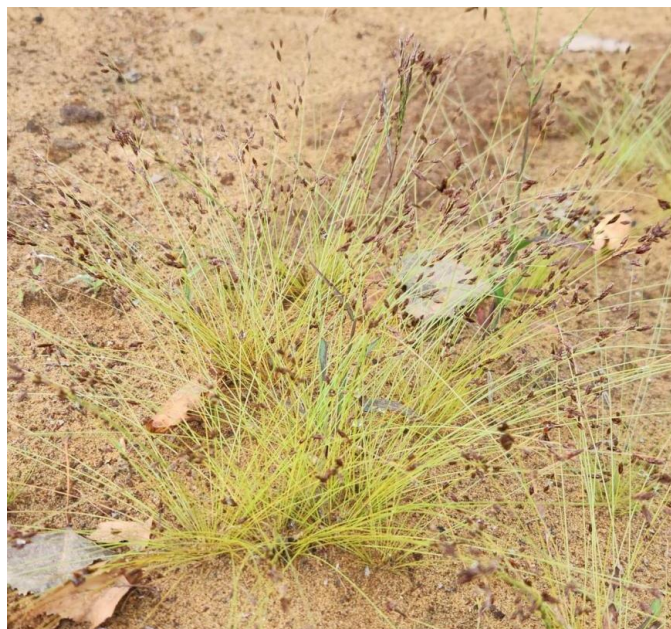
Figure 23. Bulbostyle capillaire ( Bulbostylis capillaris ).