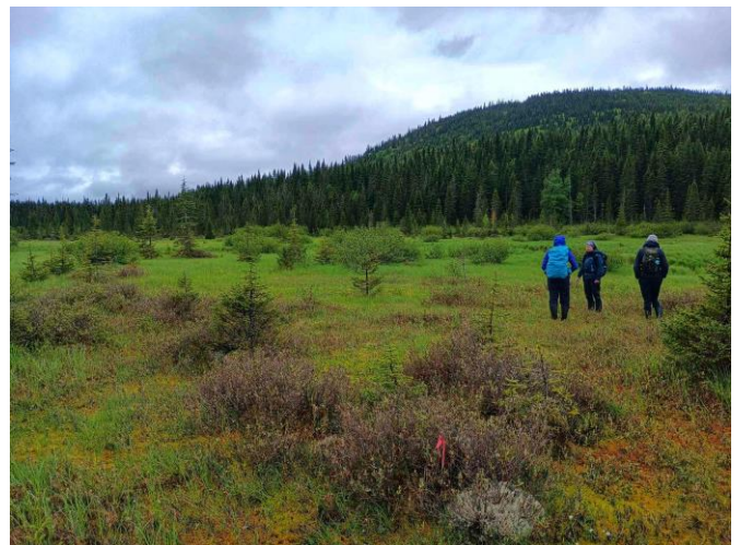
Figure 11. Tourbière du lac Joncas.

La météo changeante et drôlement printanière n'a pas empêché la dizaine de participants d'explorer la tourbière du lac Joncas, située au cœur du territoire de la Forêt d'enseignement et de recherche Montmorency (Université Laval) (Figure 11). Le groupe, principalement constitué de biologistes et d'autres professionnels de l'environnement, s'est montré grandement intéressé par les processus morphologiques, chimiques et physiques qui sont à l'œuvre dans les écosystèmes tourbeux et qui distinguent ces derniers des autres types de milieux humides du Québec. Ainsi, la nature du sol, l'hydrologie du milieu ainsi que les espèces présentes ont été passées au peigne fin, au grand bonheur des participants.