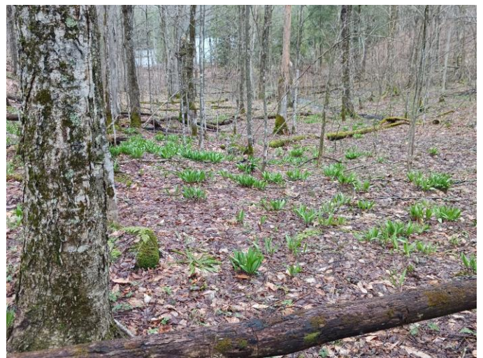
Figure 3. Colonie d’ail des bois ( Allium tricoccum ) dans une étroite vallée riche et humide en bas de pente d’une des collines environnantes.

Cette visite printanière régulière et amusante permet de se remettre à la botanique après un long hiver et de revoir le sympathique visage de gens qui partagent un même intérêt pour la flore du Québec.