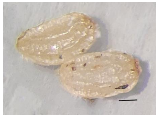
Figure 42. Graines (échelle = 100 \mu m).

Un fait cocasse! En synonymie de Leucospora on retrouve le genre Conobea . Aux amateurs de films de science-fiction, un des noms vernaculaires anglais, « obe-wan-conobea », rappellera probablement Obe-Wan Kenobi, le maître Jedi de la série cinématographique Star Wars de George Lucas (Figure 43).