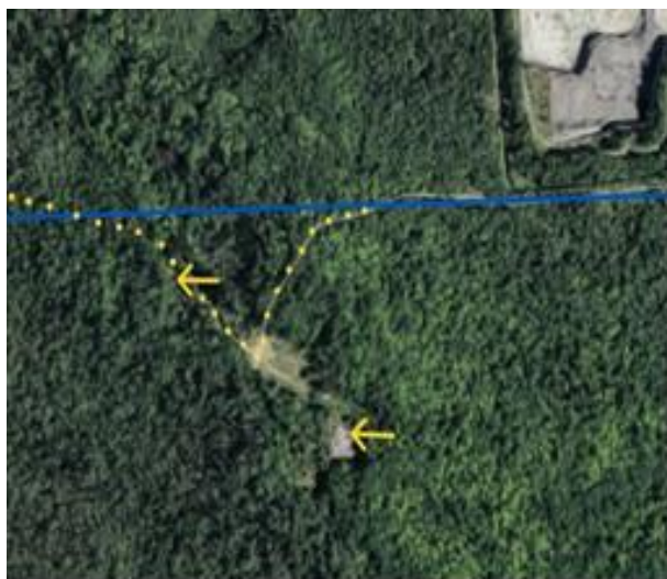
Figure 33. Aperçu de la zone : en pointillé, trajet approximatif de l'ancien chemin Boucher, la ligne bleue représentant la limite nord de la forêt Boucher, et les flèches jaunes, les deux sites distancés d'environ 250 mètres.

Cette découverte est d'autant plus intéressante que la leucospore multifide n'avait encore jamais été observée au Canada en dehors de l'Ontario. L'espèce se rencontre principalement en Illinois et au Missouri, dans le Midwest américain, et sa répartition connue s'étend depuis l'Ohio jusqu'au Nebraska et au Texas. En Ontario, les seuls sites répertoriés sont l'île Pelée (comté d'Essex), Cedar Springs (comté de Chatham), Southwold (comté d'Elgin) et Middlemiss (comté de Middlesex) (1). Selon INaturalist, l'espèce aurait aussi été observée dans les régions de London et de Mississauga, mais l'identification de ces récoltes demeure à confirmer (M. J. Oldham, communication personnelle).