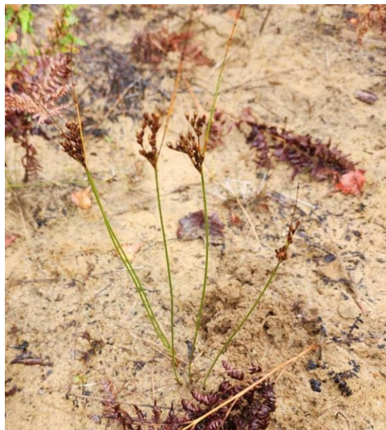
Figure 24. Jonc de Greene ( Juncus greenei ).