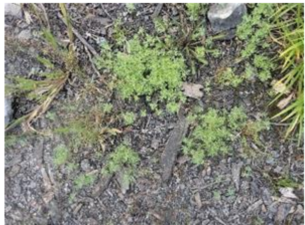
Figure 37. Leucospore multifide ( Leucospora multifida ) sur le second site.