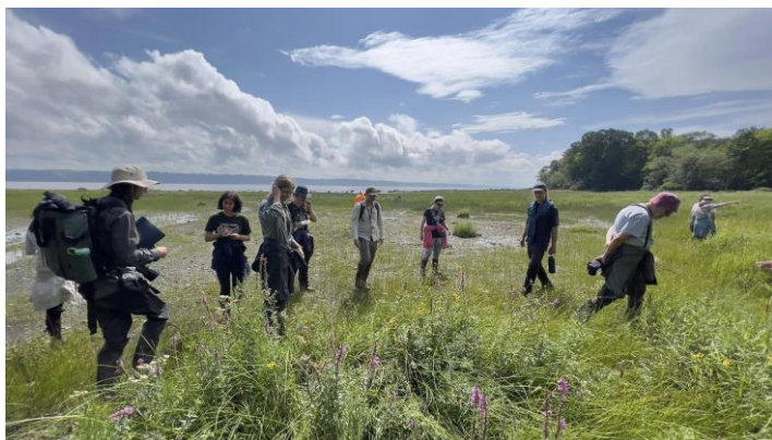
Figure 19. Les participants explorant un marais d’estuaire d’eau douce au parc des Hauts-Fonds.

Une dizaine de personnes ont exploré, à marée basse, la richesse qu’offrent les marais d’estuaire d’eau douce du Saint-Laurent (Figure 19). Situés pour la plupart dans des baies le long du littoral, ces marais se développent à l’abri des plus forts courants du fleuve. C’est avec engouement que plusieurs amateurs et plusieurs professionnels du milieu de l’environnement ont exploré plusieurs facettes de l’écosystème, dont différents processus fondamentaux. Les participants ont pu s’initier à la caractérisation du haut marais et du bas marais. Dans le haut marais, plusieurs espèces d’intérêt ont été observées, comme la gentiane de Victorin ( Gentianopsis virgata subsp. victorinii ; Figure 20), la platanthère petite-herbe ( Platanthera flava var. herbiola ), la physostégie de Virginie ( Physostegia virginiana subsp. virginiana ), la gérardie à feuilles ténues ( Agalinis tenuifolia ), la campanule faux-gaillet ( Palustricodon aparinoides var. aparinoides ) ainsi que la lobélie cardinale ( Lobelia cardinalis ). Dans le bas marais, le scirpe piquant ( Schoenoplectus pungens ), le souchet des rivières ( Cyperus bipartitus ) ainsi que l’ériocaulon de Parker ( Eriocaulon parkeri ; Figure 21) ont été aperçus en grand nombre. Au total, plus de 40 espèces ont été observées.