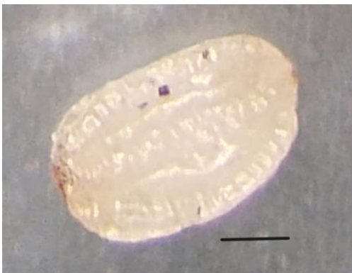
Figure 41. Graine (échelle = 100 \mu m).