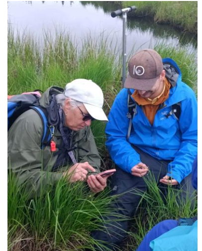
Figure 13. Identification de carex.

Parmi les espèces notables, la chicouté ( Rubus chamaemorus ), en fleur, était largement répandue dans la tourbière (Figure 12). Les Éricacées, groupe dominant de ce type de tourbière, étaient évidemment présentes, comme le thé du Labrador ( Rhododendron groenlandicum ), le cassandre caliculé ( Chamaedaphne calyculata ), le kalmia à feuille d'andromède ( Kalmia polifolia ), le kalmia à feuilles étroites ( Kalmia angustifolia ) ainsi que l'andromède glauque ( Andromeda polifolia var. latifolia ). Parmi les herbacées, le carex chétif ( Carex magellanica subsp. irrigua ) était très dominant, tout comme le carex pauciflore ( Carex pauciflora ) (Figure 13).