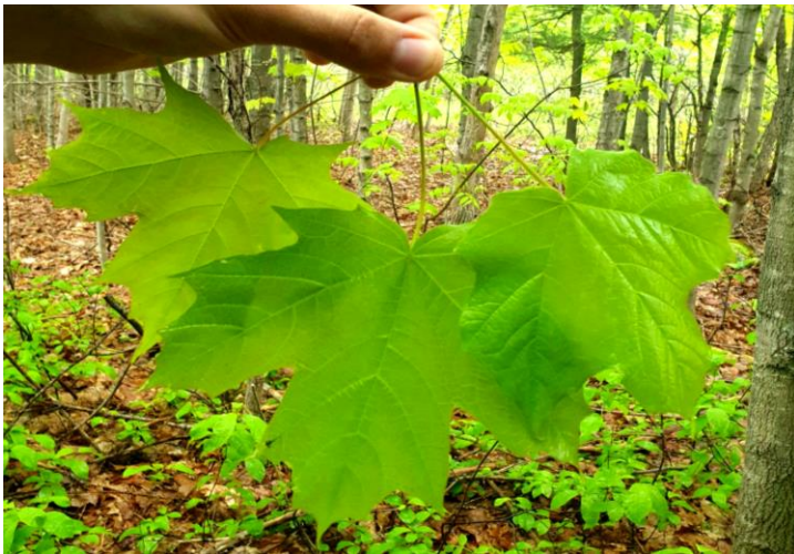
Figure 6. Feuilles de l’érable à sucre ( Acer saccharum ) (à gauche), de l’érable noir ( Acer nigrum ) (à droite) et de l’hybride (au centre).

Dans un premier temps, nous avons visité à Limbour une érablière à érable à sucre et ses abords qui comportaient plusieurs types de milieux plus ou moins perturbés : une cédrière, des affleurements de marbre, un ruisseau ainsi que des terrains assez ouverts. Un des buts de cette sortie était d’observer des érables noirs ainsi que la floraison des aubépines du secteur, entre autres pour tenter de confirmer l’identification d’un Crataegus canadensis , plutôt rare dans la région et observé l’année précédente. Dans l’érablière, nous avons observé plusieurs plantes printanières, de nombreux spécimens d’érable noir ( Acer nigrum ), ainsi que l’hybride entre ce dernier et l’érable à sucre ( Acer saccharum ). Chez les individus hybrides, la forme des feuilles se rapproche de celle observée chez l’érable noir, mais les nervures sont peu pubescentes sur la face inférieure (Figure 6). Le long du ruisseau, nous avons observé une rangée d’orme liège ( Ulmus thomasi ) ainsi que plusieurs espèces d’aubépines, toutes en fleur : le Crataegus submollis en quantité, le C. fluviatilis et le C. macracantha . Finalement, un spécimen de Crataegus canadensis a été trouvé par Étienne Lacroix-Carignan, et son identification a été confirmée entre autres par les fleurs munies de 18 à 20 étamines (Figure 7).