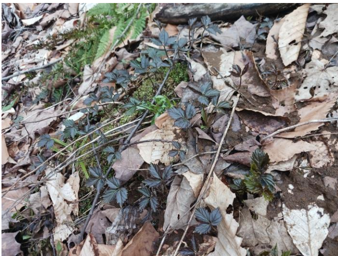
Figure 2. Coloration particulière du feuillage de la dentaire à deux feuilles ( Cardamine diphylla ) au tout début du printemps.

Dans les milieux humides et riches, de grandes colonies de dentaire à deux feuilles ( Cardamine diphylla ) couvraient les rives des ruisseaux, dont les eaux sont toujours bien vives au printemps. Chez cette espèce, la coloration du feuillage est particulièrement foncée et luisante au tout début du printemps ( Figure 2 ). Par ailleurs, la présence de nombreuses colonies d’ail des bois ( Allium tricoccum ) dans une étroite vallée boisée surplombant une tourbière minérotrophe riveraine m’a agréablement surpris (Figure 3).