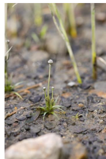
Figure 21. Ériocaulon de Parker ( Eriocaulon parkeri ). Photo de Frédérick Létourneau.