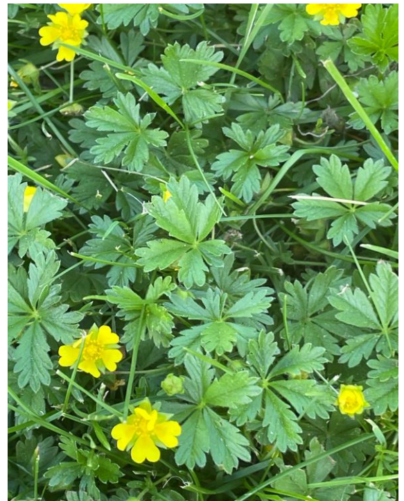
Figure 1. Potentille de printemps ( Potentilla verna ). Photo de Lucie Mercier LM-2061.

Bien sûr, puisque la potentille du printemps vient d'être découverte au Québec, elle n'est pas mentionnée dans la Flore laurentienne (3). Par contre, les photos de la plante sont nombreuses sur Internet. La nôtre (Figure 1) laisse voir la forme caractéristique des fleurs et des feuilles. Les botanistes sont donc conviés à vérifier la présence de cette nouvelle venue, qui peut même pousser sur les terrains engazonnés que l'on piétine.