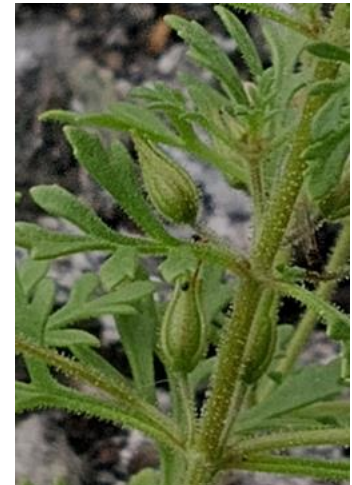
Figure 40. Capsules.