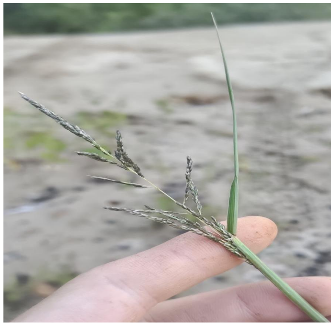
Figure 26. Sporobole à fleurs cachées ( Sporobolus cryptandrus ).