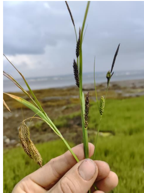
Figure 18. Le Carex vacillans (au centre) avec ses espèces parentes, le Carex paleacea (à gauche) et le Carex nigra (à droite).

Enfin, nous avons pu observer cinq espèces de pyroles en pleine floraison, soit la pyrole mineure ( Pyrola minor ), la pyrole à feuilles d'asaret ( P. asarifolia ), la pyrole elliptique ( P. elliptica ), la pyrole à fleurs verdâtres ( P. chlorantha ) ainsi que la pyrole unilatérale ( Orthilia secunda ).