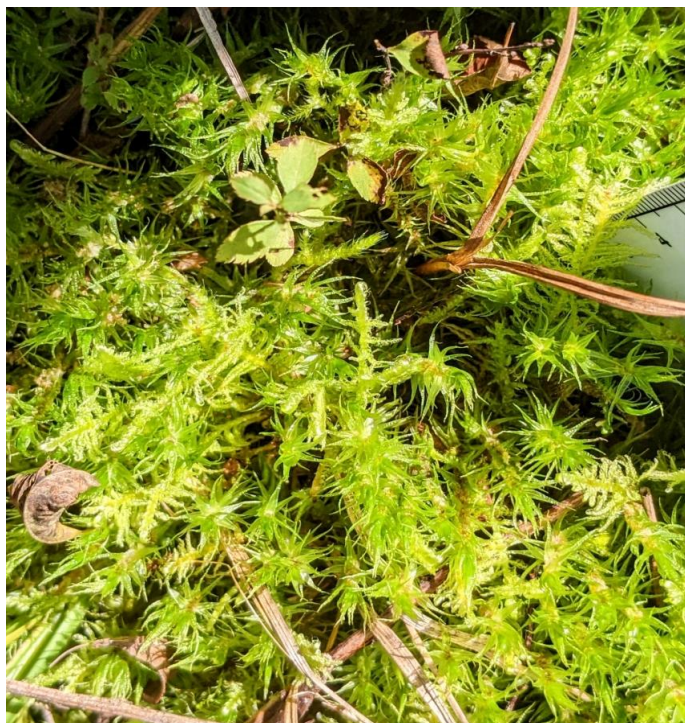
Figure 30. Mousses observées sous l'emprise électrique. Le dicrane à soies multiples ( Dicranum polysetum ) est ici accompagné de la faucille à feuilles plissées ( Sanionia uncinata ).