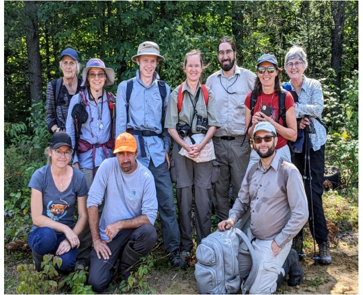
Figure 29. Participants de la deuxième journée du Rendez-vous botanique.