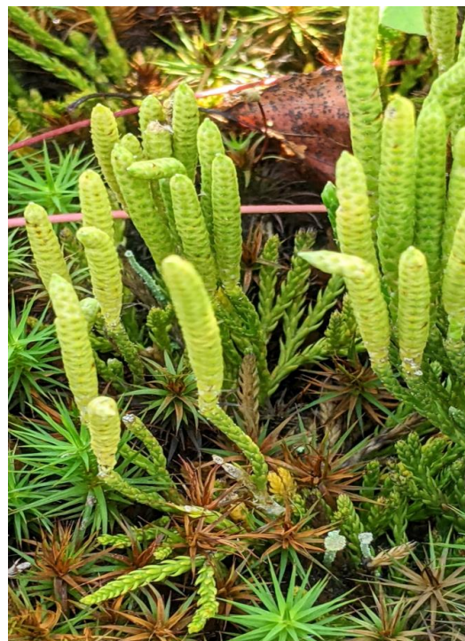
Figure 31. Le lycopode à feuilles de genévrier ( Diphasiastrum ×sabinifolium ), issu du croisement entre le D. sitchense et le D. tristachyum . Photo de Marie-France Germain.