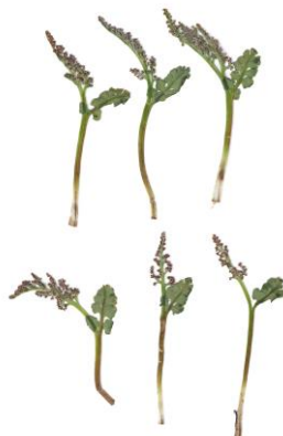
Figure 15. Botrychium aff. spathulatum , spécimen MAV0083 (MT).