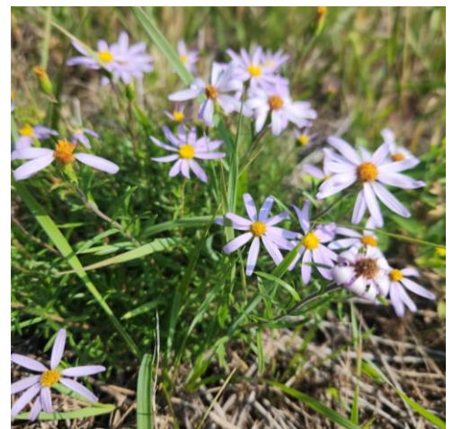
Figure 28. L'aster à feuilles de linnaire ( Ionactis linariifolia ), en pleine floraison.

En fin de journée, une dizaine de participants se sont rendus sous une ligne de transport électrique située à proximité du site (à environ 1 km à vol d'oiseau) pour observer l'aster à feuilles de linnaire ( Ionactis linariifolia ; Figure 28), qui était alors en pleine floraison. Cette espèce désignée menacée au Québec se rencontre principalement dans la région de Trois-Rivières. Une centaine de colonies d'aster à feuilles de linnaire occupent ce milieu sablonneux maintenu ouvert par l'entretien de la végétation de l'emprise électrique. Des peuplements naturels de pin gris bordent le site. L'extension appréciable de cette population déjà connue résulte des observations réalisées par Jean-Philippe Gagnon à partir de photographies aériennes et validées sur le terrain lors de la journée du 27 août.