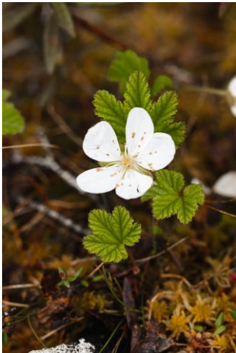
Figure 12. Chicouté ( Rubus chamaemorus ).

Parmi les espèces notables, la chicouté ( Rubus chamaemorus ), en fleur, était largement répandue dans la tourbière (Figure 12). Les Éricacées, groupe dominant de ce type de tourbière, étaient évidemment présentes, comme le thé du Labrador ( Rhododendron groenlandicum ), le cassandre caliculé ( Chamaedaphne calyculata ), le kalmia à feuille d'andromède ( Kalmia polifolia ), le kalmia à feuilles étroites ( Kalmia angustifolia ) ainsi que l'andromède glauque ( Andromeda polifolia var. latifolia ). Parmi les herbacées, le carex chétif ( Carex magellanica subsp. irrigua ) était très dominant, tout comme le carex pauciflore ( Carex pauciflora ) (Figure 13).