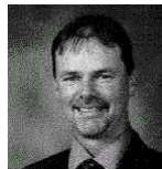
8 Bernard Caron Cayamant, Wright et Lac-Rapide