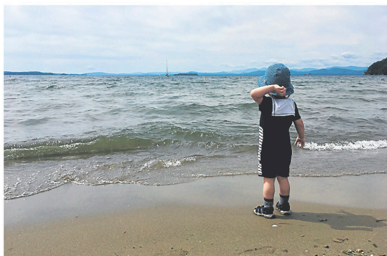
Le lac Champlain

skinnypancake.com americanflatbread.com augustfirstvt.com citymarket.coop