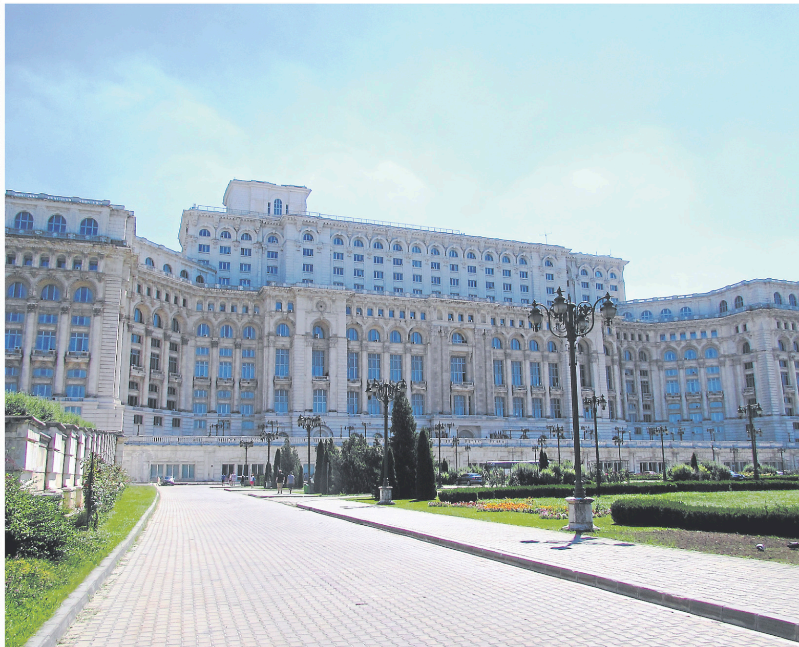
Le palais du Parlement, à Bucarest, est le deuxième plus grand bâtiment administratif du monde.

Suivez mes aventures au www.jonathancusteau.com