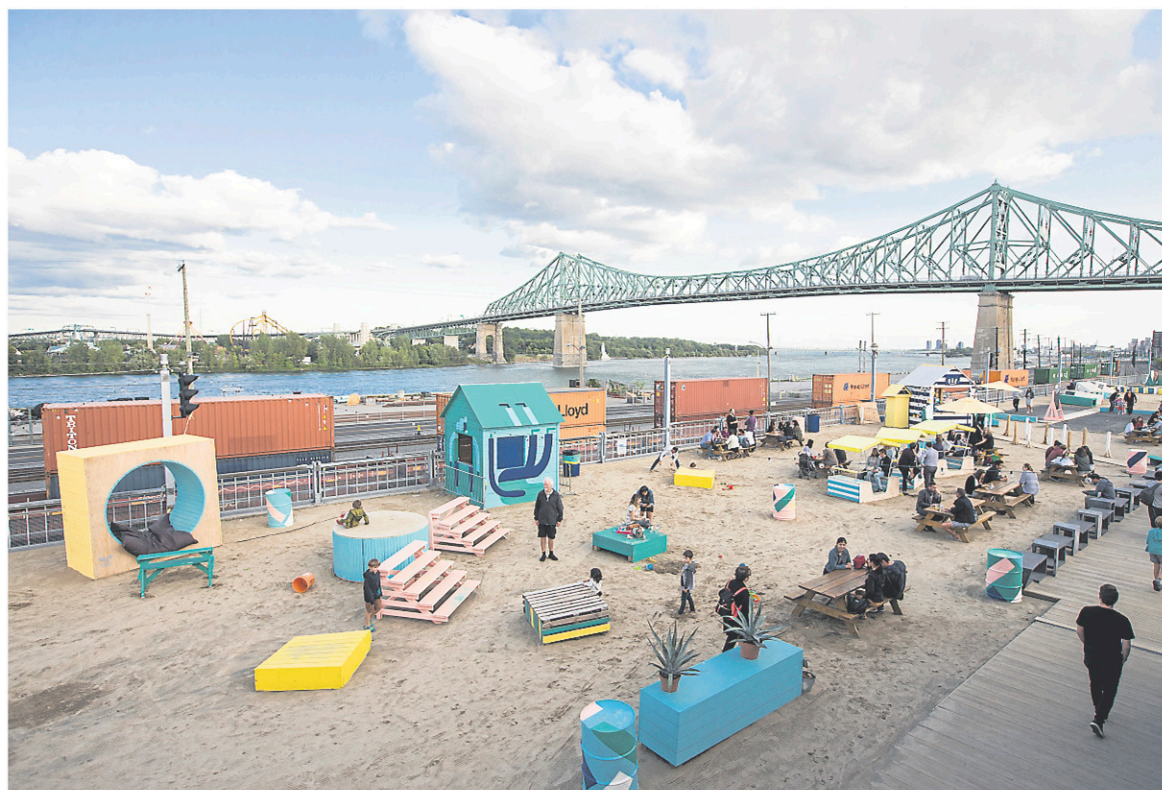
Le Village au Pied-du-Courant