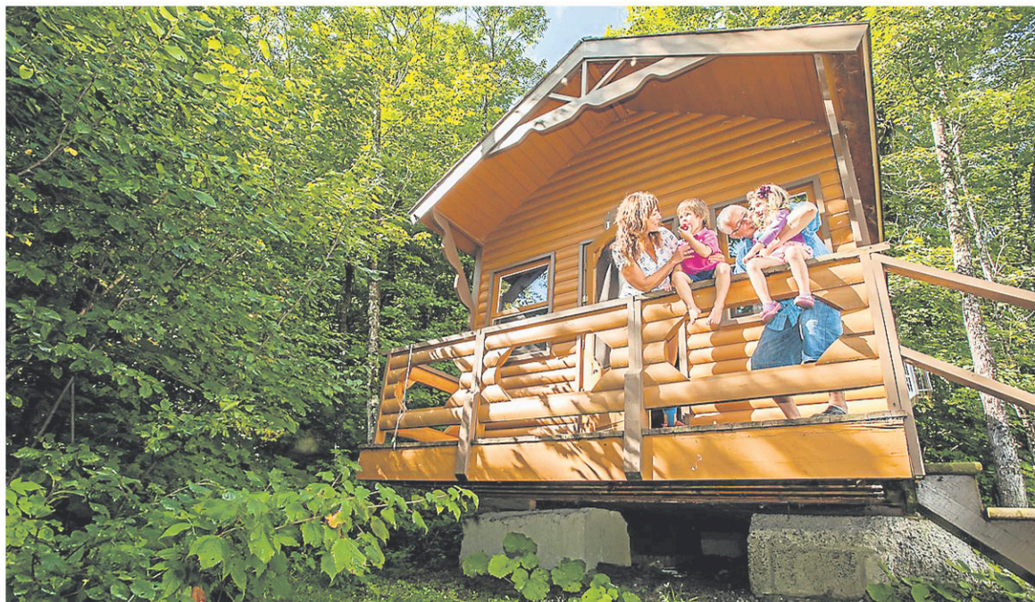
Une maisonnette du Camping et cabines du Sommet de Morin Heights