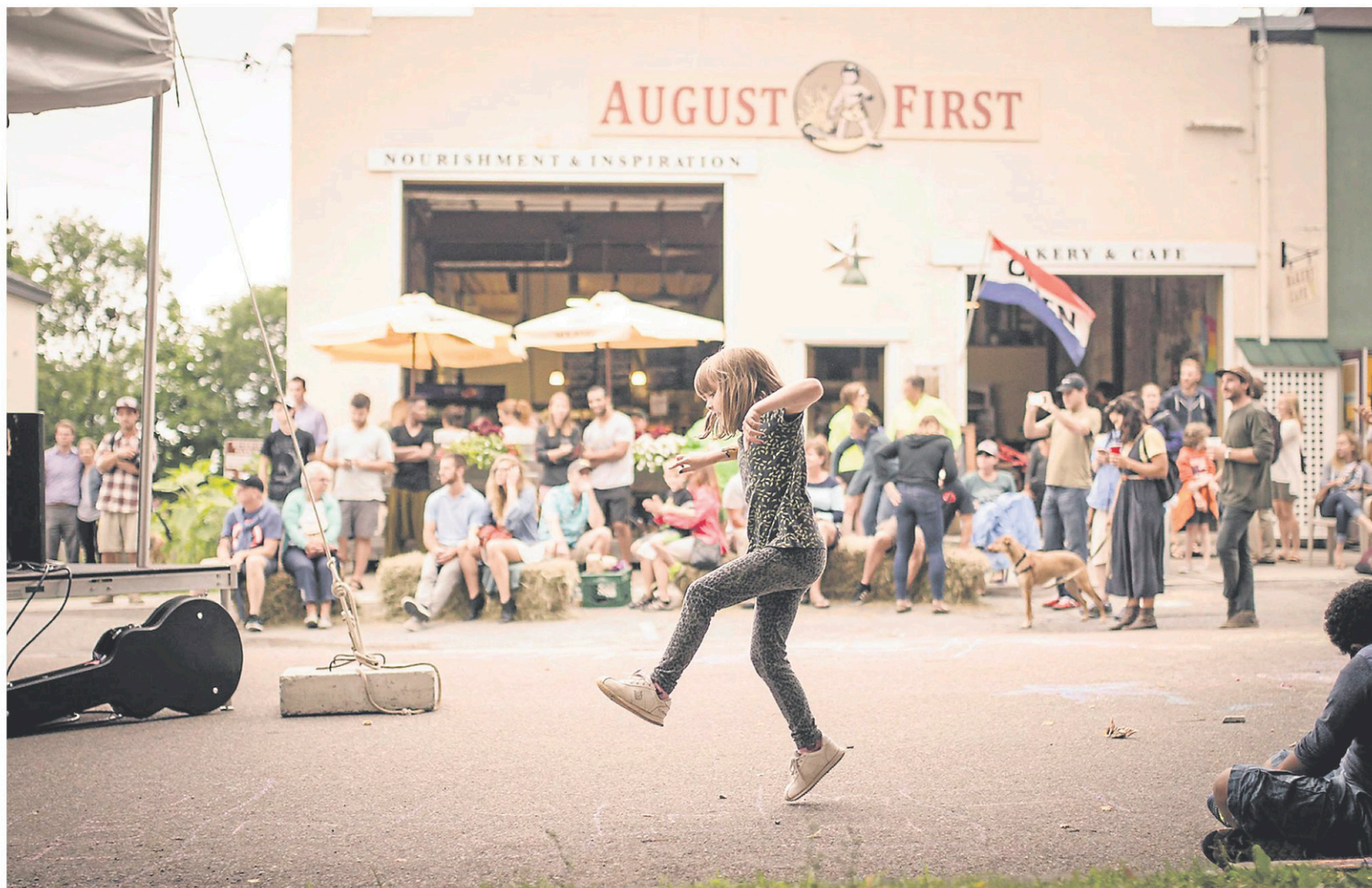
La boulangerie et le restaurant August First à Burlington

Les fermes Shelburne tiennent davantage du château de conte pour enfants que du bâtiment agricole habituel : c'est un domaine immense (5,6 km 2 !), dessiné par nul autre que l'architecte Frederick Law Olmsted, celui-là même qui signa l'aménagement du mont Royal et de Central Park, au début du XXe siècle. Depuis près de 50 ans, on s'y consacre à sensibiliser la population aux principes de l'agriculture durable, avec un programme bien rempli pour les enfants. Sitôt arrivés, ils pourront nourrir les poules, apprendre à traire une vache ou à faire du fromage, alouette: les éducateurs sont nombreux et attentionnés. L'endroit est parfait pour un pique-nique, dans l'herbe ou sur le bord du lac Champlain. Un petit casse-croûte vend des sandwiches préparés sur place, avec des ingrédients