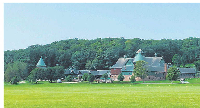
Les fermes Shelburne — PHOTO LA PRESSE, VIOLAINE BALLIVY

Incroyable mais vrai, des touristes reviennent de Burlington sans même avoir vu le magnifique lac Champlain, scotchés qu'ils sont restés dans les boutiques de la rue Church. S'il n'y avait qu'une raison d'y aller, c'est pourtant celle-ci, immense étendue d'eau bleutée où les gamins s'amuse, sans fin, à lancer des cailloux au plus loin de leurs petits bras, à barboter dans les vagues, à construire des châteaux de sable éphémères. La promenade en bois, près du centre-ville, est parfaite pour admirer les couchers de soleil, alors qu'on profitera plutôt des plages publiques pendant la journée, avec d'autant plus de plaisir si on a apporté (ou loué) des vélos pour filer sur la piste cyclable menant au chapelet d'îles du lac Champlain.