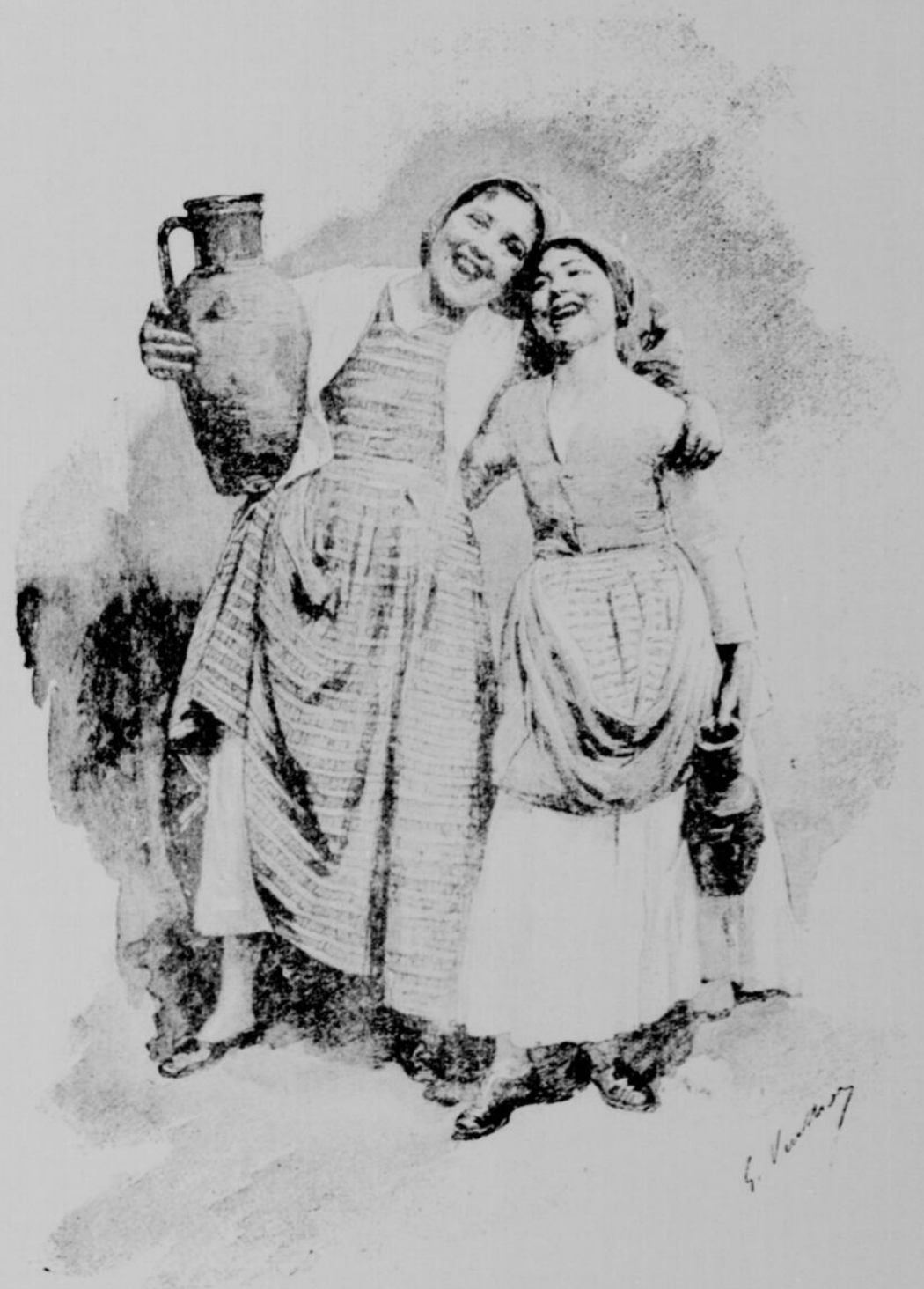
FILLES DU PEUPLE DE PALERME