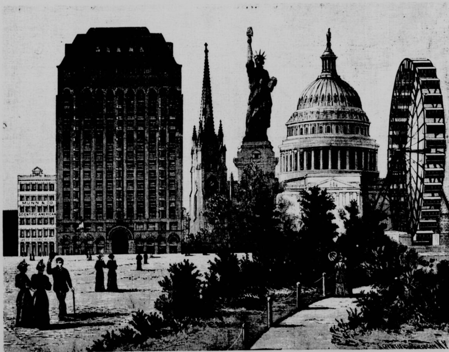
Temple Maçonnique Eglise de la Trinité, N.Y. Statue de la Liberté, N.Y. Capitol, Washington La roue Ferris ÉDIFICES REMARQUABLES AUX ÉTATS-UNIS