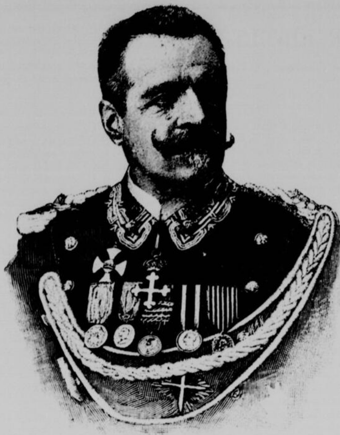
LE GÉNÉRAL MORRA GOUVERNEUR-GÉNÉRAL DE SICILE