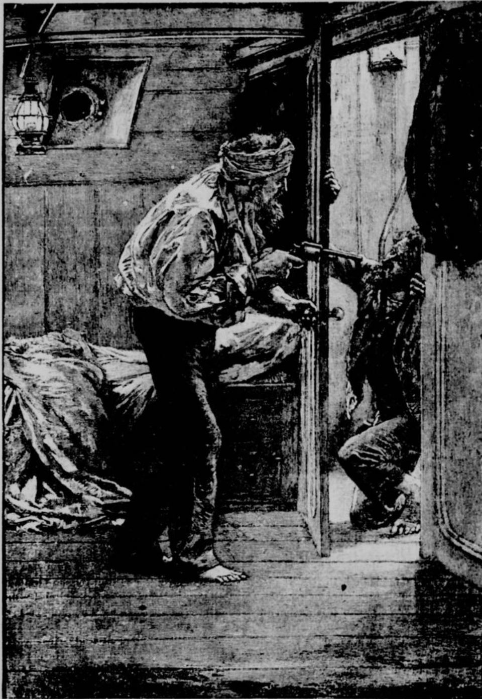
Il y trouve le matelot Hendriesen. — Page 512, col. 3

Le capitaine Clarke, le traînant à ses pieds, lui demanda s'il se trouvait parmi les mutins ; l'homme