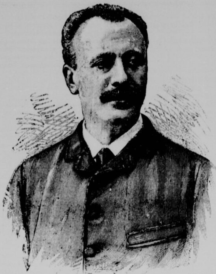
M. LE COMTE DE MUN ÉLU DÉPUTÉ DE MORAIX, LE 21 JANVIER 1894