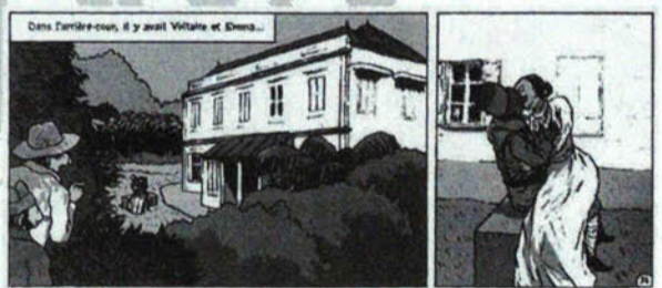
La grippe coloniale de Huo-Chao-Si et Appollo