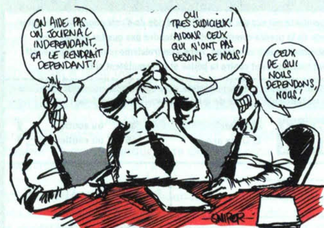
LE RECTO-VERSO DES FONDS PUBLICS !!!