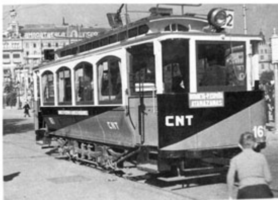
Le réseau de tramway à Barcelone a connu son apogée d'utilisation et d'efficacité lorsqu'il fut sous le contrôle direct des travailleurs

Bien que la révolution fût, au bout du compte, éphémère, et que les communes n'ont pas eu le temps de mûrir, il demeure que la Catalogne libertaire était véritablement un exemple d'utopie. Grâce à un travail d'éducation populaire sur les idées anarchistes et un contexte social et politique propice aux idées