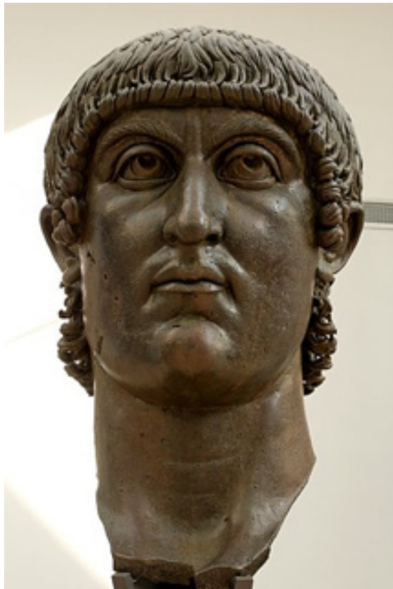
Flavius Valerius Aurelius Constantinus est né à Naissus en Mésie (aujourd'hui Niš en Serbie) en 272. Il est proclamé 34 e empereur romain sous le nom Constantin Ier en 306 par les légions de Bretagne. Il est mort en 337.

d'exister à partir de l'an 476), et elle donna suite à une période de chaos, de dislocation et de guerres, une des plus sombres de l'histoire européenne, que l'on désigne sous le vocable d'Âge des Ténèbres, laquelle perdura pendant 600 ans, soit jusqu'aux environs de l'an 1000.