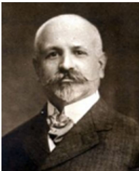
Francisco Ferrer Guardia, 1859-1909, libre-penseur, franc-maçon et pédagogue libertaire espagnol, père de l'éducation humaniste, centrée sur l'enfant

Ainsi, à travers une véritable révolution populaire, le peuple espagnol est devenu le premier à expérimenter le communisme libertaire. Des agriculteurs et ouvriers d'usine, pauvres et souvent analphabètes, ont réussi à réfuter la notion selon laquelle toute société nécessite la présence de chefs, de patrons, de gouvernement, voir, d'autorité. L'historien français Gaston Leval, lui-même un participant à cette révolution, a estimé que 8 millions de personnes y ont contribué [1]. Le célèbre écrivain anglais George Orwell, lui-même volontaire dans une milice trotskiste en Espagne, raconta ses expériences en Catalogne libertaire, s'étonnant de comment la pensée