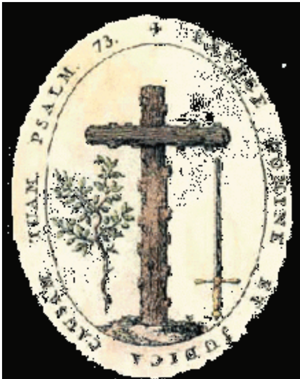
Sceau de l'Inquisition espagnole. Celle là fut une des entreprises les plus totalitaires et terroristes de l'histoire de l'humanité

Il faut se rappeler que dans le passé, l'excommunication catholique était, en pratique, une condamnation à mort puisque la victime perdait tous ses droits fondamentaux. L'Inquisition catholique ne fut en fait qu'une extension du châtement de l'excommunication.