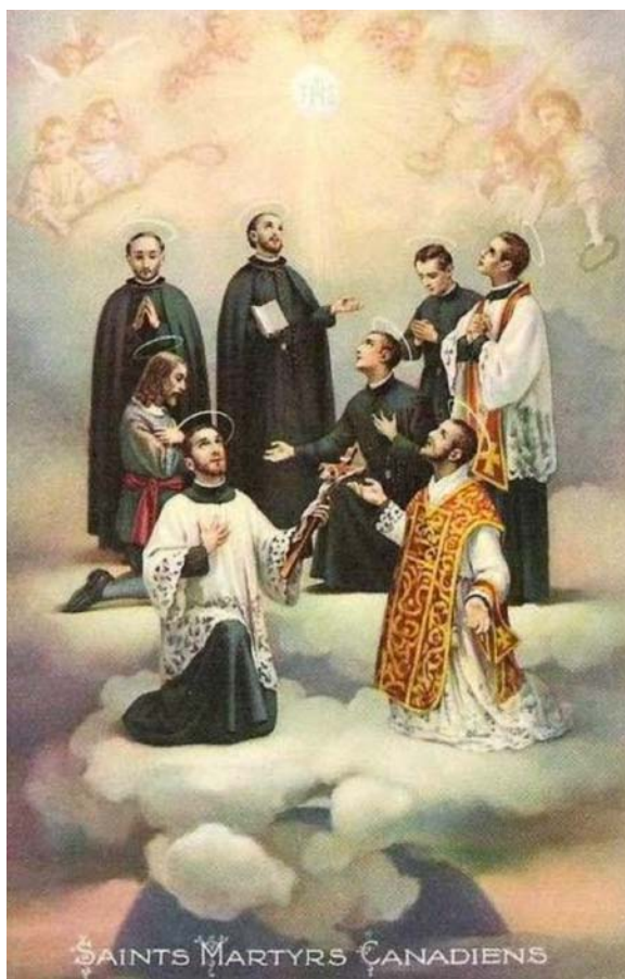
Cette composition, fournie que par Andréa Richard, illustre l'image d'eux-mêmes qu'ont les curés, prêtres et papes

Les clercs sont servis comme des rois et princes, par les femmes évidemment. Ces dernières n'ont jamais été considérées, hier et encore aujourd'hui, égales à ces hommes imbus d'eux-mêmes. Ces hommes ont été vénérés, adulés, protégés, financés, traités comme des Seigneurs méritant non seulement le respect, mais proposant qu'on baise l'anneau porté à leur doigt, que l'on s'agenouille devant eux pour obtenir leurs bénédictions, et au confessionnal, qu'on leur demande l'absolution des péchés commis, faisant d'eux des sauveurs pour préserver de l'enfer. Est-il étonnant, compte tenu de tout cela, que les laïcs soient considérés comme inférieurs ?