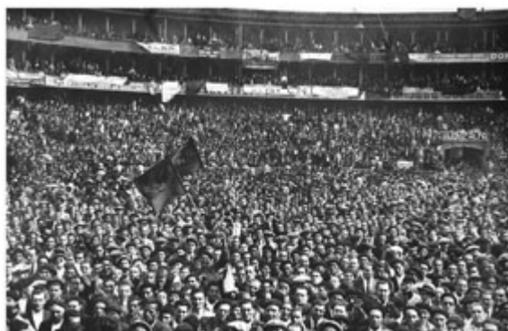
Le mouvement social qui s'est emparé de la Catalogne toucha des millions de personnes. Des assemblées populaires de ce genre étaient courantes.

sont concentrées autour de Barcelone et ailleurs en Catalogne. Ce fut une période où l'Espagne était dominée par une oligarchie politique contrôlant l'État et l'armée, en parallèle à l'Église catholique encore extrêmement influente. Cependant, malgré l'oppression de l'Église et de l'État, les théories syndicalistes et anarchistes y trouvèrent un terreau fertile.