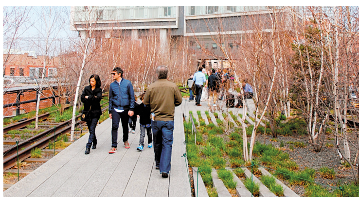
L'hôtel Standard enjambe le parc de la High Line, à New York.