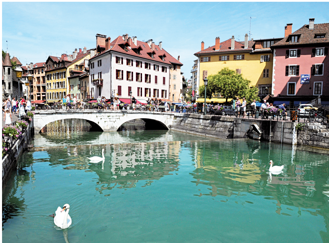
La rivière Thiou, dans la vieille ville d'Annecy, en France.

« Je viens de m'abonner au Devoir juste pour votre chronique, que je lisais toutes les semaines. Je me disais que le jour où ce