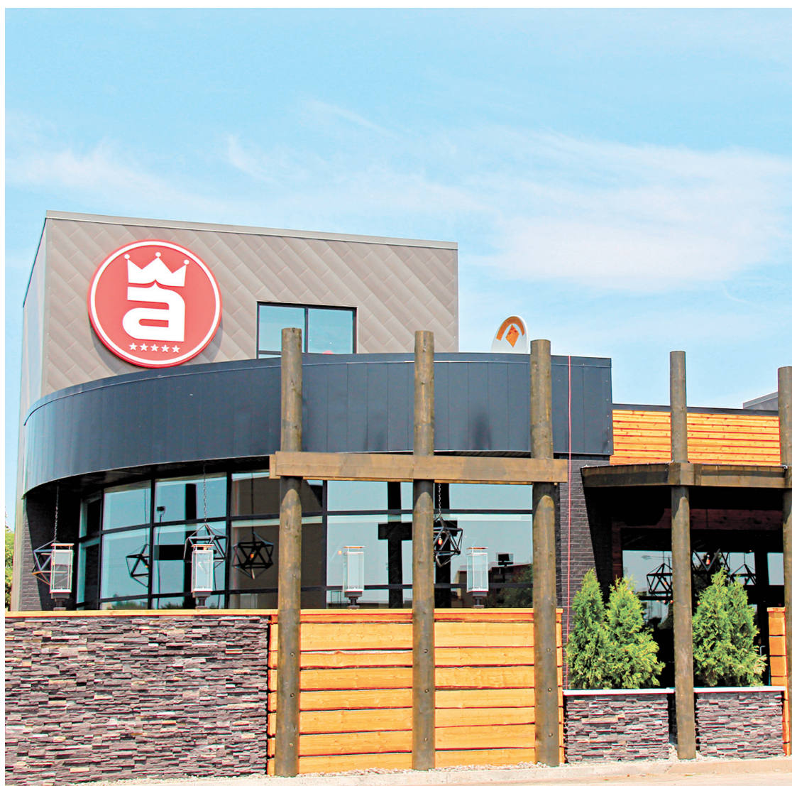
Le restaurant de la microbrasserie Archibald, version Sainte-Foy, à Québec.