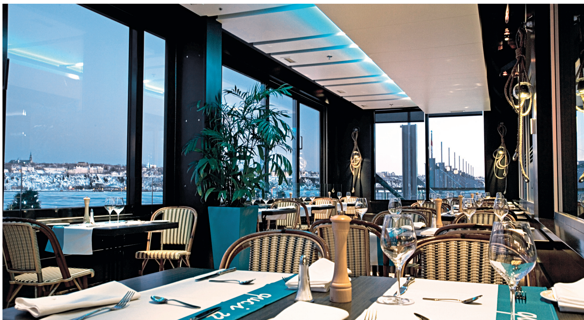
Le Café du Monde, dans le pittoresque site du Vieux-Port de Québec, trône au bord du Saint-Laurent comme un poisson dans l'eau depuis un quart de siècle.

Pour les habitués de l'autoroute 20 entre Montréal et la capitale ou pour les touristes en mal de bonne chère dans le ventre du Québec, il faut souligner au passage une nouveauté à Drummondville: L'Odika, un petit bijou de restaurant.