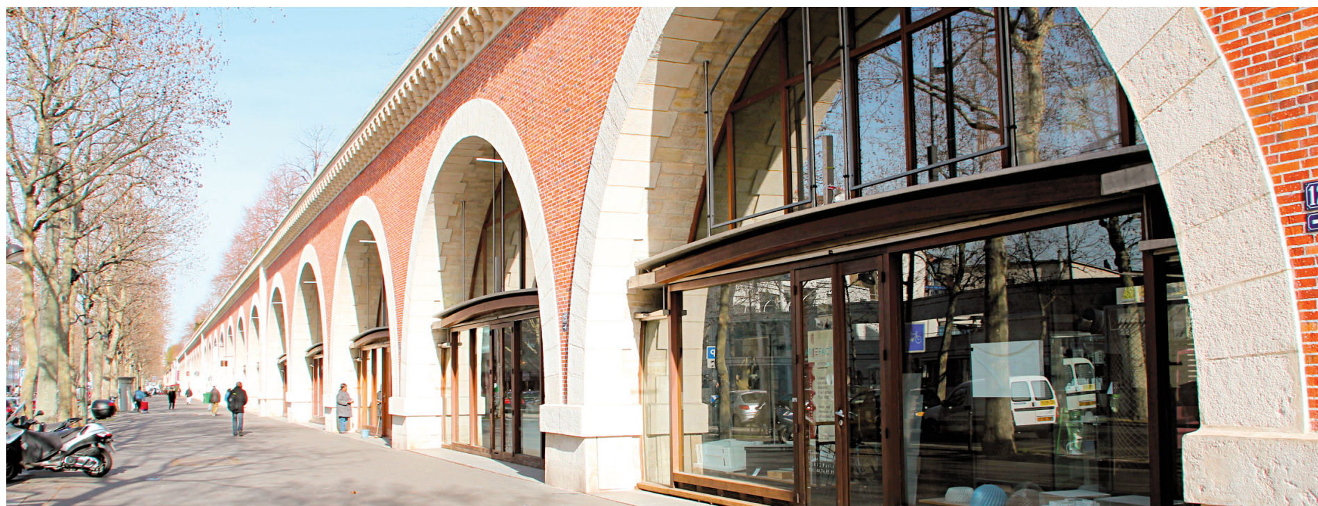
Sous la Promenade plantée à Paris, le Viaduc des arts.

Pendant 130 ans, la Ficelle a été le surnom d'un funiculaire, puis d'un train à crémaillère, qui grimpaient d'Ouchy, un quartier bordant le lac Léman, au Flon, un secteur du centre-ville de Lausanne. C'est désormais le nom de la promenade