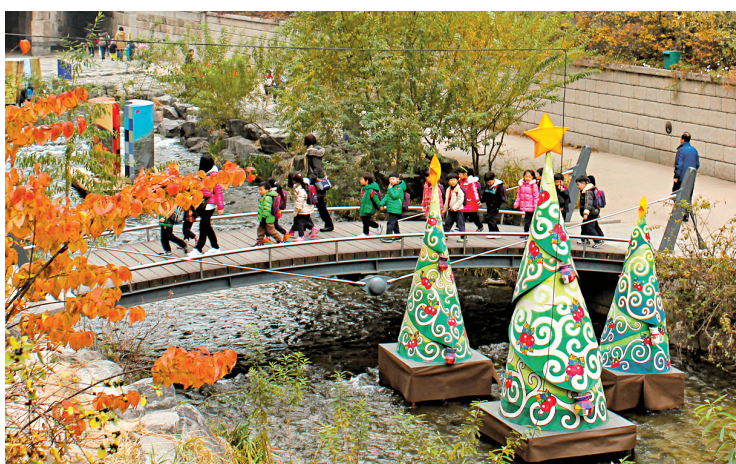
Une scène du Festival des lanternes à Séoul.

Dans la capitale sud-coréenne, la promenade Cheonggye n'est pas l'effet de la réhabilitation d'une voie ferrée mais plutôt de la démolition d'une autoroute surélevée et de la mise au jour d'un ruisseau. Résultat? Un superbe corridor piétonnier, long de 5,8 kilomètres, en plein centre-ville! (Et un cadre extraordinaire pour le Festival automnal des lanternes — notre photo ci-dessous.)