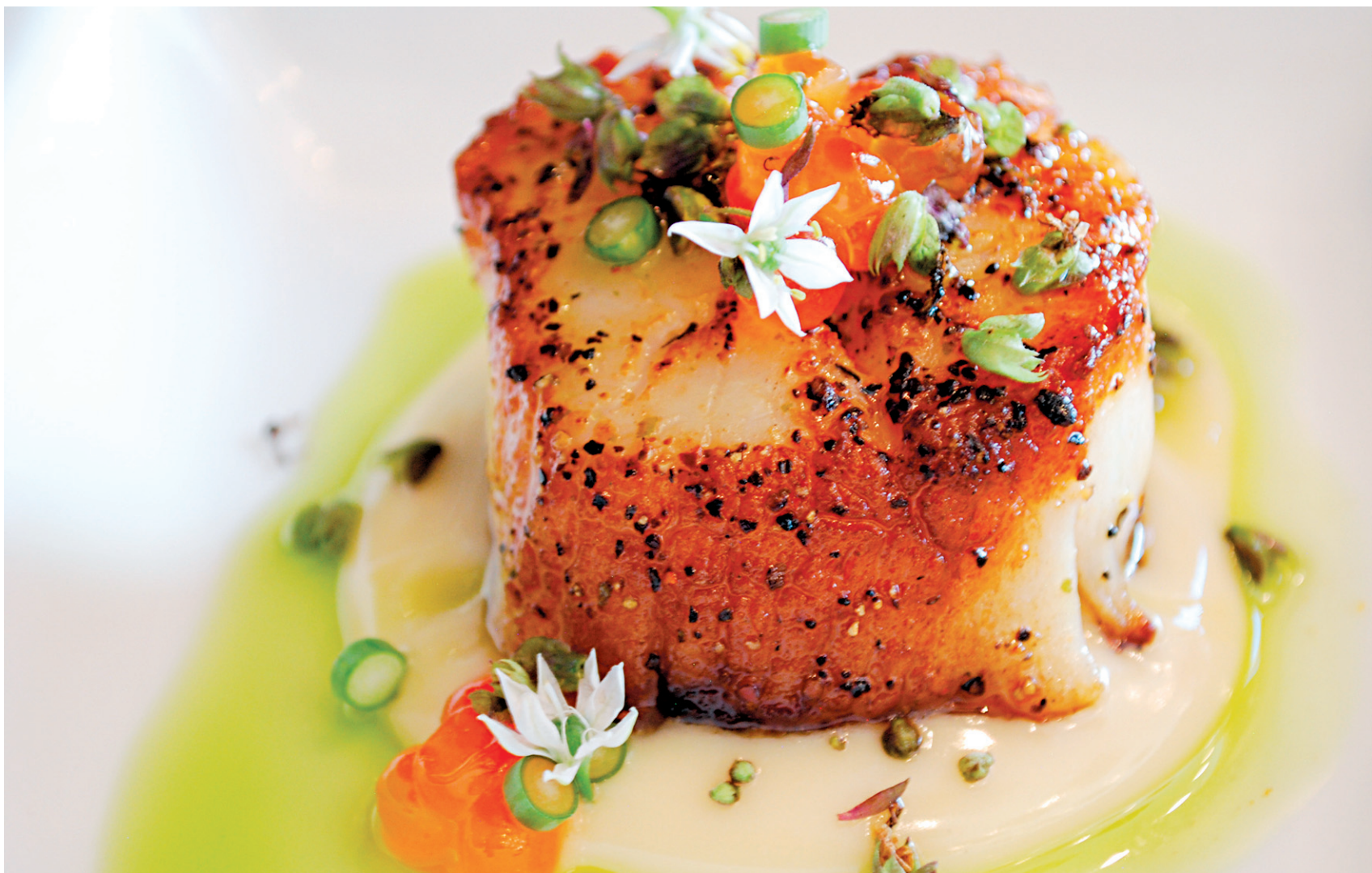
Une entrée de pétoncle parfumé au yuzu