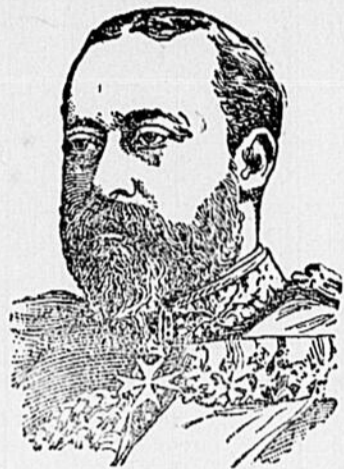
SA MAJESTÉ LE ROI EDOUARD VII

L'Exposition de Glasgow a produit un bénéfice net de $400,000; celle de Buffalo, un déficit de 3 millions.