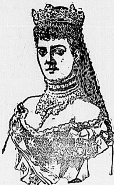
SA MAJESTÉ LA REINE ALEXANDRA

"Comme le château d'Osborne est consacré à la mémoire de la feu reine, c'est le désir du roi, qu'à l'exception des appartements qui ont été occupés personnellement par Sa Majesté, son peuple ait toujours accès dans cette résidence qui rappellera son nom bien-aimé.