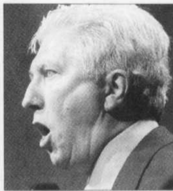
Gilles Duceppe

Gilles Duceppe a plutôt demandé à M. Harper de se joindre à lui pour réclamer une révision du format des débats télévisés qui auront lieu les 9 et 10 janvier. Selon le chef du Bloc, la formule actuelle