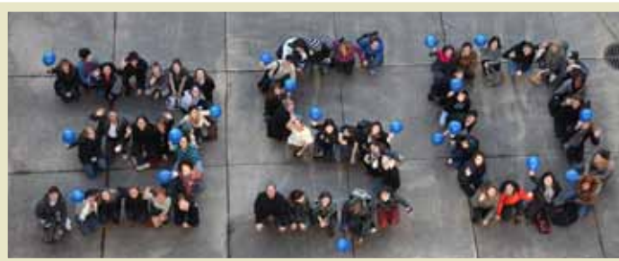
«350» formé par des membres de la communauté collégiale, en lien avec la campagne 350.org

En décembre dernier, la communauté collégiale tout entière s'est mobilisée pour la lutte aux changements climatiques. Le Collège de Rosemont a en effet participé au mouvement de mobilisation internationale pour le sommet de Copenhague en créant une «mobilisation éclair» (flash mob) durant laquelle plus de 50 étudiants et membres du personnel ont dansé