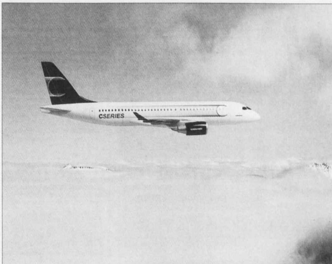
La Série C, projet de Bombardier « mis sur la glace » au début de l'année.

Le Québec sera en bonne compagnie à Farnborough, puisque toutes les provinces canadiennes y seront représentées. De plus, le ministre fédéral de l'Industrie