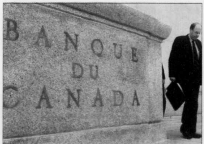
David Dodge, gouverneur de la Banque du Canada