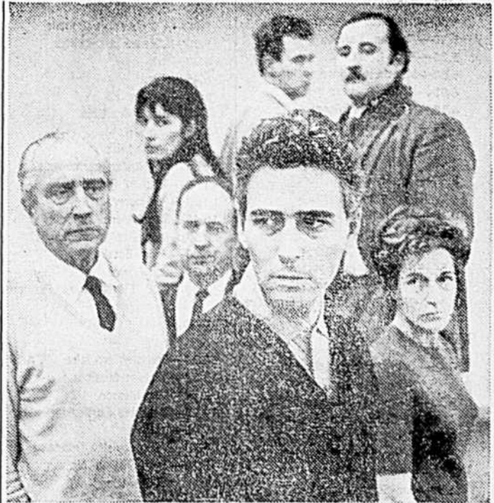
"Quelqu'un parmi vous" de Diego Fabbri

Ecrité expressément pour la télévision, la pièce de Diego