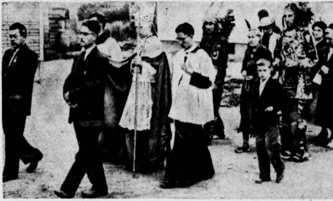
PRIERES POUR LA PLUIE QUI ONT EU DU SUCCES — Les feux de forêts qui font rage depuis le 7 du mois courant dans la région de Forestville, sur la rive nord du fleuve St-Laurent, ont poussé les habitants de la réserve indienne de Bersimis à entreprendre une procession de prières pour obtenir une pluie qui puisse aider à éteindre ces incendies et préserver ainsi les villages avoisinants.

Les enfants courent d'un bout à l'autre des corridors, les bébés pleurent, une demi-douzaine d'enfants font résonner la place de leur toux. Ils ont probablement attrapé le rhume le premier soir, alors que les lits n'étaient pas encore installés et que tout le monde dut dormir sur des matelas étendus sur le plancher.