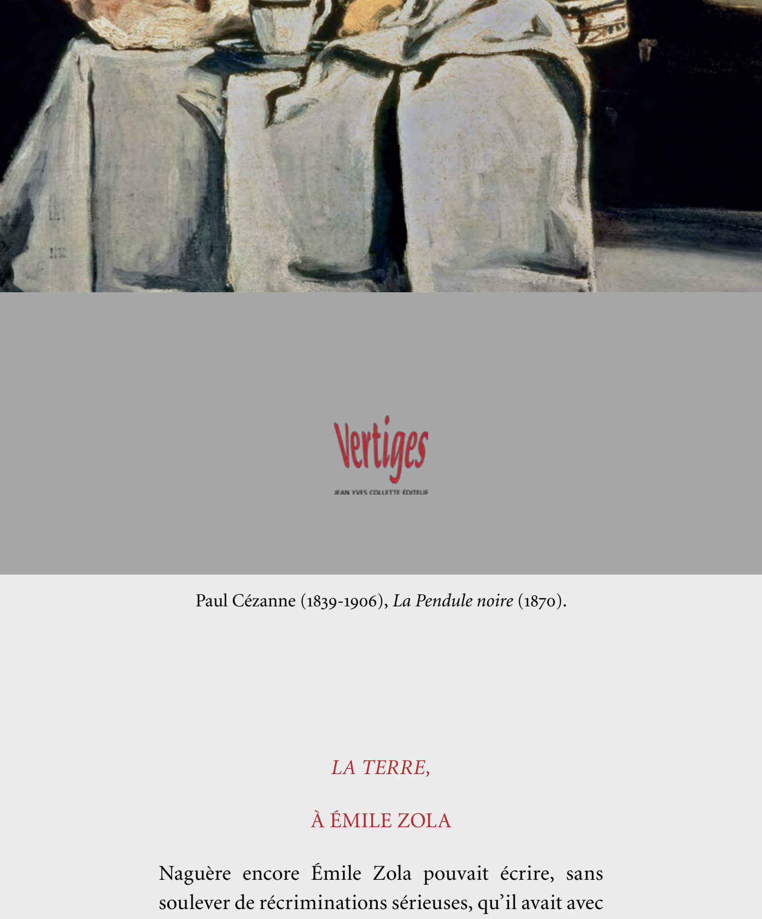
Paul Cézanne (1839-1906), La Pendule noire (1870).