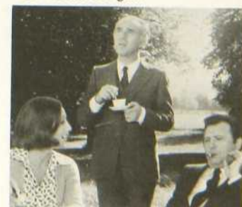
Les Noces Rouges

Pour les amateurs de Chabrol, signalons qu'un autre de ses films, La Rupture avec Stéphane Audran, Michel Bouquet et Jean-Pierre Cassel sera à l'affiche de Ciné-nuit le samedi 3 janvier.