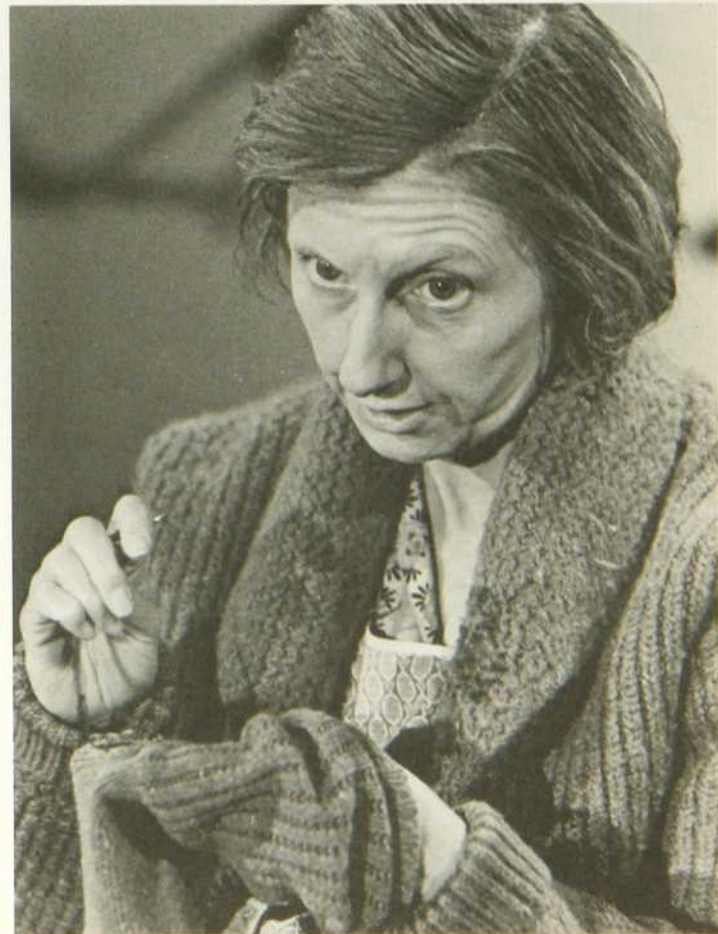
Viola Léger dans «La Sagouine»