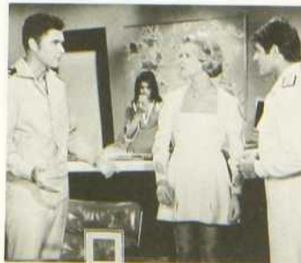
La Citadelle sous la mer

La Citadelle sous la mer est une autre réalisation de science-fiction de Irwin Allen. Il est un spécialiste des grands spectacles de nature, des aventures sensationnelles en terres lointaines et des super-productions à distribution de choc. Ici, les trucages sont assez soignés et la technique est fort à point. Les comédiens dont la réputation n'est plus à faire, réussissent à se tirer d'affaire au milieu d'un tel étalage technique. Peut-être un peu moins original que les romans d'Huxley et d'Orwell, La Citadelle sous la mer demeure un drame de science-fiction réalisé avec maîtrise. Il se situe dans la lignée du Monde Perdu , d'après le roman de Conan Doyle et de Cinq semaines en ballon , d'après Jules Verne, deux autres films de Allen.