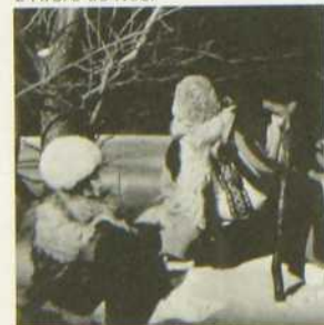
L'Arbre de Noël