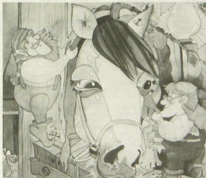
La Grange aux lutins