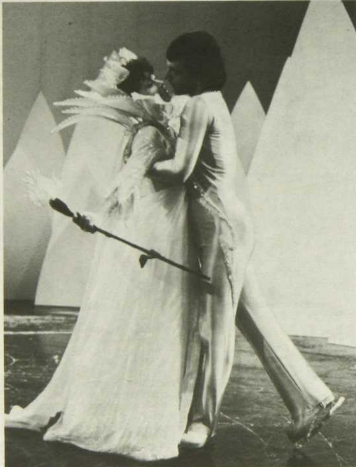
Wendy Burge et Toller Cranston