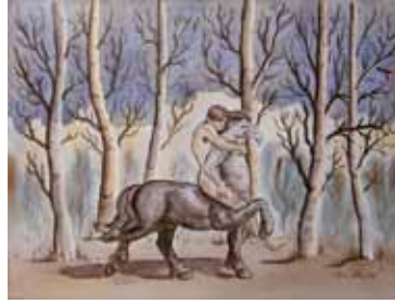
Nuits magiques - Alain Jetté

L'équipe d'Altern'Art est à la recherche d'artistes pour l'édition 2011. Côté arts visuels, un appel d'œuvres a été lancé pour l'exposition collective extérieure Corrid'Art, qui sera présentée du 10 au 29 mai. Vous exercez la peinture, la photographie, le dessin ou le graphisme? Soumettez vos œuvres avant le 13 mars 2011. Côté littérature, place à la troisième édition du Concours de création littéraire Altern'Art. Les amant(e)s de la plume sont invités à soumettre un texte inédit en français dans deux catégories : fiction narrative (500 à 750 mots) et suite poétique (200 à 350 mots). Les écrits gagnants seront lus et leurs auteurs récompensés avec des bourses