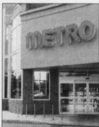
Metro a complété la rénovation ou l'agrandissement de 46 magasins.

La direction de Metro affirme ne pas craindre l'ouverture des Super centres Wal-Mart en Onta-