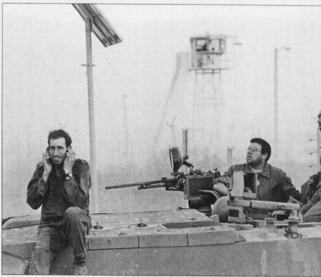
Des soldats israéliens attendaient hier près d'un poste d'observation de la FINUL, à Kiriati.

Parmi les points qu'Israël souhaitait voir inscrits dans le texte figurent «l'éloignement du Hezbollah du sud du Liban au-delà du Litani, la libération des deux soldats israéliens enlevés le 12 juillet, le déploiement d'une force internationale disposant de véritables pouvoirs au Liban sud ainsi que le long de la frontière libano-syrienne afin d'empêcher le trafic