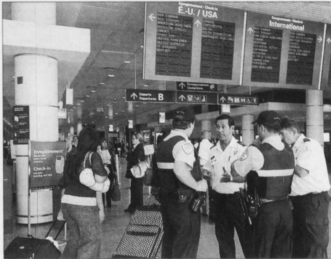
La sécurité avait été considérablement renforcée, hier, à l'aéroport Montréal-Trudeau.

Transports Canada a demandé aux aéroports de restreindre la vente de boissons, de gels, de crèmes et de parfums dans les zones situées au-delà des points de fouille. Seuls les produits pouvant être consommés avant de monter dans