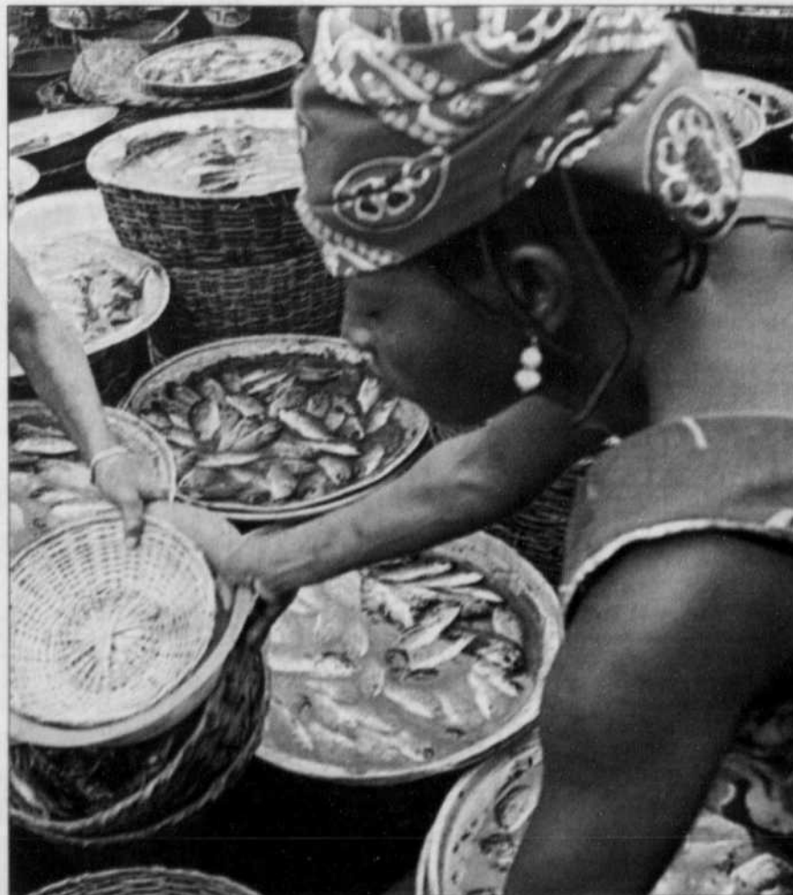
Le marché Dantokpa, au Bénin, est l'un des plus importants en Afrique.

Mais Cotonou est bien autre chose que cela. C'est aussi une ville de fleurs odoriférantes et de petits marchés colorés. C'est ici que les Chinois ont construit un Palais des congrès ultra-moderne qui fait la fierté des Béninois. Dans ses rues règne la pétulante anarchie de l'Afrique et vrombit une nuée de motocyclettes légères, dont les conducteurs, vêtus d'un jaune éclatant, font office de taxis. Et vous emmènent, par