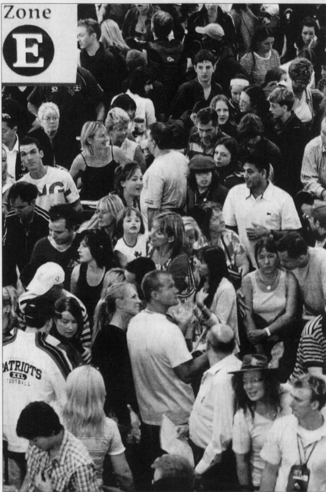
Le renforcement des mesures de surveillance a immédiatement entraîné des files d'attente et des cohues monstres dans tous les aéroports de Grande-Bretagne et surtout à Londres-Heathrow, où 200 000 passagers ont été touchés par des annulations et retards.