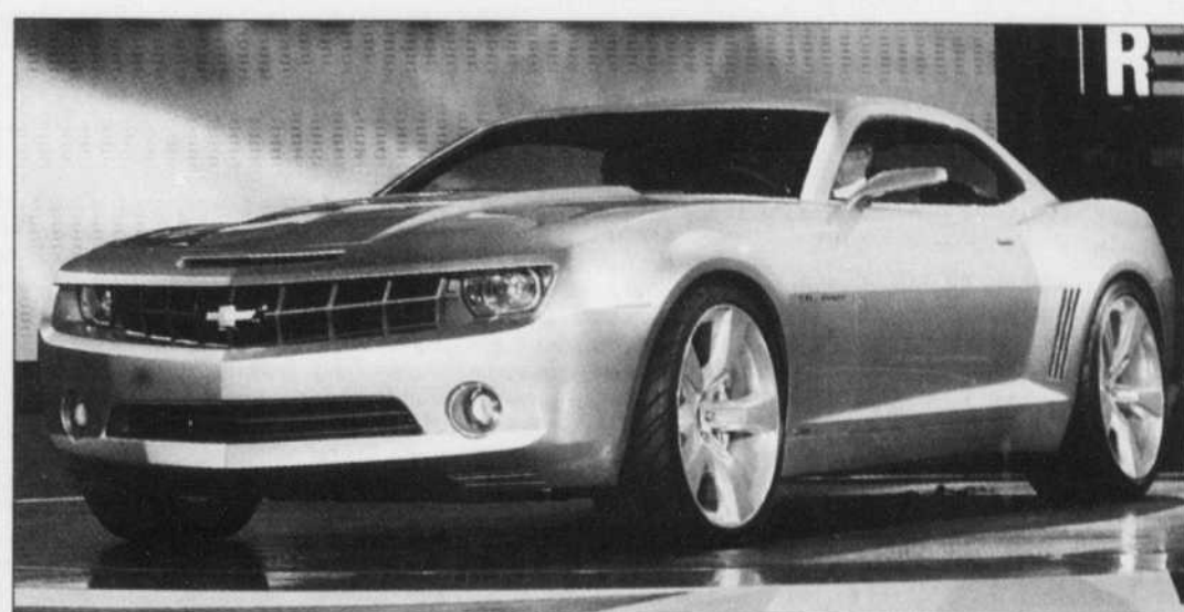
La Camaro 2009 ressemblera à cette voiture-concept qui avait été montrée au Salon international de l'automobile de Detroit, en janvier dernier.