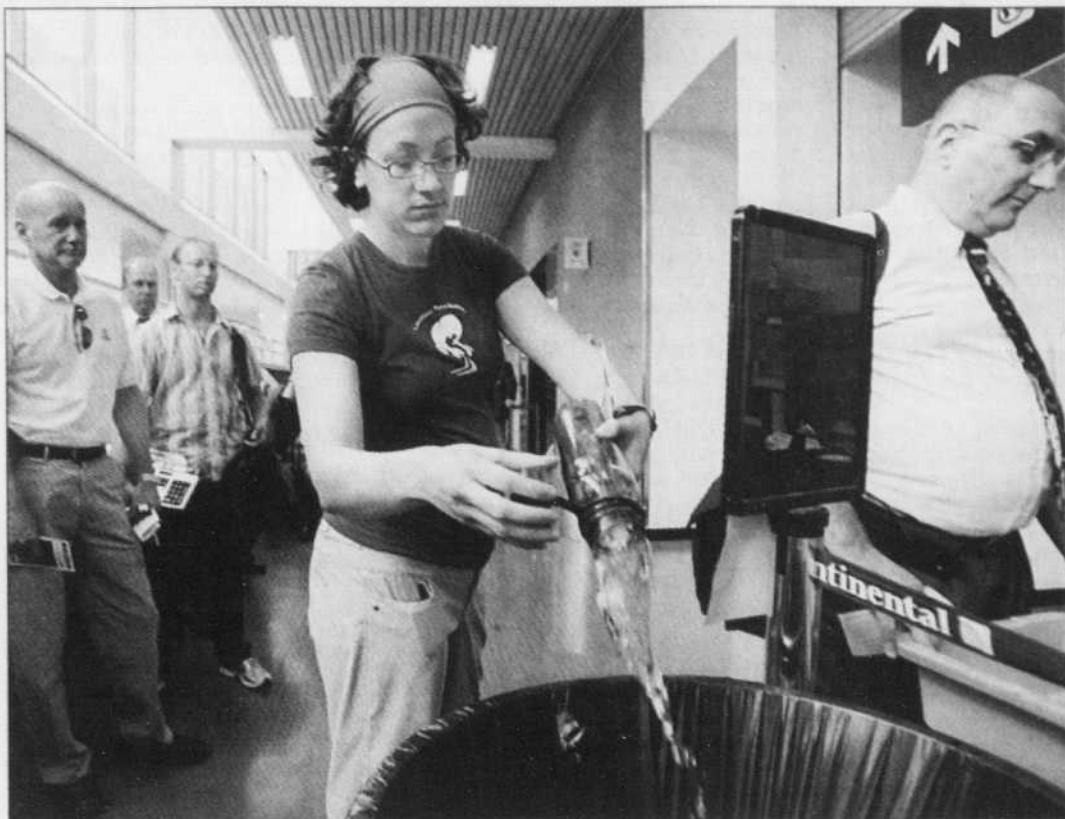
Une passagère est obligée de vider sa bouteille d'eau avant de franchir un point de contrôle de sécurité, hier, à l'aéroport international Logan de Boston.

On peut le constater: les statistiques sont faussées dès lors que terrorisme national et international sont confondus. De même, la différence entre les chiffres de 2003 et 2004 s'explique par les attentats qui se sont produits en Irak: tout près de 200 en 2004, soit le tiers du total de l'année et neuf fois plus qu'en 2003. Voilà