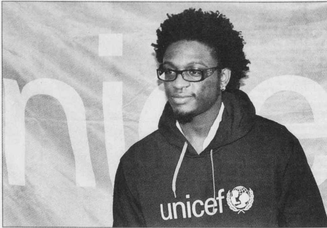
Corneille a passé cinq jours au Malawi en juin en tant qu'ambassadeur de l'UNICEF pour le Canada.

Dans ce pays au faible taux d'alphabétisation, où les épidémies se succèdent et la population souffre de malnutrition, la question du