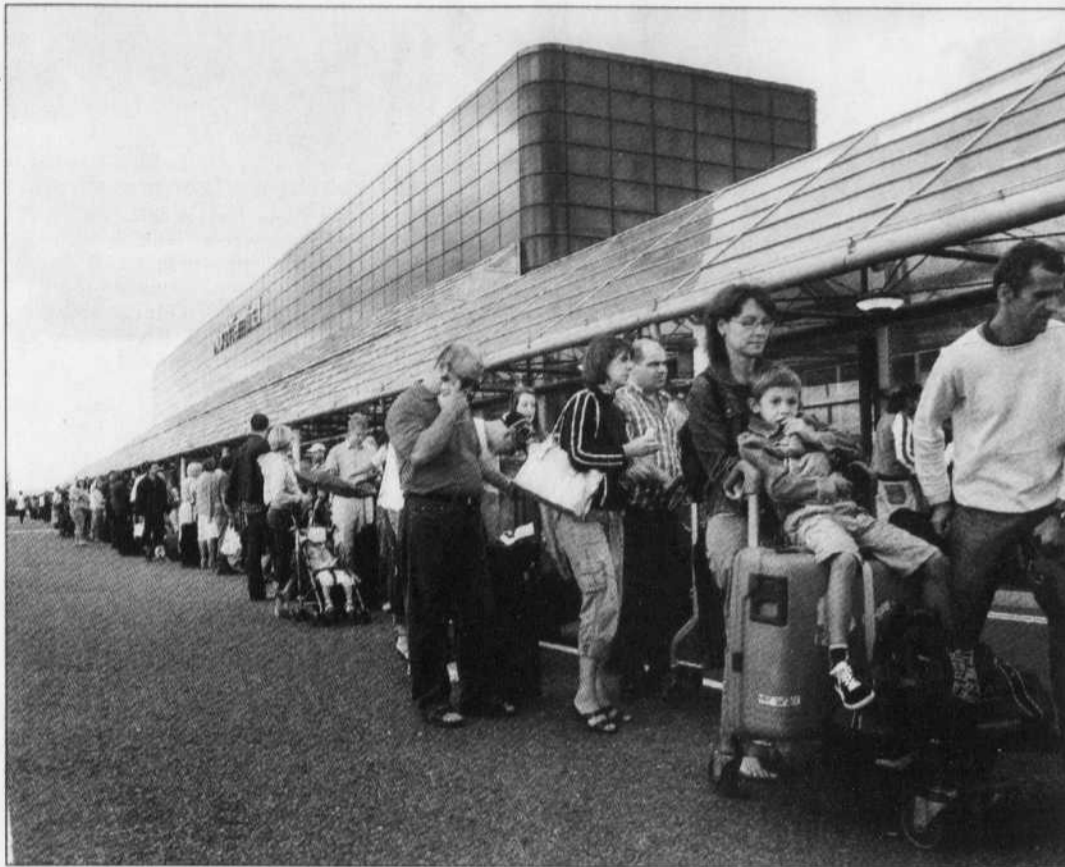
Les passagers étaient obligés hier de faire la queue jusqu'à l'extérieur dans certains aéroports européens, comme ici à Gatwick, en Grande-Bretagne.