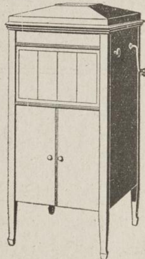
Ce Nouveau Columbia $125

Phonographes Columbia, prix $25 à $270 Conditions de paiement faciles