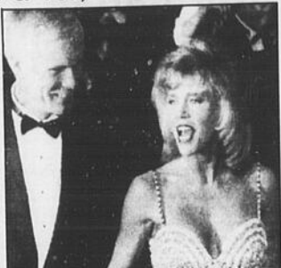
Jane Fonda e Ted Turner si sono sposati nei ranch di lui a Capps (Talaahassee) in Florida.

Ted Turner, 53 anni, per divorziare tre anni dalla seconda moglie aveva sborsato 40 milioni di dollari.