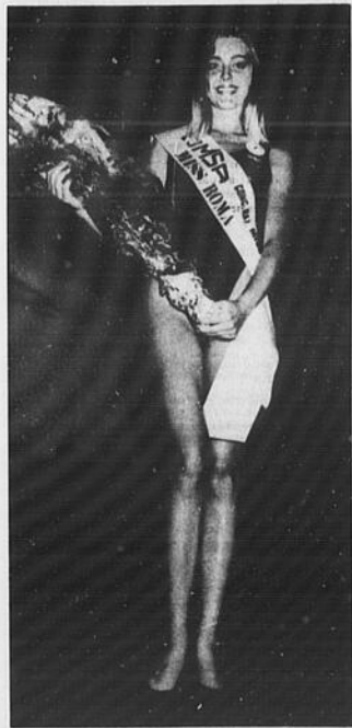
Fra i concorsi di bellezza e cultura c'è un legame? Se c'è, non è di certo orvieto, ed è forse una delle ragioni principali per cui sono in decadenza: quello del Canada è stato il primo a cadere, ma non sarà l'ultimo...

PER ABBONARVI A IL CITTADINO CANADESE CHIAMATE AL: 253-2332