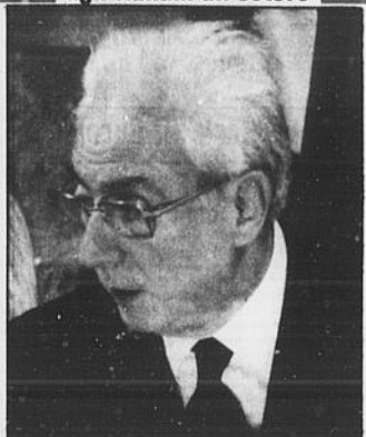
Francesco Cossiga, presidente della Repubblica italiana.

Mi riferisco in particolare alle elezioni dei comitati degli italiani all'estero, svoltesi nel maggio 1991. A questa consultazione, la seconda dopo quella del 1986, hanno preso parte circa 700 mila nostri connazionali, residenti in 22