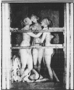
Undici sculture in marmo di Antonio Canova, il celebre scultore italiano del '700, sono uscite per la prima volta dal Museo dell'Ermitage a San Pietroburgo e sono in mostra a Roma a Palazzo Ruspoli. Insieme con loro sono esposte terracotte della collezione veneziana Farsetti e busti, modelli e studi dei più celebri artisti barocchi.

La mostra, aperta il 12 dicembre in uno dei più celebrati palazzi romani, resterà visibile fino a febbraio. Nella foto Ansa: "Le Grazie" di Antonio Canova