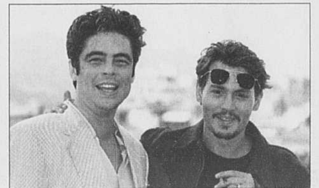
Les acteurs Benicio del Toro et Johnny Depp, vedettes de Fear And Loathing In Las Vegas , un film froidement accueilli par la critique à Cannes.