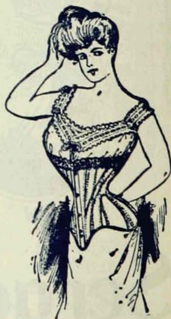
MODELES LES PLUS NOUVEAUX.

Les Dames qui insistent pour avoir les Crompton ne le regrettent jamais.