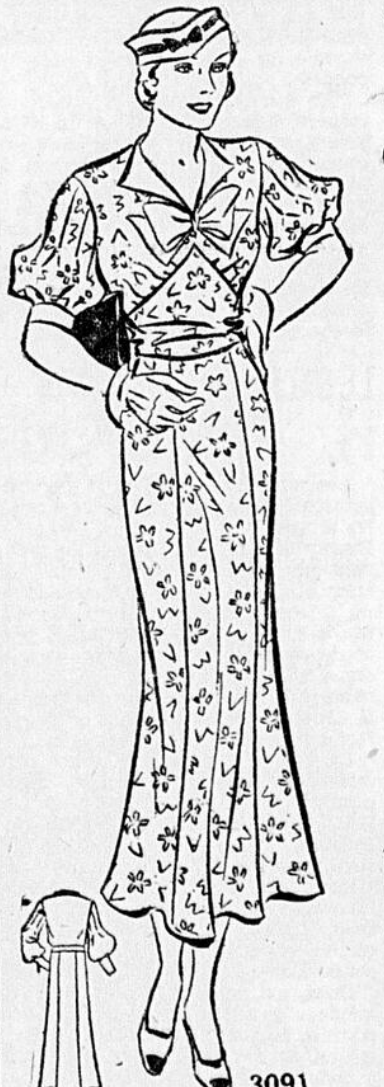
Des instructions illustrées accompagnent chaque patron

Si vous désirez quelque chose de très chic, en fait de robes, pour rafraîchir votre garde-robe, vous ne pourriez mieux faire qu'en adoptant ce modèle. Il pourrait être copié en voile chiffon de coton bleu et blanc, ou en soie lavable blanche, crêpe satin noir, etc. Le patron est fourni en grandeur 16, 18, 20, 22, 24, 26, 28, 30, 32, 34, 36, 38, 40 et 42 pouces de buste. Le prix de ce patron est 15c. Il sera expédié dans un intervalle de 8 jours. Adressez votre commande à: Département des Patrons, L'EVENEMENT, 30 de la Fabrique, s'adresser clairement vos noms et adresse sur les lignes pointillées ci-dessous. Envoyez 15c de plus pour une belle feuille de patrons de broderie s'imprimant au fer chaud et comprenant plus de 60 modèles.