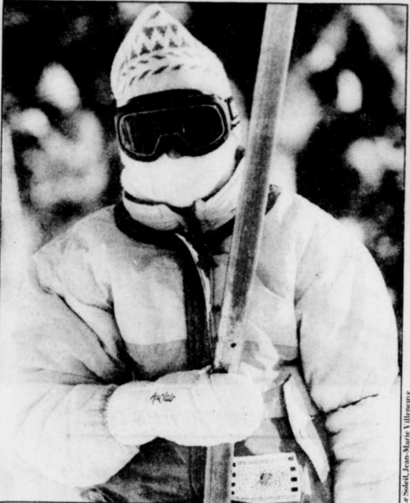
Nul n'a besoin de plus de calories pour faire face au froid. Il suffit de manger normalement et de façon équilibrée. Et, aussi, de bien se vêtir de sorte de garder la chaleur du corps, de marcher, de bouger un peu ou de s'activer.

Mais, précise Mme Grenon, ceux et celles dont le régime alimentaire habituel est équilibré et varié, qui consomment, ce faisant, du fer et de la vitamine C en quantités suffisantes, auraient plus de chances de ne pas contracter ces maladies.