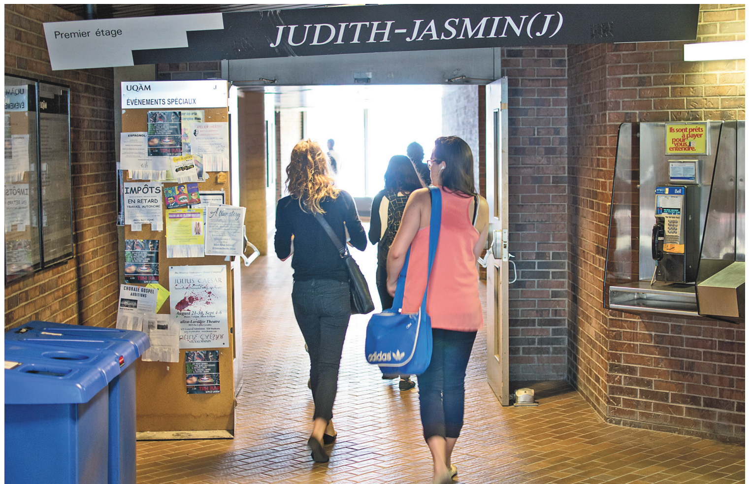
MICKAËL MONNIER LE DEVOIR

Depuis une vingtaine d'années, il s'est développé ce qu'on appelle les études post-coloniales : « On a commencé à regarder les effets Nord-Sud sur la vie des femmes, pour