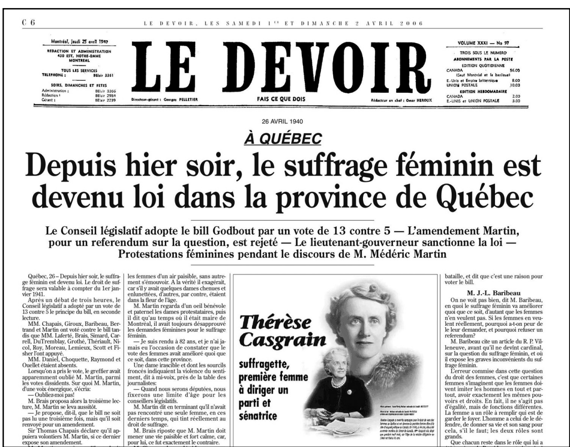
La Une du journal Le Devoir du 26 avril 1940