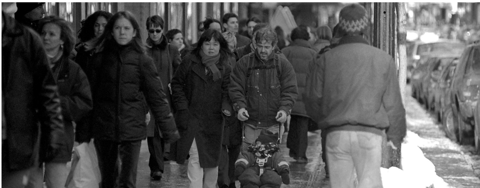
ÉRIC SAINT-PIERRE LE DEVOIR

«Ça, c'est assez fascinant à observer», déclare-t-elle avec enthousiasme. Ainsi, les sociétés qui octroient des services à l'ensemble de leur population développent par le fait même des emplois de qualité, contrairement à