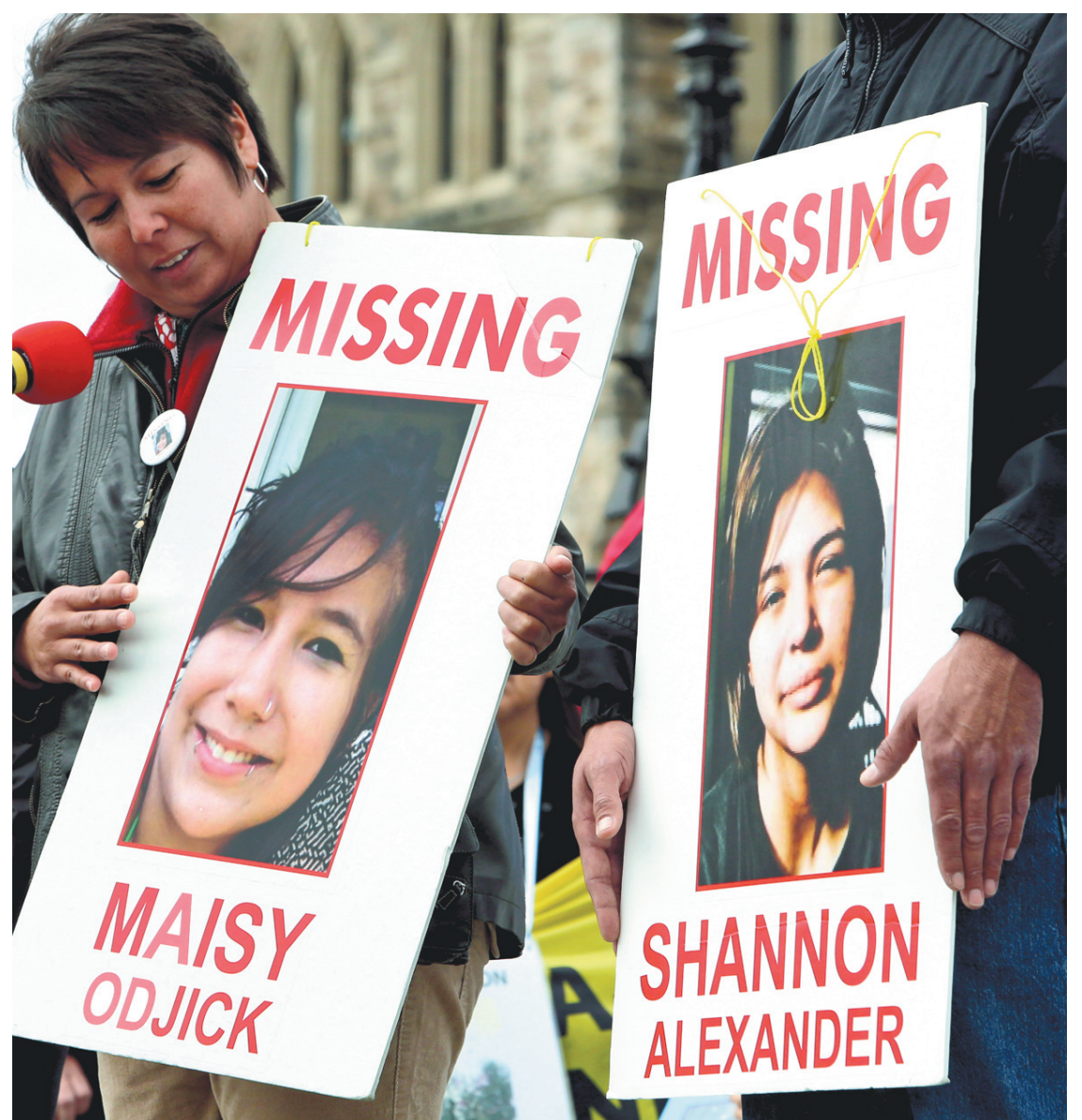
FRED CHARTRAND LA PRESSE CANADIENNE

« Toutefois, le contexte est différent, affirme M me Pagé. La violence par exemple ne se vit pas exactement de la même manière et les solutions ne sont pas toujours les mêmes. Parfois, c'est plus difficile à accepter pour les féministes. Par exemple, avec la violence conjugale dans les communautés autochtones, quitter le domicile n'est pas évident avec la crise du logement. Souvent, cela mènerait les femmes à quitter leur communauté, ce qui n'est pas une option pour plusieurs d'entre