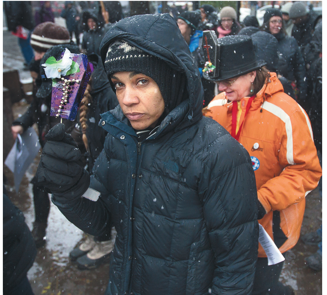
ANNIK MH DE CARUFEL LE DEVOIR

«Les coupes effectuées dans le secteur public ont bien d'autres effets négatifs plus difficiles à mesurer sur les femmes», écrivent les chercheurs de l'IRIS. Ils citent notamment la difficulté à retrouver un emploi bien rémunéré et assorti de bonnes conditions.