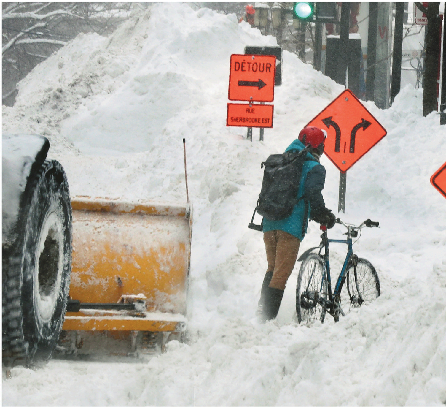
Le déneigement après la tempête de la semaine dernière a été facilité par la fermeture des commissions scolaires, qui a permis de réduire le nombre de personnes dans les rues de Montréal.

pistes cyclables et les trottoirs sont déneigés en fonction d'un ordre de priorité (1 à 3) établi dans la Politique de déneigement adoptée par la métropole en 2015. Les larges artères, comme Sherbrooke, Pie-IX et Saint-Denis par exemple, sont donc parmi les premières à être déblayées, notamment parce qu'elles permettent ensuite aux véhicules de circuler plus facilement d'un point à l'autre. Les circuits d'autobus prioritaires, les voies réservées et les entrées des hôpitaux