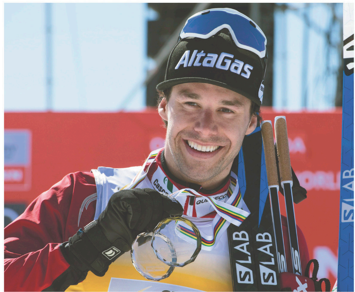
JACQUES BOISSINOT LA PRESSE CANADIENNE

«C'est la saison de sa vie, a-t-il dit sans détour. Ça laisse peut-être présager de beaux Jeux pour Alex, mais une chose est certaine, ses résultats cette saison lui serviront de source de motivation pour l'an prochain.» D'ici là, cependant,