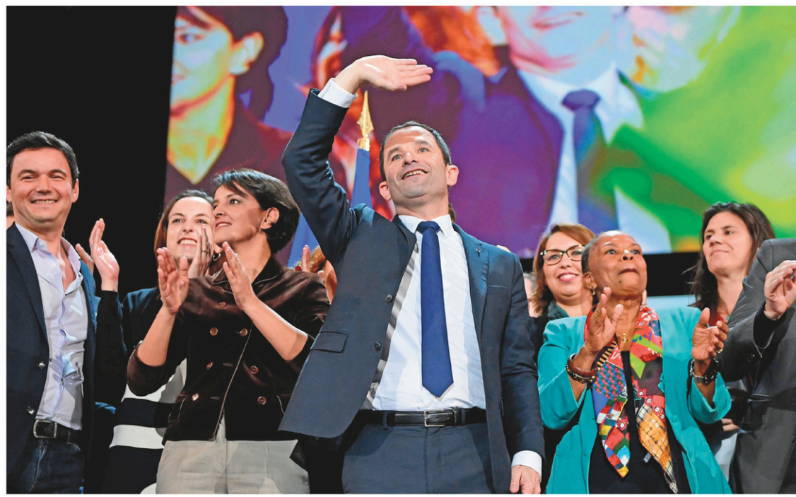
Benoît Hamon a essayé de donner un nouvel élan à sa campagne lors d'un meeting à Paris, dimanche.