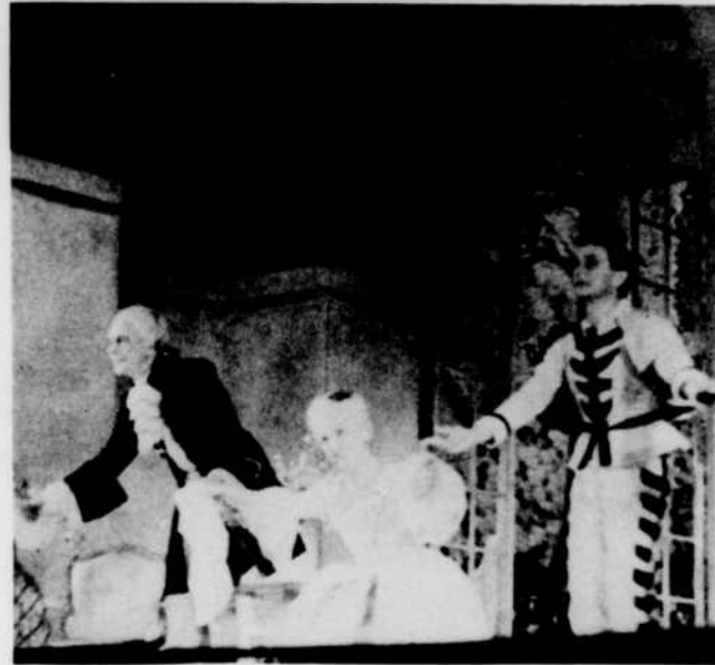
MADELEINE RENAUD et J.-LOUIS BARRAULT

du théâtre au début ne laisse pas croire qu'on est en train de s'échauffer et tout d'un coup, comme lorsque le blanc d'un oeuf se met à prendre, une immense