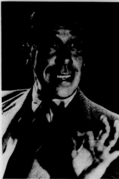
Fernandel (ci-dessus) et Claude Dauphin seront entendus les mardi et vendredi, 4 et 7 janvier de 8 h. à 8 h. 30 du soir, au cours de deux émissions hors-série sur disques. Au premier programme, on entendra l'Histoire du petit tailleur, d'après un conte de Grimm, telle que racontée par Claude Dauphin. De son côté, Fernandel incarnera le truculent personnage d'Honoré de Marseille, à la seconde émission.