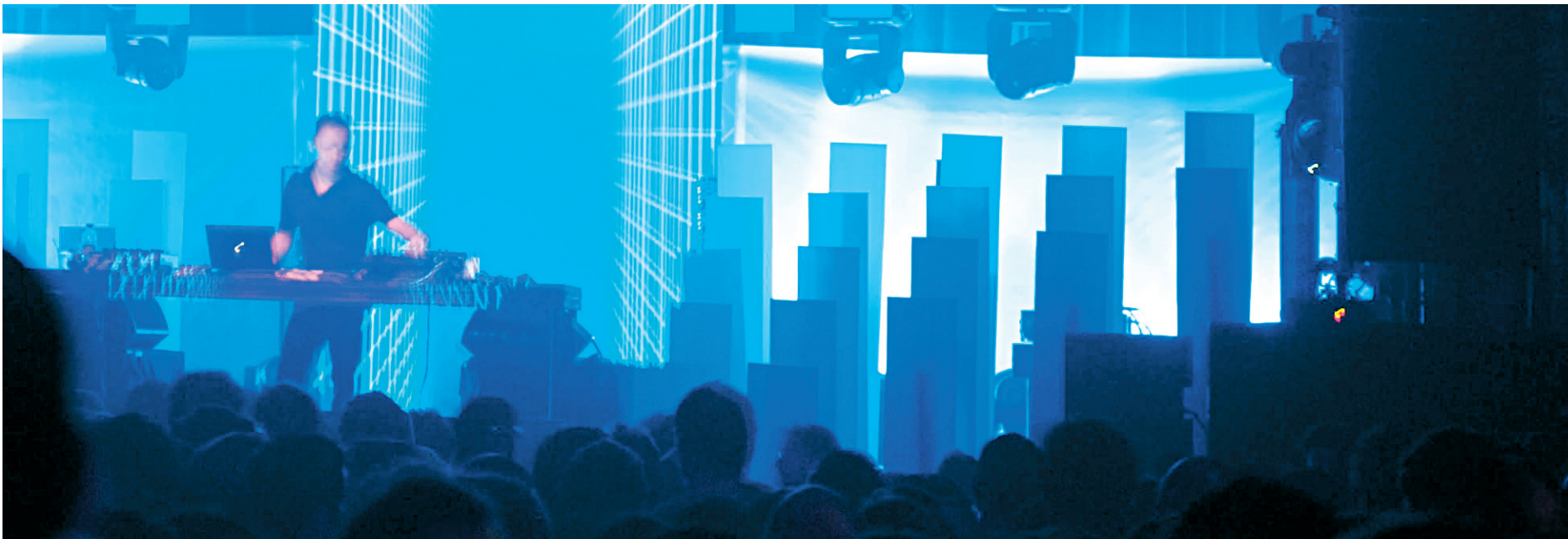
MUTEK, Tobias, 2009