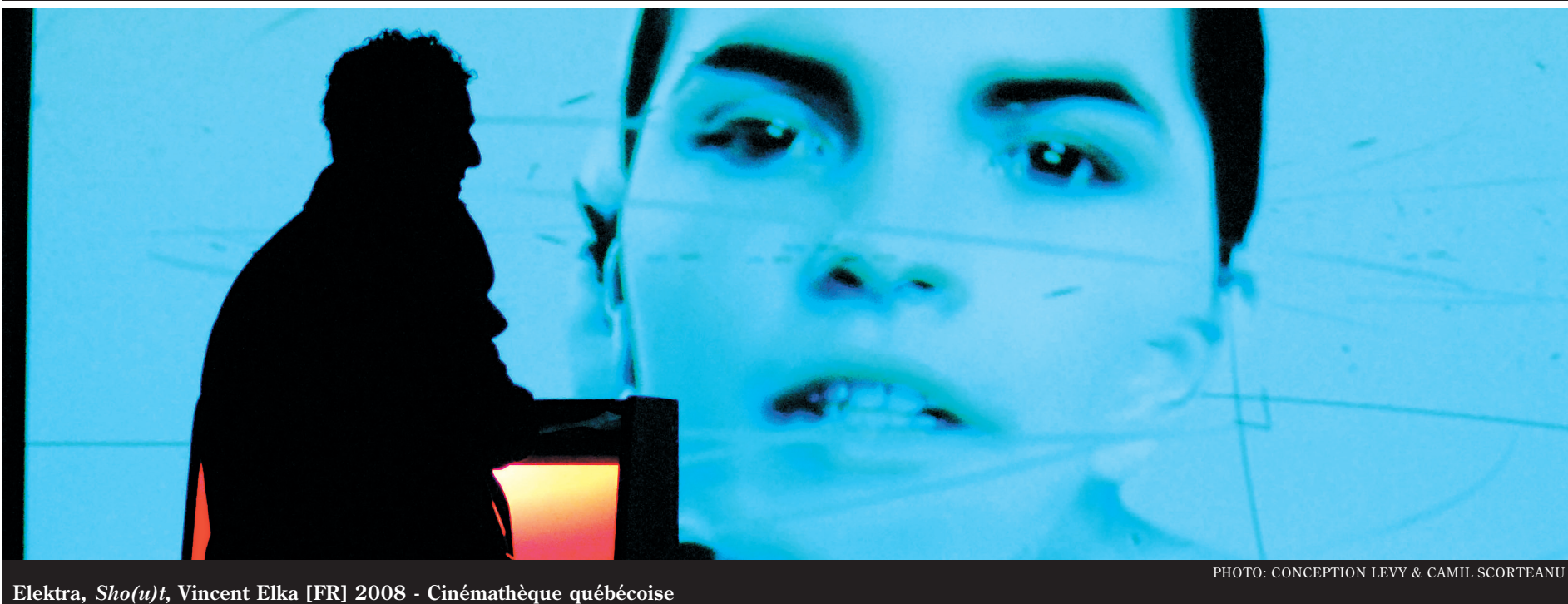
Elektra, Sho(u)t, Vincent Elka [FR] 2008 - Cinémathèque québécoise