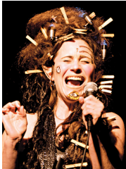
Le Cabaret Dada des Filles électriques