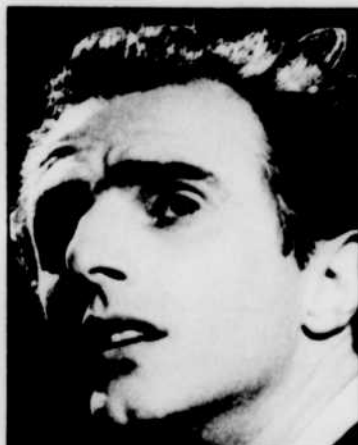
Gilles VIGNEAULT continue son entretien à «Au bout de mon âge», à 17 h 00.