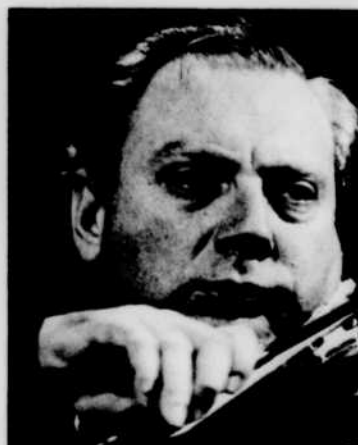
Isaac STERN sera le soliste, et Charles MUNCH dirigera l'Orchestre symphonique de Montréal, à «Concert symphonique», MARDI à 20 h 30.