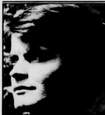
Jean-Claude DROUOT est la vedette de «Thierry la Fronde», à 17 h 00.