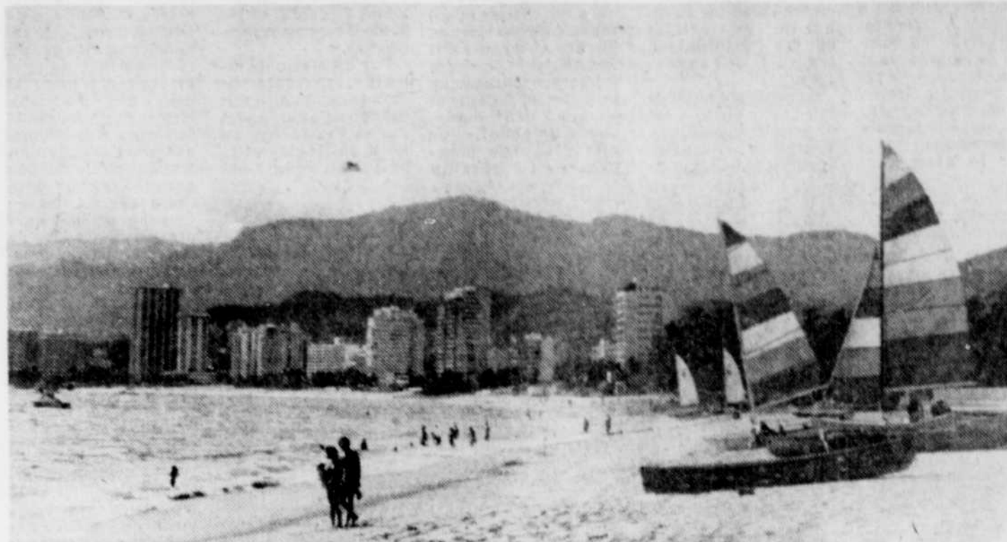
Acapulco, un futur plein d'espoir.