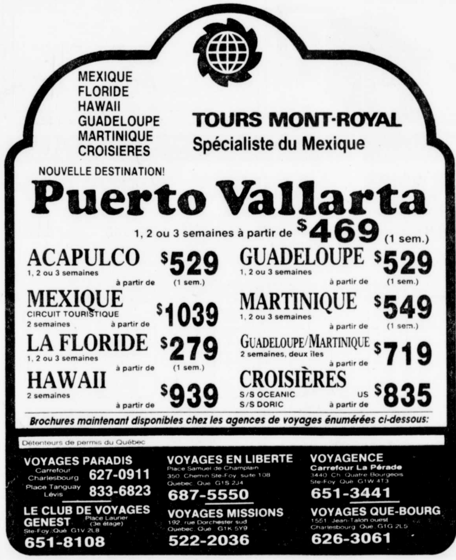
Le Soleil, Louis Tanguay