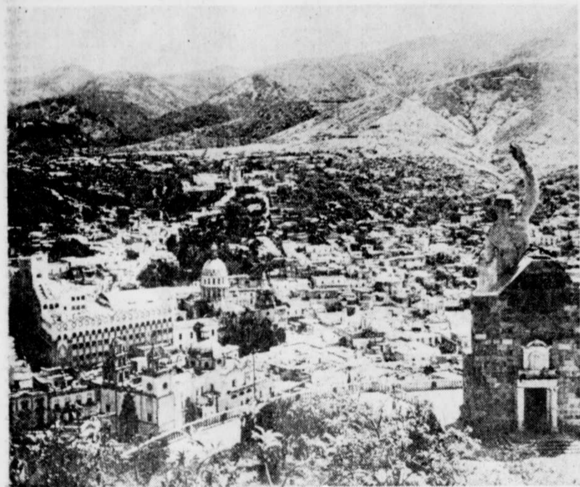
Guanajuato malgré son air tranquille fut le théâtre de combats féroces lors de la Guerre d'Indépendance de 1810.