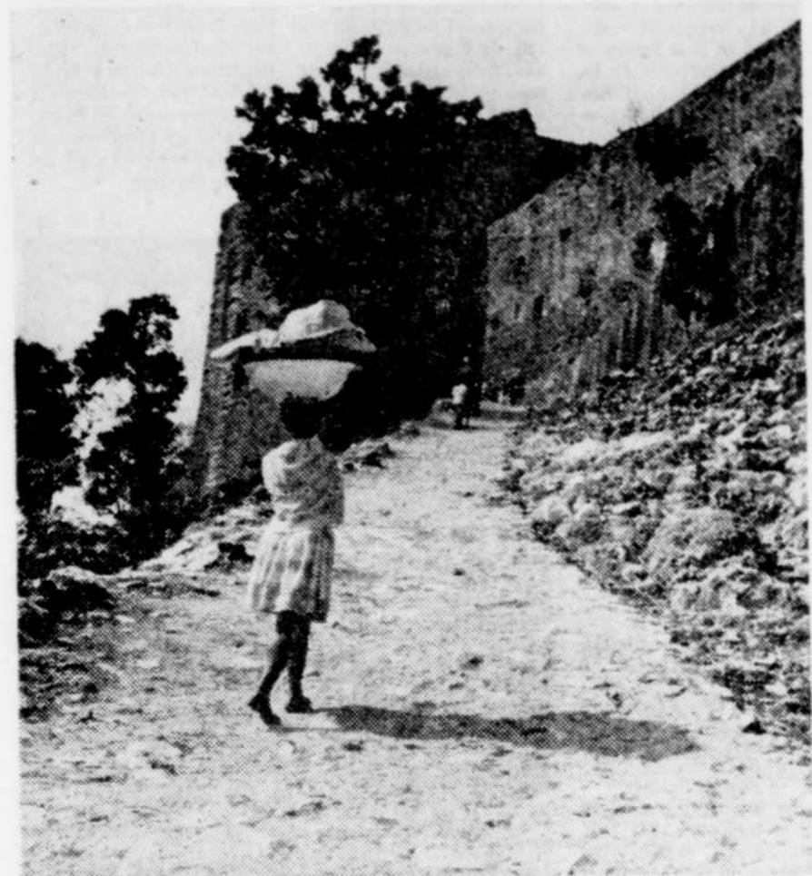
En route vers la Citadelle Laferrière.

d'Etat la résidence du prince haïtien, l'hôpital, les casernes, les écuries... Ici encore les ouvrages hydrauliques étaient remarquables. Dans le cadre du plan d'aménagement des jardins, l'un des travaux de restauration qui s'imposent est le nettoyage du système complexe de canalisations et de pièces d'eau. Dominant la Citadelle, et comme dernière défense contre l'invasisseur, se trouve le site des Ramiers, qui fut en partie redécouvert lors des travaux de fouilles de 1973. Il comporte un groupe d'habitations et quatre redoutes auxquelles on ne pouvait accéder qu'à l'aide d'un pont-levis. Le tremblement de terre qui a dévasté le nord d'Haïti en 1842 a causé de graves dommages à la Citadelle et a détruit en grande partie Sans-Souci. A ces dommages sont venus s'ajouter ceux des intempéries qu'a aggravé l'abandon des édifices pendant plus d'un siècle. Une partie des toits étant écroulée, l'eau des torrentielles pluies tropicales s'est infiltrée dans les murs, dégradant le mortier, si bien que la végétation envahit les édifices. En 1973, le gouvernement d'Haïti a entrepris un programme de protection d'urgence, visant à consolider les vestiges et à les utiliser en tant que centres d'animation culturelle.