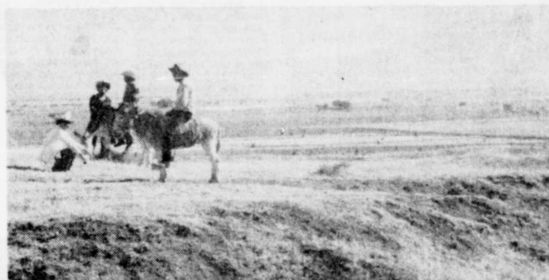
Dans la campagne mexicaine.