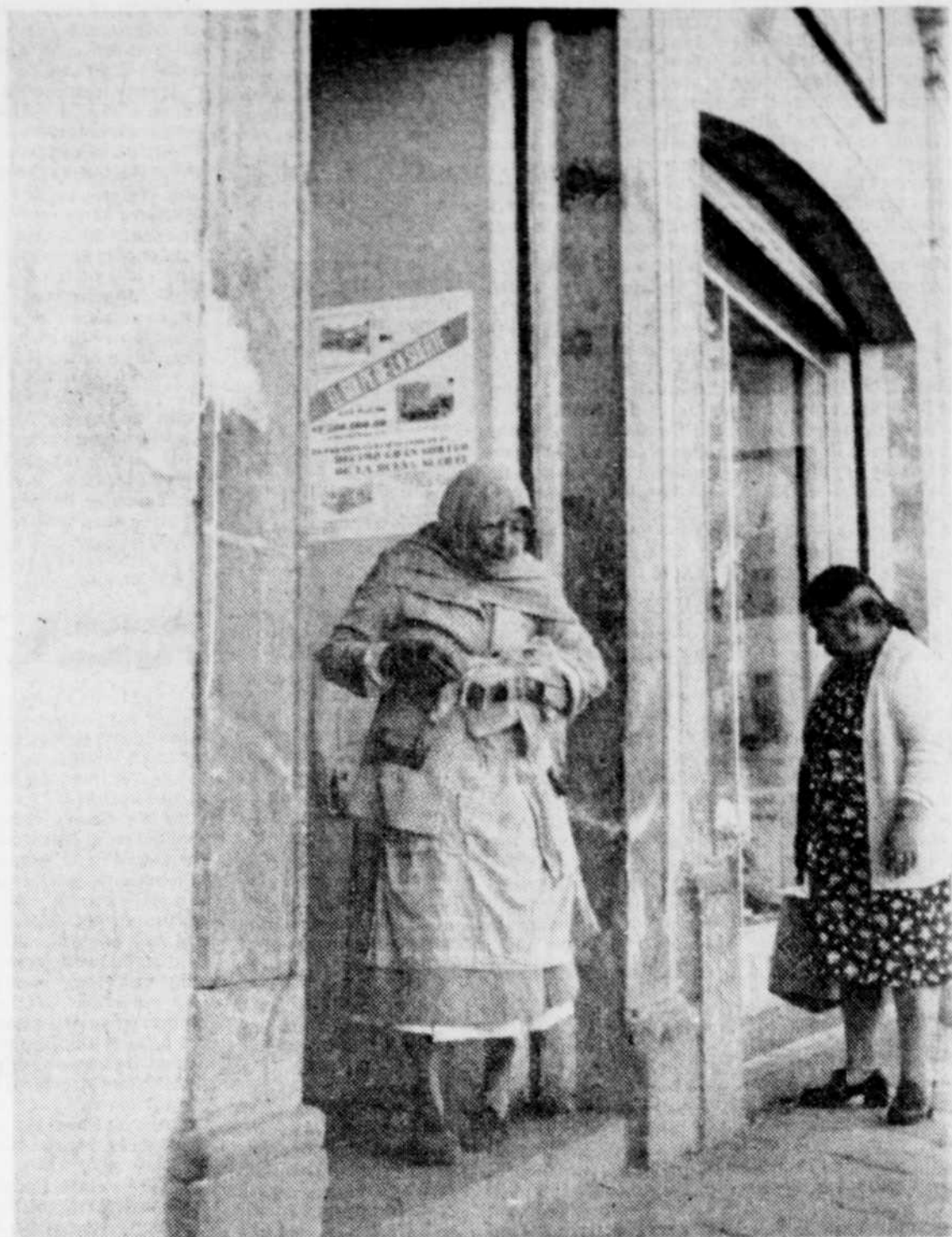
Un passé présent.