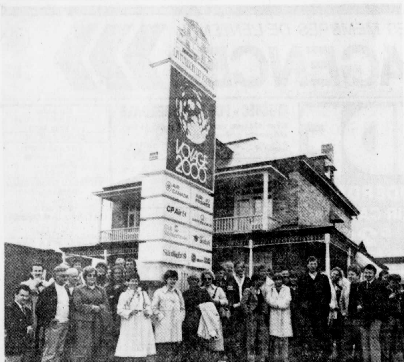
Dernièrement, une trentaine de Directeurs d'Agences de Voyages européennes en réunion à Montréal ont fait un rapide aller et retour à Québec pour visiter notre ville et, en particulier, La Maison du Voyage. Leur courte visite leur a permis de constater à quel point la clientèle de VOYAGE 2000 est choyée grâce à l'organisation et aux services exceptionnels que cette Agence met à la disposition de tous les voyageurs de la région. Nul doute que cette rencontre favorisera encore plus l'échange de services communs entre nos visiteurs européens et toute l'équipe de La Maison du Voyage.