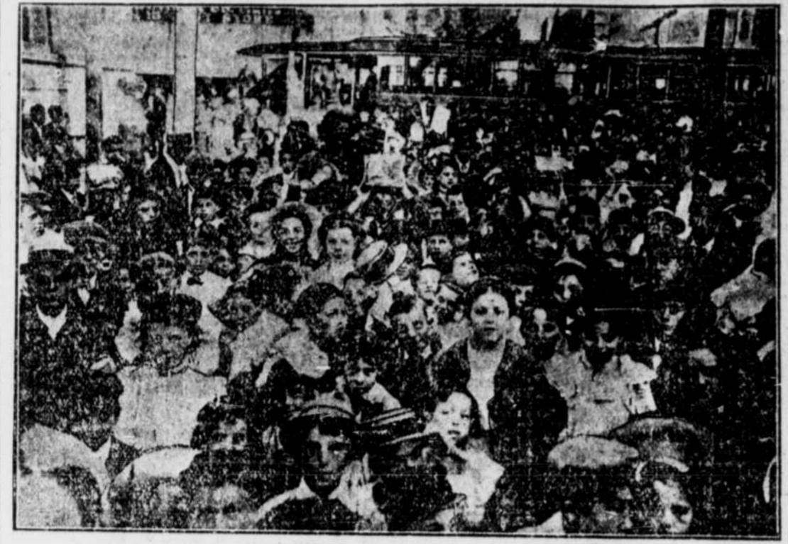
Un groupe des petits pique-niqueurs attendant l'arrivée des tramways spéciaux qui les conduiront au Bout de l'île pour la troisième fête champêtre de la "Presse".