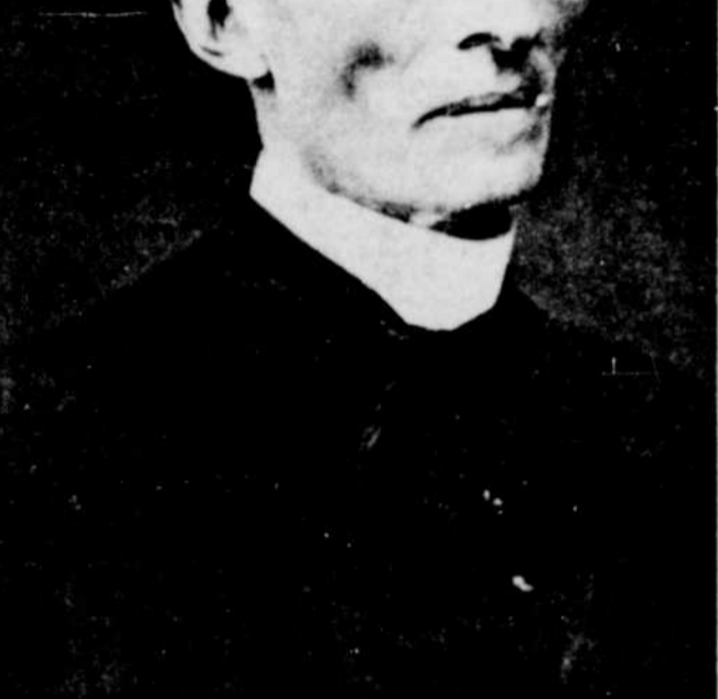
SAINT PIERRE-JULIEN EYMARD, apôtre de la dévotion à l'Eucharistie est fondateur de la Congrégation des Pères du T.S. Sacrement, qui ont un monastère à Shawinigan, en plus de diriger la paroisse du Christ-Roi.

Les canadiens ont trois maisons missionnaires: Maracaibo au Venezuela, Brazzaville dans