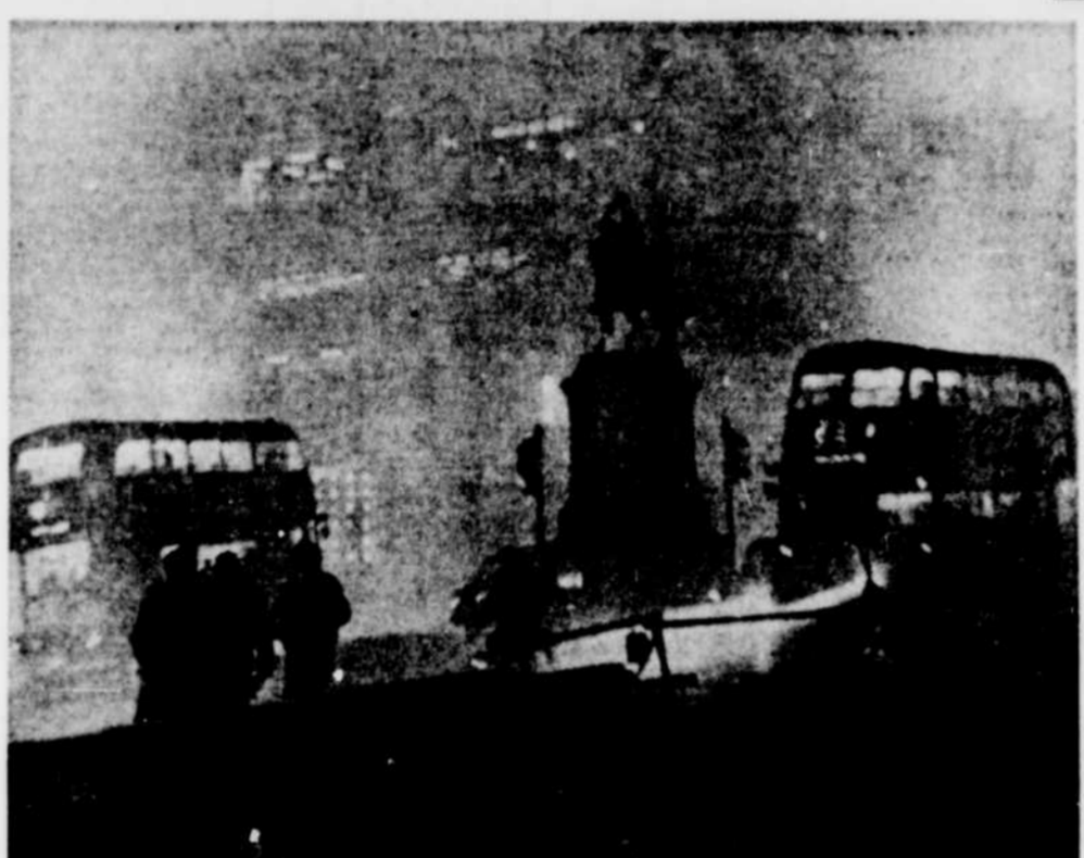
UN BROUILLARD MORTEL pèse sur la ville de Londres depuis trois jours. Au moins 67 personnes sont mortes et des centaines d'autres ont été hospitalisées. La plupart des victimes souffraient de maladies du cœur ou de la poitrine qui ont été aggravées par le soufre dans l'air dont la densité était de 10 à 14 fois plus élevée que la normale.