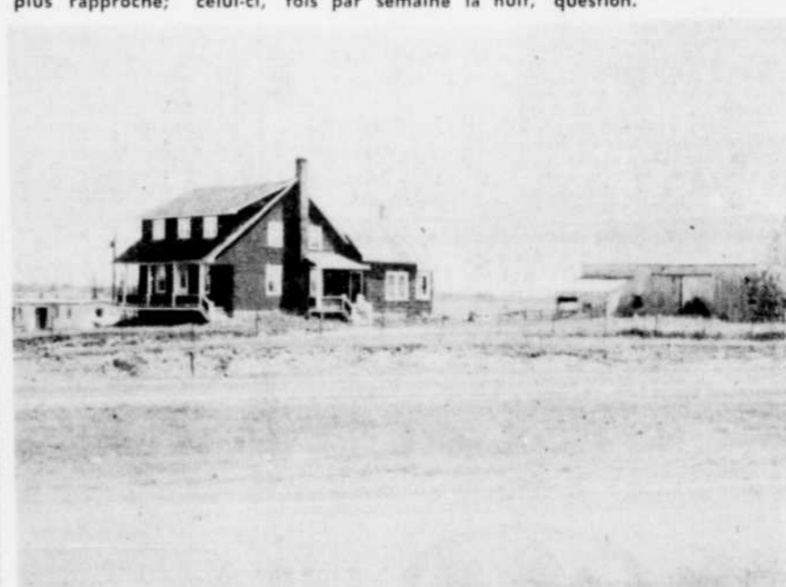
Les automobilistes tombant en panne sur la route transcanadienne n'ont qu'un seul secours... c'est celui d'aller frapper à la porte de la première maison venue... Cette coquette maison de ferme est un refuge tout désigné pour qui tombe en panne.

On a questionné plusieurs cultivateurs de St-Germain à Bon-Conseil, dont la maison est sise près de la route 9. Tous sont d'accord que ces visites se produisent fréquemment, jusqu'à trois ou quatre fois par semaine la nuit,