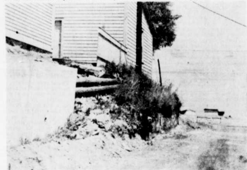
AUTRE MUR — Les autorités municipales de Coaticook devront faire rallonger d'une trentaine de pieds, le mur de soutènement de la rue St-Jean-Baptiste, qui a été construit l'an dernier. Cette photo, montre l'emplacement du futur mur ainsi qu'à droite de la photo, le profil de la nouvelle section de la rue St-Jean-Baptiste, qui vient d'être ouverte jusqu'à la rue Bellevue.

La question a été laissée au comité des travaux publics municipaux, avec pouvoir de décider si un autre contracteur sera engagé pour reprendre les travaux et par quel des déboursés seront payés.