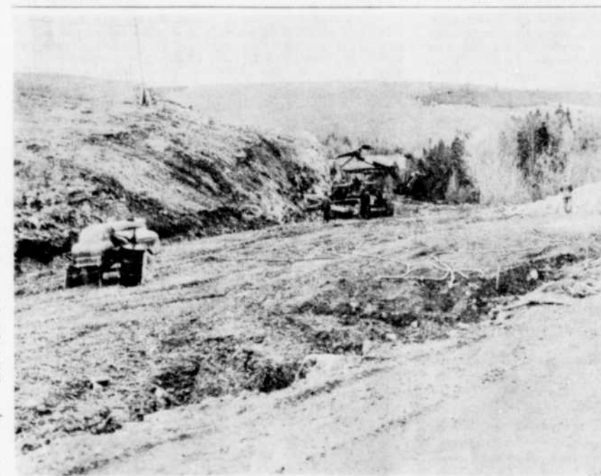
TRAVAUX DE VOIRIE. — D'importants travaux de voirie sont présentement en voie de réalisation entre les villages de St-Pierre de Broughton et St-Jacques de Leeds, dans le comté de Lotbinière. Ces travaux consistent principalement à élargir la route et à niveler la voie.