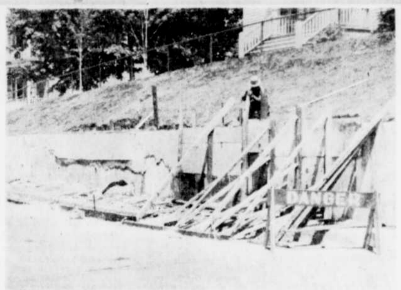
PUTEUX ETAT — Le mur de soutènement de la rue St-Paul n'a été construit que l'an dernier, mais semble âgé d'un siècle. Cette photo montre le mur, après les réparations de cette semaine et laisse entrevoir le besoin de réparations plus adéquates.

Dans son exposé il a révélé le fait qu'au cours des dernières années "la délinquance a augmenté dans une proportion cinq fois plus grande que l'augmentation de la population. Seulement au Canada, le nombre de cas de maladies vénériennes a augmenté de 1,000 pour cent".