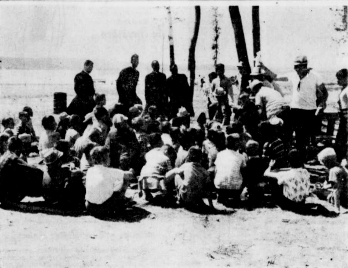
VISITEURS DE MARQUE — Les otéjistes de la Plage municipale de Magog ont reçu hier la visite de deux prêtres noirs. Ces derniers ont entretenu les jeunes sur

leur pays d'origine. Tous les groupes ont manifesté un intérêt marqué et ils ont écouté attentivement les paroles et les chants des deux visiteurs.