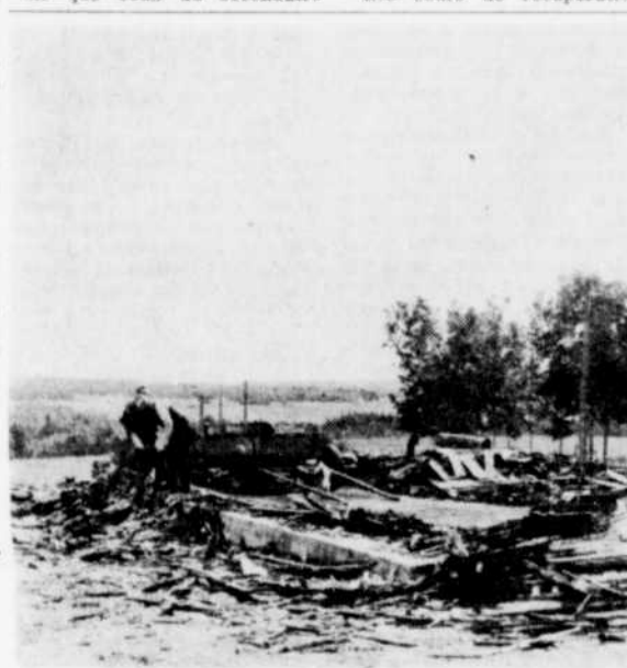
L'ANCIEN HOTEL DE VILLE. — Les employés de la municipalité d'East Broughton Station procèdent présentement au nettoyage du site de l'ancien hôtel de ville qui passait au feu il y a quelques semaines. Les autorités entendent bientôt procéder à la reconstruction.

Aussi, les parents sont priés d'inscrire leurs enfants au Collège de la Salle, 17 Notre-Dame sud, les 19-20 juillet, entre 9 heures a.m. et 11 heures a.m., et de 2 heures p.m. à 4 heures p.m., où le soir en téléphonant à 335-6098.