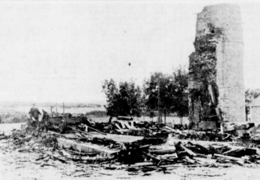
L'ANCIEN HOTEL DE VILLE. — Les employés de la municipalité d'East Broughton Station procèdent présentement au nettoyage du site de l'ancien hôtel de ville qui possédait un feu il y a quelques semaines. Les autorités entendent bientôt procéder à la reconstruction.

Les personnes âgées étaient accompagnées lors de ce voyage de trois religieuses ainsi que de leur aumônier, l'abbé Raphaël Allaire de la paroisse St-Alphonse de Thetford Mines.