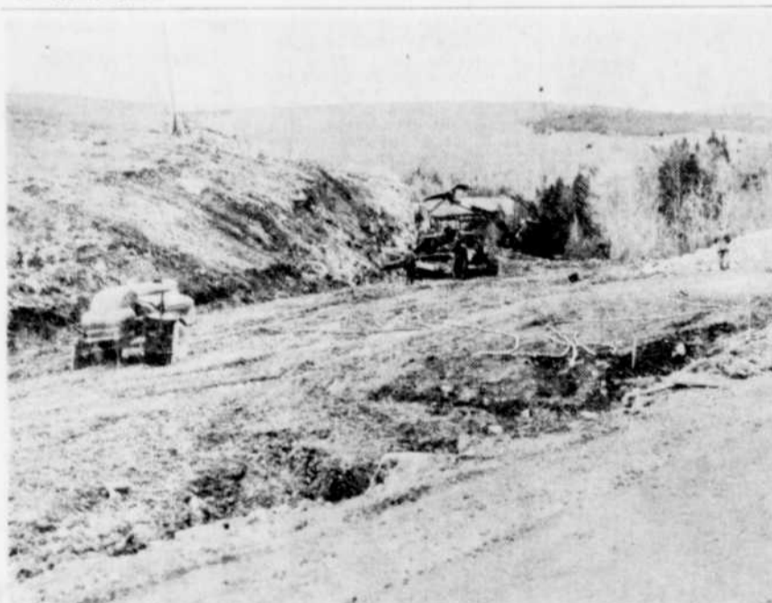
TRAVAUX DE VOIRIE. — D'importants travaux de voirie sont présentement en voie de réalisation entre les villages de St-Pierre de Broughton et St-Jacques de Leeds, dans le comté de Lotbinière. Ces travaux consistent principalement à élargir la route et à niveler la voie.