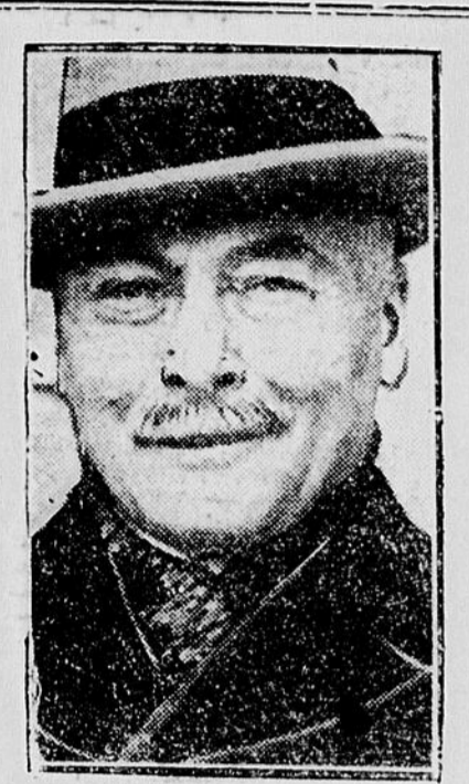
SIR JAMES LOUGHEED, leader conservateur au sénat canadien, est décédé ce matin à l'hôpital Civique d'Ottawa à l'âge de 71 ans.