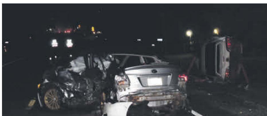
Une violente collision, survenue le 12 octobre sur la route 116, à Acton Vale, a causé la mort d'un Valois de 26 ans, Maxime Cusson.

« C'est beaucoup trop tôt pour tirer des conclusions. Ça peut prendre pas mal de temps avant de connaître les résultats de l'enquête, car plusieurs détails sont à examiner et à vérifier », mentionne Aurélie Guindon, également agente d'information à la SQ.