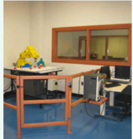
La barrière de sûreté permet de sécuriser la zone d'utilisation du robot.

L'enseignant a installé une barrière de sécurité près du robot, afin de sécuriser sa zone d'utilisation, et le local des automates est maintenant muni de panneaux de contrôle. De plus, des notions de santé et de sécurité au travail ont été transmises aux étudiants de troisième année en Génie mécanique grâce à une formation de deux heures sur l'utilisation sécuritaire du local des automates et du robot par l'application de différents protocoles.