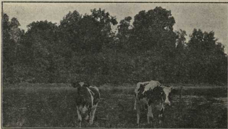
GRAS PATURAGES BIEN ARROSÉS DANS LA RÉGION DU TÉMISCAMINGUE.

C'est un centre d'avenir, car il est situé sur la limite des Provinces de Québec et d'Ontario. C'est là, même, sur les bords de la