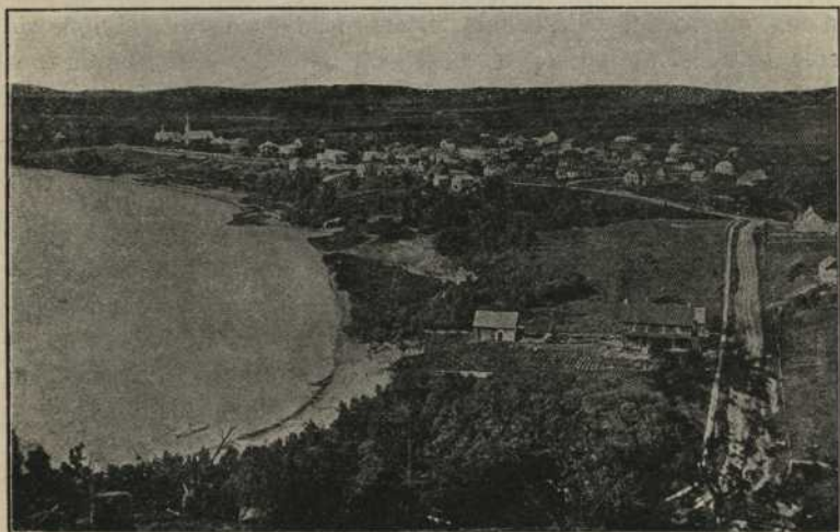
VILLE-MARIE, COMTÉ DE TÉMISCAMINGUE.

"Qu'on se le tienne pour dit, à moins d'aller demander au sol le salut, notre race périra, et il n'est pas besoin de s'abandonner à de longues considérations pour s'en convaincre."