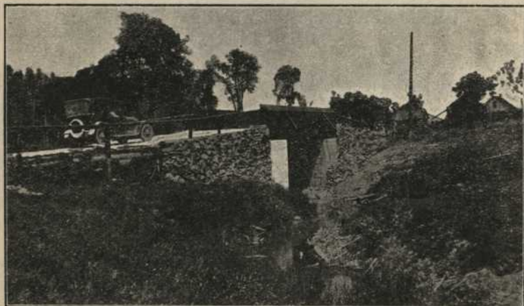
PONCEAU SUR LE RUISSEAU OBIKA, GUIGUES, COMTÉ DE TÉMISCAMINGUE.

Le climat, nous dit-on, est à peu près le même que celui du nord de Montréal et de la région d'Ottawa. L'air est sain et pur. Le voisinage des lacs Témiscamingue, des Quinze et Expanse, qui baignent ce beau et vaste territoire à l'ouest et au nord, tempère l'atmosphère, et rend la température favorable à la végétation.