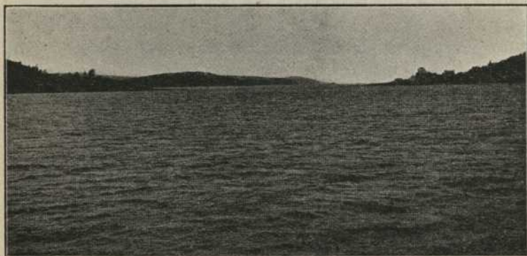
LE LAC TÉMISCAMINGUE.

Cette constatation est juste; le succès de la colonisation dans notre province repose sur l'aide efficace de toutes les classes de la société, et, en particulier, des sociétés de colonisation fondées dans les diocèses nouveaux.