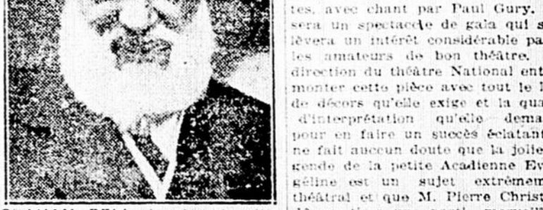
GRAHAM BELL, le père du téléphone, qui s'en vient d'Essau au Canada, annonçant qu'il nous ménage une nouvelle invention.

Il paraît qu'aux cours de l'association des opticiens, on va faire passer les examens sur l'astronomie, car un des examinateurs trouve que corriger le vice de réfraction, n'est pas un traitement optique. Putôt astronomique, il faut croire?