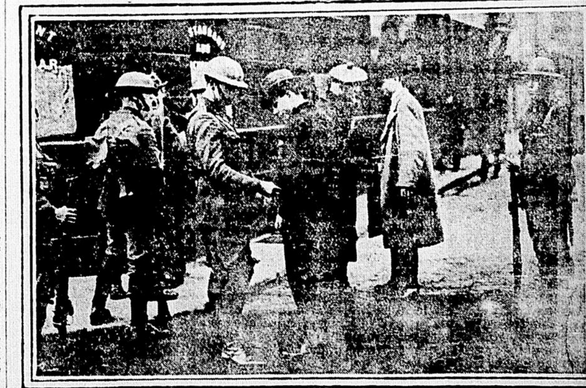
Les malheureux pékins sont obligés de montrer "patte blanche" à la force constabulaire irlandaise et aux soldats anglais.