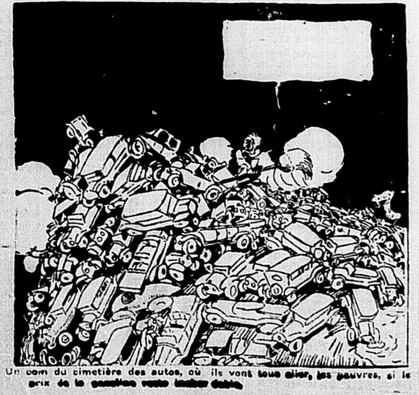
Un coin du cimetière des autos, où ils vont tous aller, les pauvres, si le prix de la dernière roue tombe bas.

Les agents ont reçu avis cette semaine de leurs principales maisons qu'une quantité très limitée de bon whisky est disponible pour l'exportation durant l'année 1921 et les provisions seront par conséquent insuffisantes. Achetez du Dewar's Whisky alors que vous pouvez vous le procurer, et vous êtes certains que vous aurez du bon whisky.