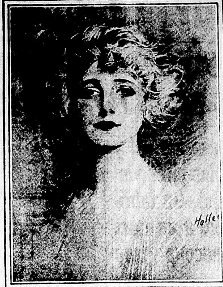
Qui des 25.000 lecteurs de "L'Autorité" connaît cette très jolie femme?

étais pas aperçu... Et quand je fus rentré chez moi, je compris qu'il s'agissait d'un drame de l'imagination et que Frédéric vivait chaque jour, en quelques minutes, sous cette face imperturbable, le plus beau et le plus triste des rêves amoureux.