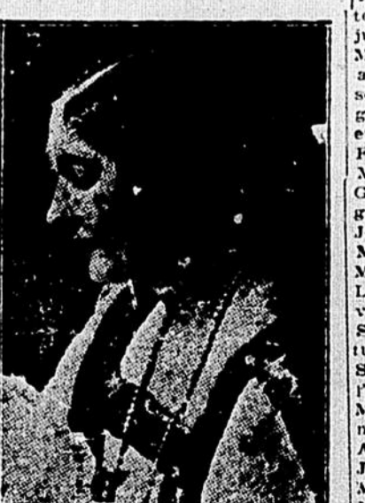
LADY RAMSAY, [née princesse Patricia de Connaught] qui confesse de ses mains le nouveau drapeau du régiment Patricia, l'ancien ayant été déshiqué à la guerre.