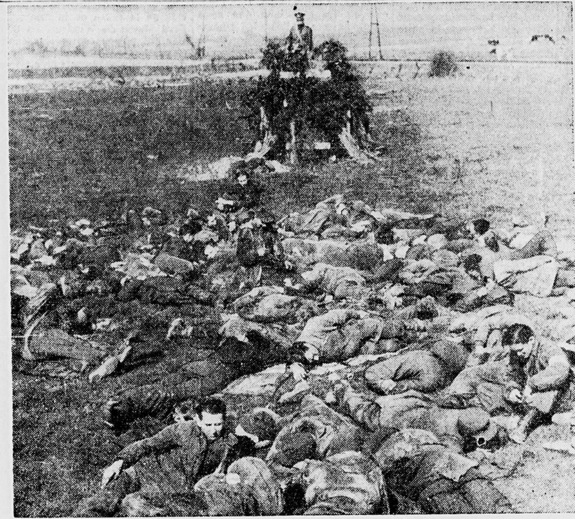
● Ces hommes ne sont ni blessés ni morts mais épuisés de fatigue après les combats terribles et incessants que leur a livrés la 1 re Armée canadienne dans sa poussée soudaine et brillante de fin de semaine au-delà du Rhin. Il a suffi d'une seule sentinelle canadienne pour garder ces "surhommes".