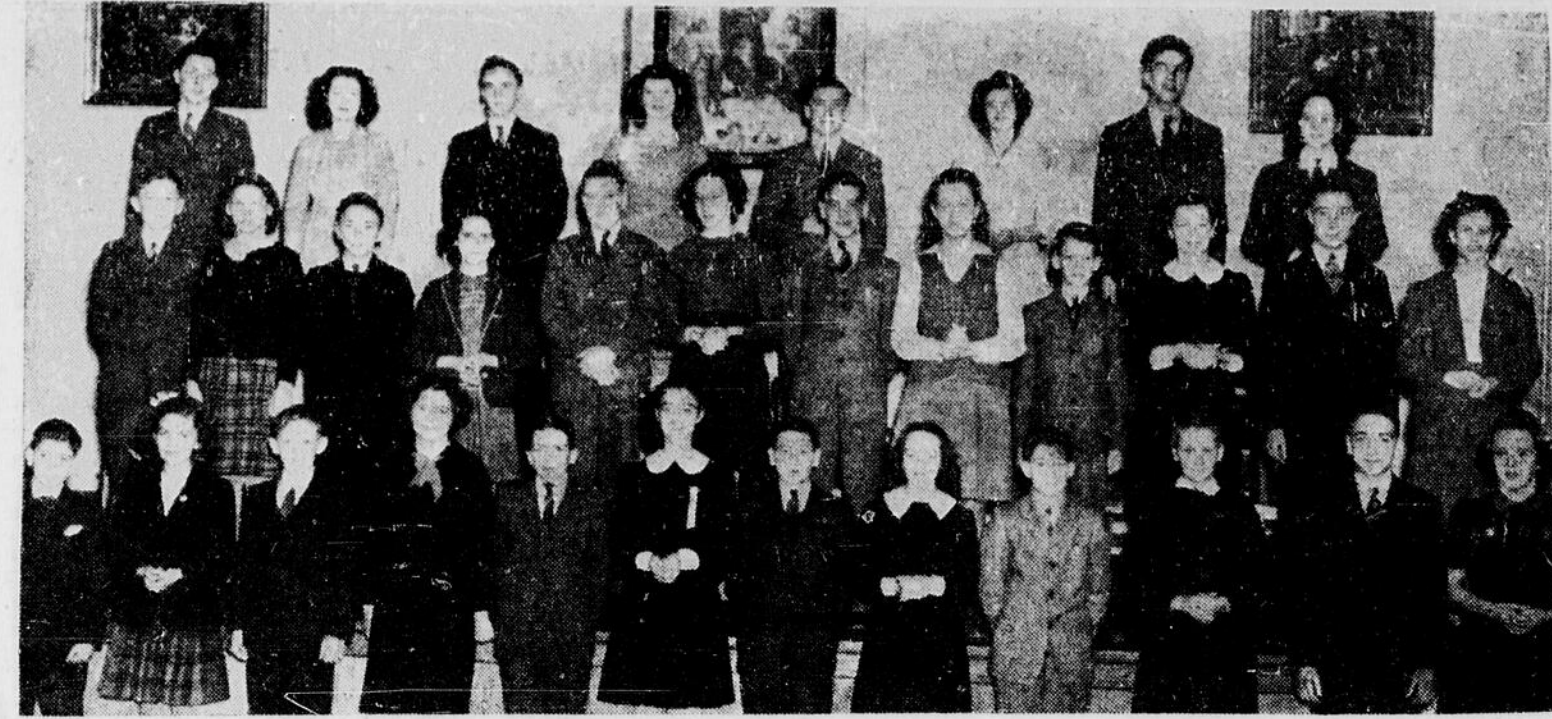
Les vingt-quatre concurrents du huitième concours provincial de français ont subi aujourd'hui les dernières épreuves et au cours d'une grande séance, à l'École Technique, ce soir, on proclamera les noms des vainqueurs de la section secondaire et de la section primaire.

chologie sont les clés du succès dans ce domaine des plus importants et des plus nécessaires.