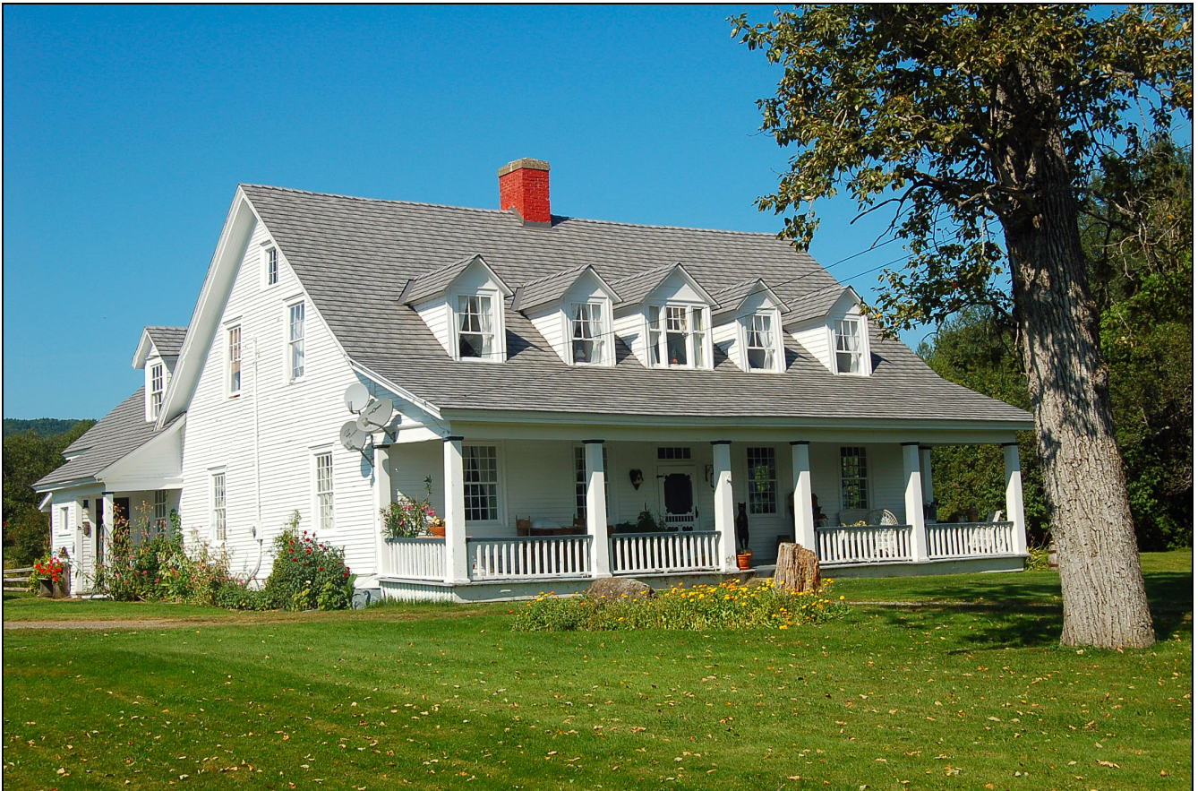
Maison Busteed, Restigouche