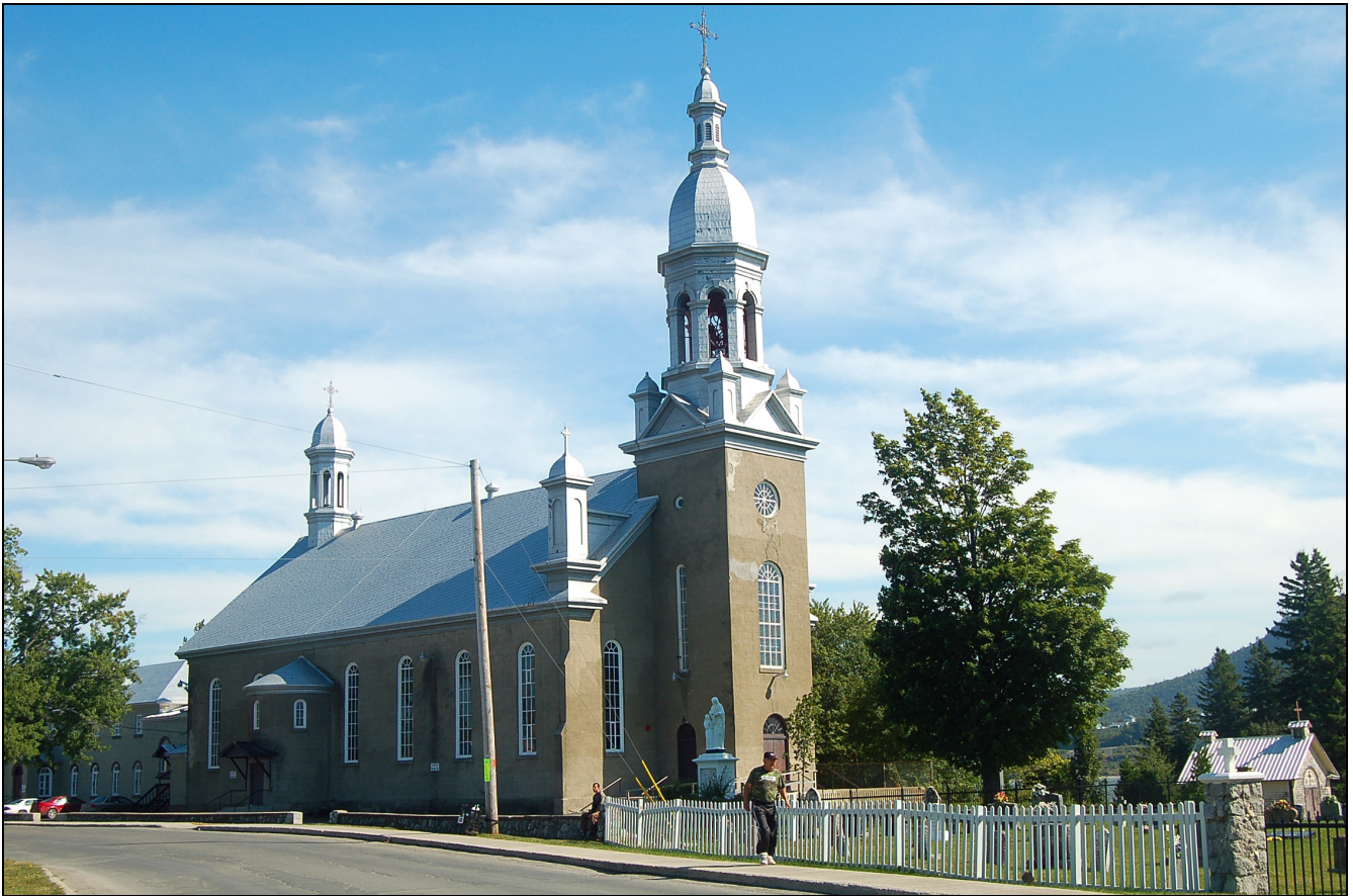
Église Sainte-Anne, Restigouche