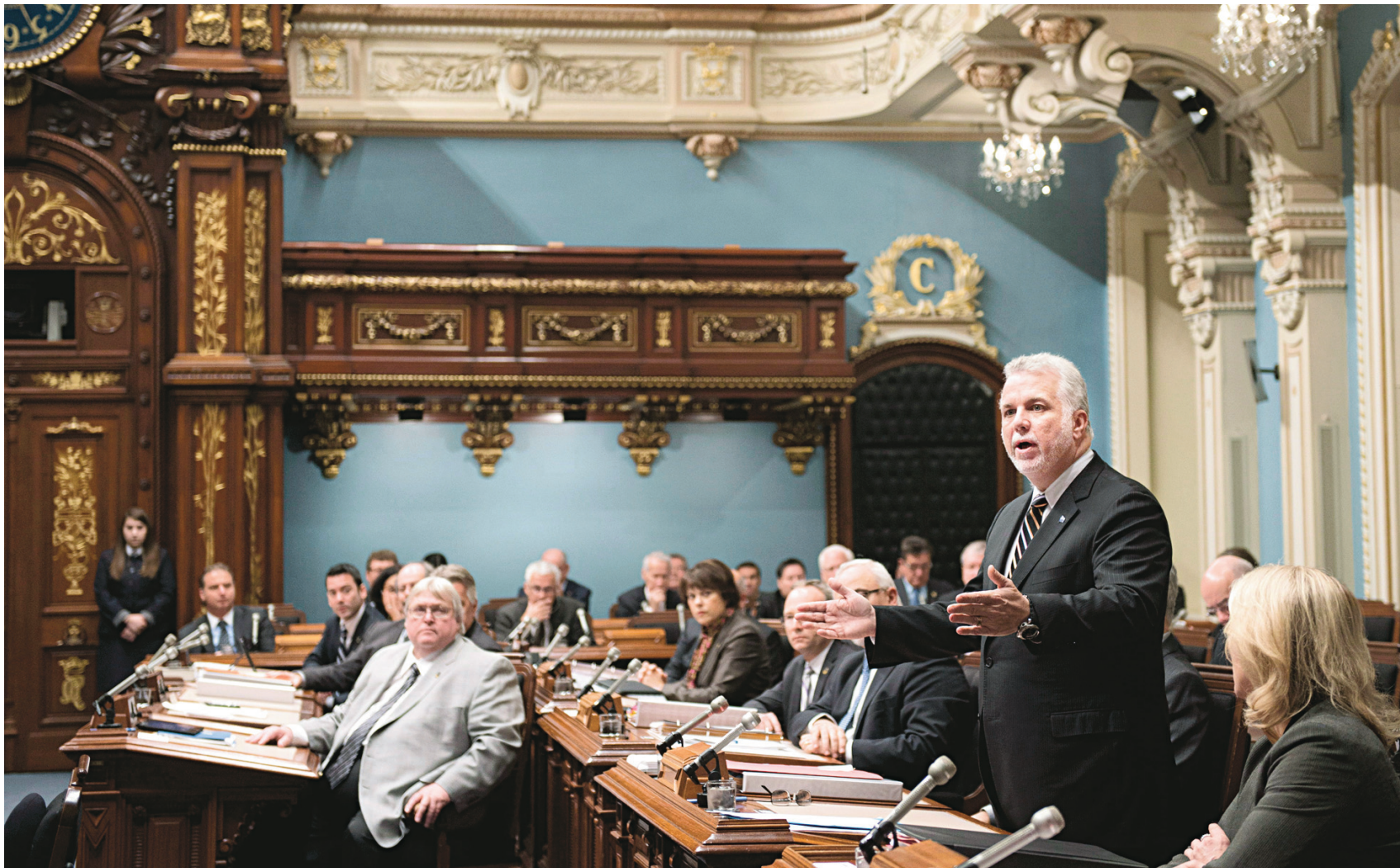
Le gouvernement Couillard a multiplié les annonces cette semaine.

CAHIER B • LE DEVOIR, LES SAMEDI 29 ET DIMANCHE 30 NOVEMBRE 2014