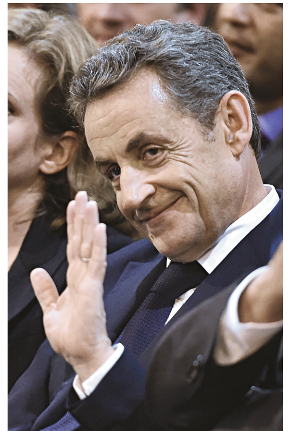
Nicolas Sarkozy jeudi à Nîmes