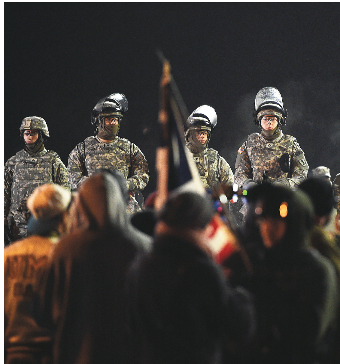
De nouvelles émeutes ont éclaté cette semaine à Ferguson et dans d'autres villes des États-Unis.

Non seulement les écoles et les autres équipements sont très inégalement répartis, mais la concurrence stérile entre les multiples entités municipales a eu pour effet de désindustrialiser la région au fil des ans, même si celle-ci conserve quelques sièges sociaux d'entreprises