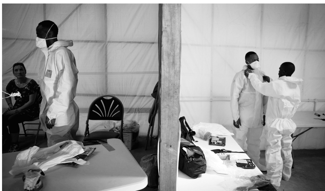
Un centre de traitement de la fièvre Ebola en Sierra Leone

Tandis que, de façon compréhensible, les ressources limitées sont redirigées pour répondre à la crise d'Ebola, les autres services de santé — comme les soins prénataux ou d'obstétrique, l'immunisation et le traitement de maladies infantiles — sont extrêmement limités. Les taux de mortalité maternelle ont grimpé depuis le début de l'éclatement. On estime qu'une femme sur sept pourrait faire face à des complications potentiellement fatales liées à la grossesse, à cause du manque d'accès à des soins de santé. L'impact sur la santé des nouveau-nés et des enfants est également alarmant. Au Liberia, 97 pour cent des bébés recevaient leurs vaccins de routine avant l'épidémie d'Ebola. Maintenant, à cause d'un manque d'accès et parce que les gens ont peur de se rendre dans les centres de santé, seulement 27 pour