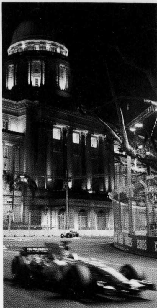
En avant-plan, la Renault de Fernando Alonso, qui a remporté le premier Grand Prix de Singapour, course qui s'est déroulée de nuit.