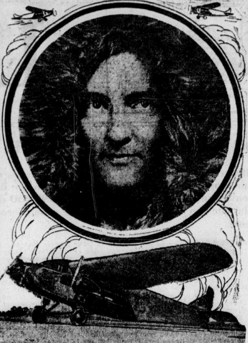
L'EXPLORATEUR AMERICAIN, à bord d'un aéroplane à trois moteurs Fokker a survolé le pôle sud, la semaine dernière. Parti de sa base du "Little America", il a fait l'envolée de 1600 milles au pôle antarctique et est revenu sans contretemps. 1) McKinley, photographe de l'expédition; 2) Balchen, pilote; 3) June, sans-filiste; 4) Trajet suivi par Byrd et celui de ses prédécesseurs Shackleton, Amundsen et Scott; à droite: Byrd.