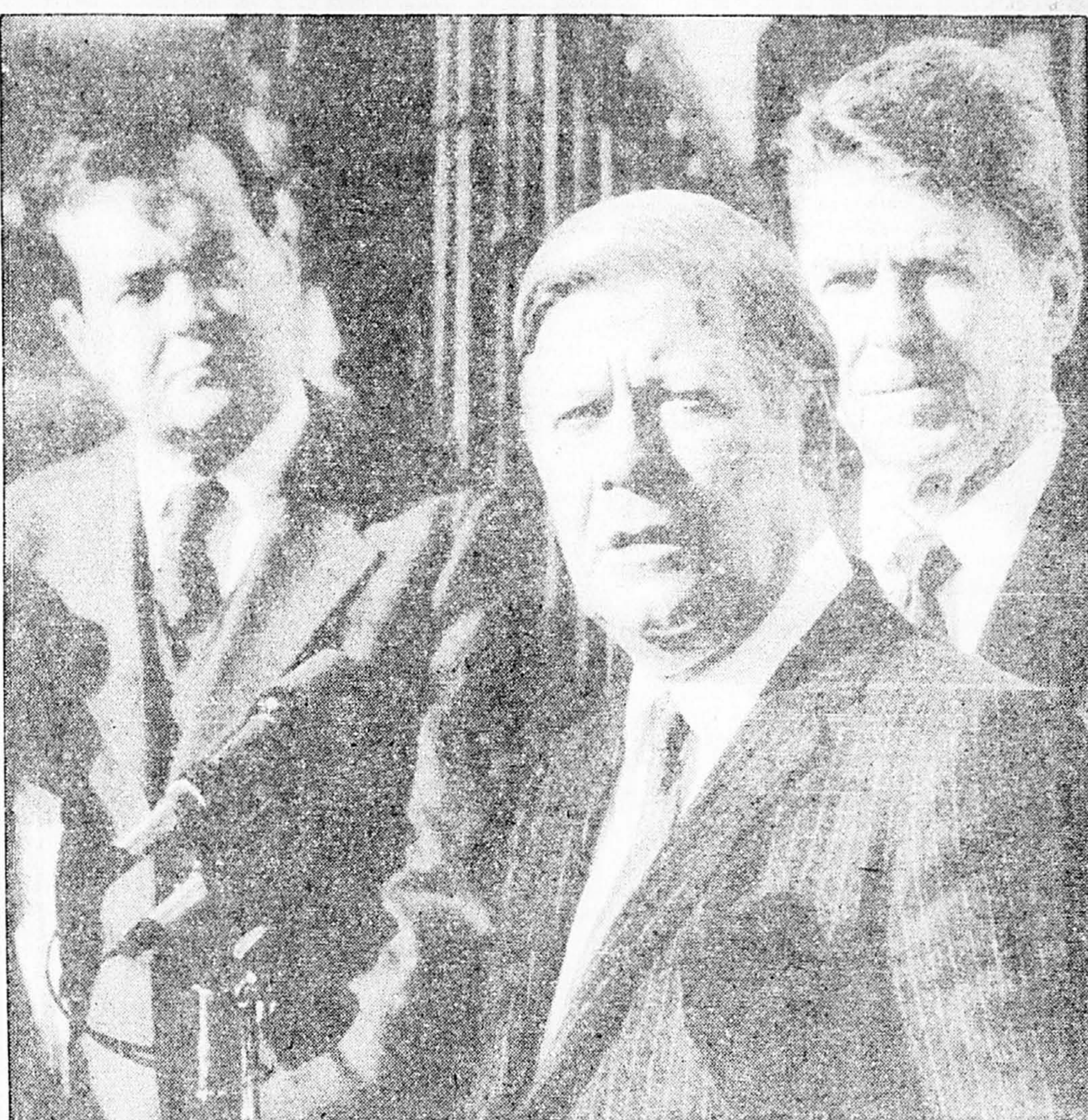
Reagan et Schmidt à la sortie de leur rencontre. William Clark était présent.

Une centaine de personnes ont manifesté devant la Maison-Blanche pendant la rencontre Reagan-Schmidt pour condamner «la politique d'apaisement» de la RFA vis-à-vis de la Pologne. Aucun des alliés des Etats-Unis n'a encore rejoint Washington dans des sanctions contre la Pologne et l'URSS. Le ministre des Affaires étrangères Mark MacGuigan a laissé entendre hier que «le Canada se demande toujours s'il doit imposer des sanctions» contre la Pologne. Le Japon s'informait hier de la position européenne, sur laquelle il s'est d'ailleurs engagé à s'aligner. A Washington, enfin, la Maison-Blanche accusait réception de la réponse du général Jaruzelski à la lettre du président Reagan condamnant l'état de siège, en précisant seulement que cette lettre «reflète les désaccords» entre la Pologne et les Etats-Unis sur la question.