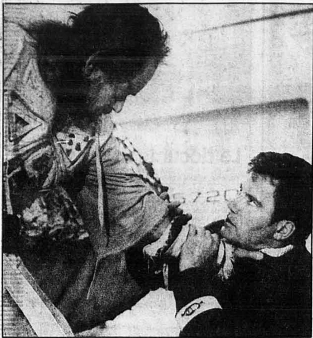
Star Trek V: The Final Frontier