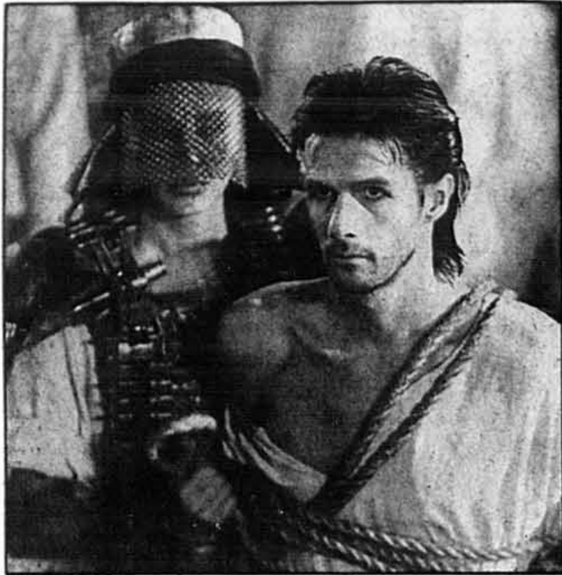
Jésus de Montréal, un film de Denys Arcand.