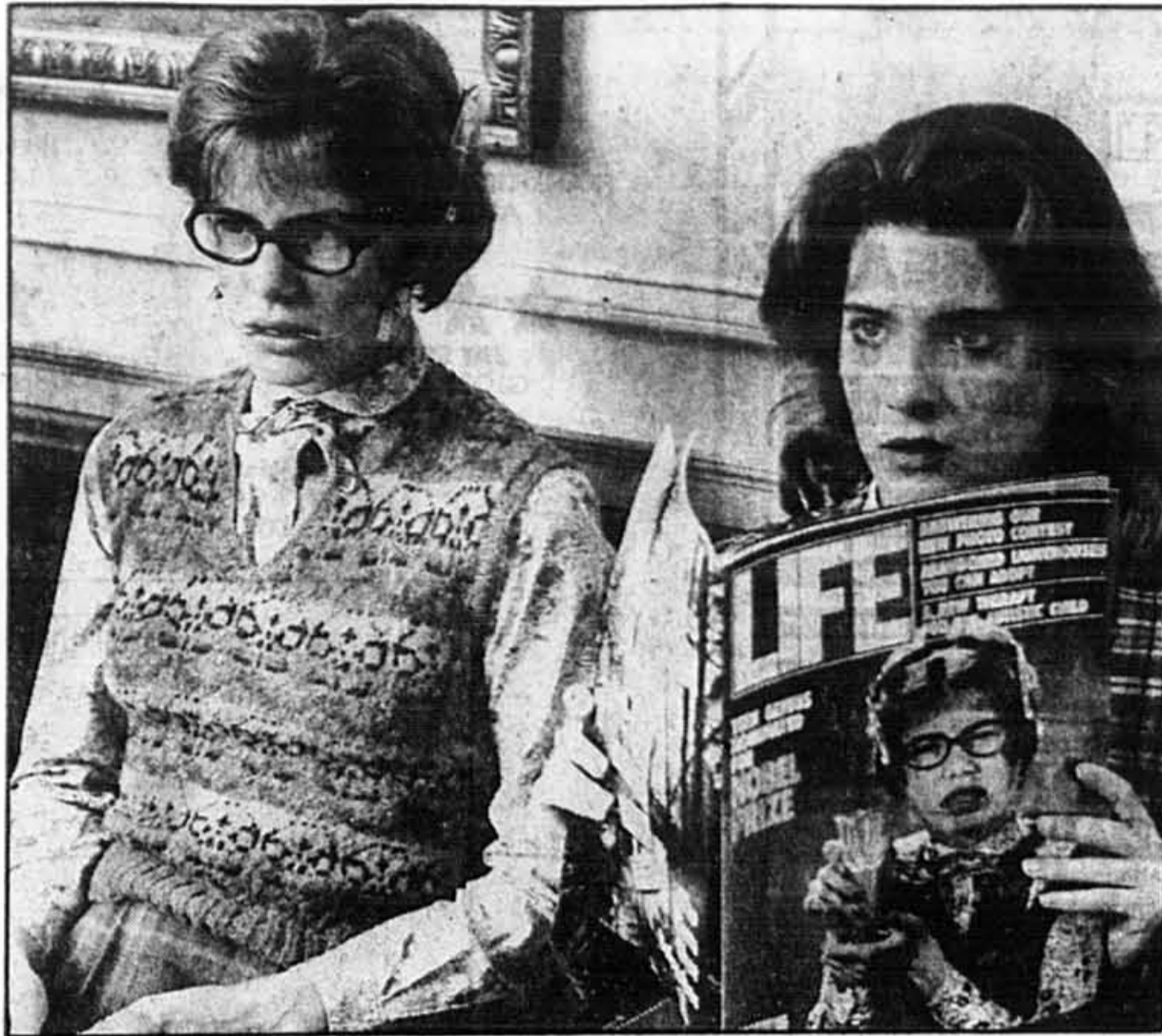
How I Got Into College

■ En 1959, un ostéopathe de Londres, Stephen Ward, s'attache à une danseuse de 17 ans, Christine Keeler. Il l'installe chez lui, lui apprend à se tenir en société, puis la présente à des amis haut pla-