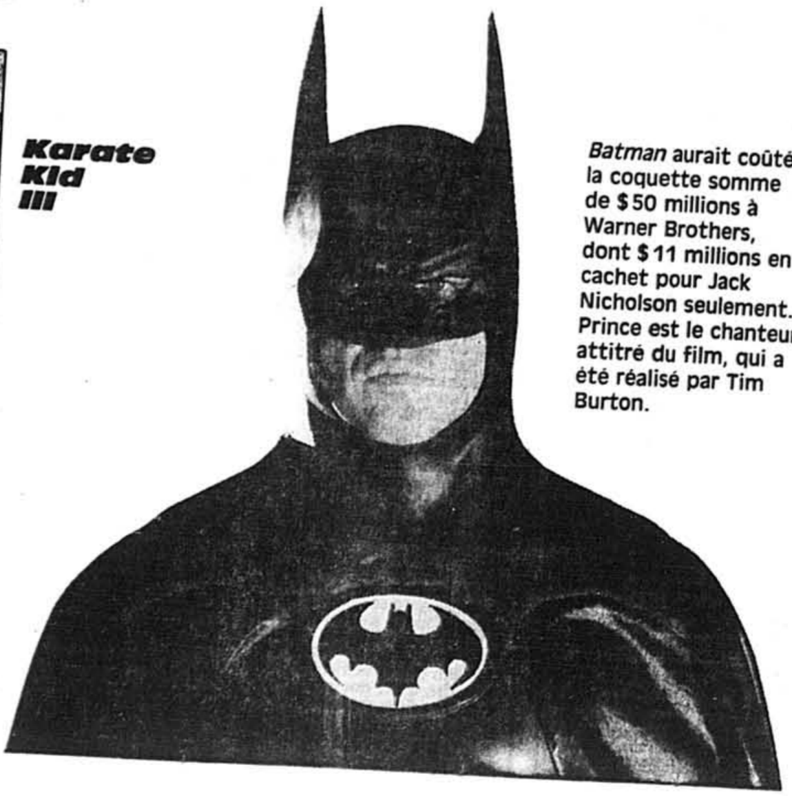
Batman aurait coûté la coquette somme de $50 millions à Warner Brothers, dont $11 millions en cachet pour Jack Nicholson seulement. Prince est le chanteur attitré du film, qui a été réalisé par Tim Burton.