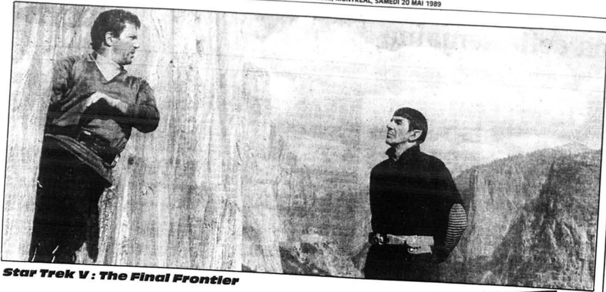
Star Trek V : The Final Frontier