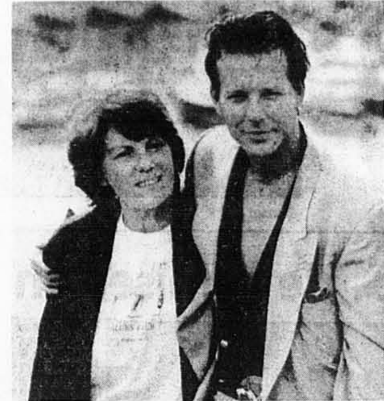
Vedette du film «Francesco», Mickey Rourke pose avec la réalisatrice Liliana Cavani, avant leur conférence de presse d'hier à Cannes.

Le ministre de la Défense dans le gouvernement conservateur de l'époque, John Profumo, avait reconnu avoir eu des relations sexuelles avec une jeune femme qui fréquentait de son côté un espion soviétique. Caton-Jones se contente de raconter par le détail cet incident. Ça donne comme résultat un film qui se laisse voir mais qui n'a rien de bien original. Il n'y a rien de scandaleux, on peut en être assuré.