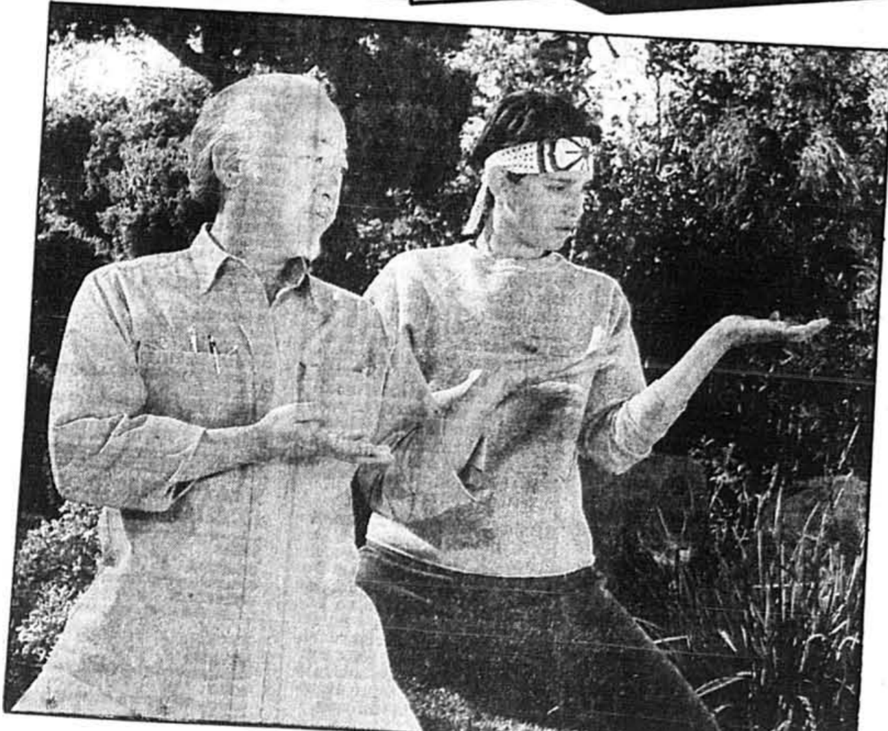
Karate Kid III