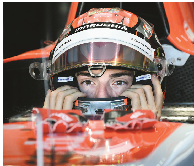
Victime d'un grave accident à Suzuka dimanche dernier, Jules Bianchi lutte toujours pour sa vie dans un hôpital au Japon.

Le but de cette nouvelle mesure serait de trouver «une façon de contrôler la vitesse de façon claire et certaine, avec le même effet qu'une voiture de sécurité». Les dirigeants de la F1 entameront les négociations avec les dirigeants d'écuries samedi, mais Whiting estime qu'il n'est pas réaliste de croire qu'une nouvelle mesure