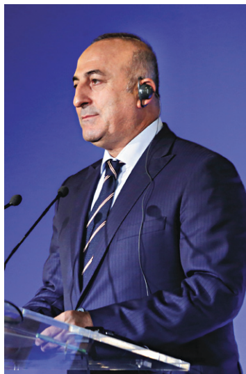
Le ministre des Affaires étrangères turc, Mevlut Cavusoglu

«Ils ont pris le contrôle du «carré de sécurité», qui abrite le complexe militaire des Unités de protection du peuple» [YPG, principale milice kurde syrienne], le siège du conseil local et la base des Assayeck (forces de sécurité kurde), d'après l'ONG, qui précise que des raids de la coalition ont frappé quatre positions dans ce secteur. Toujours dans la