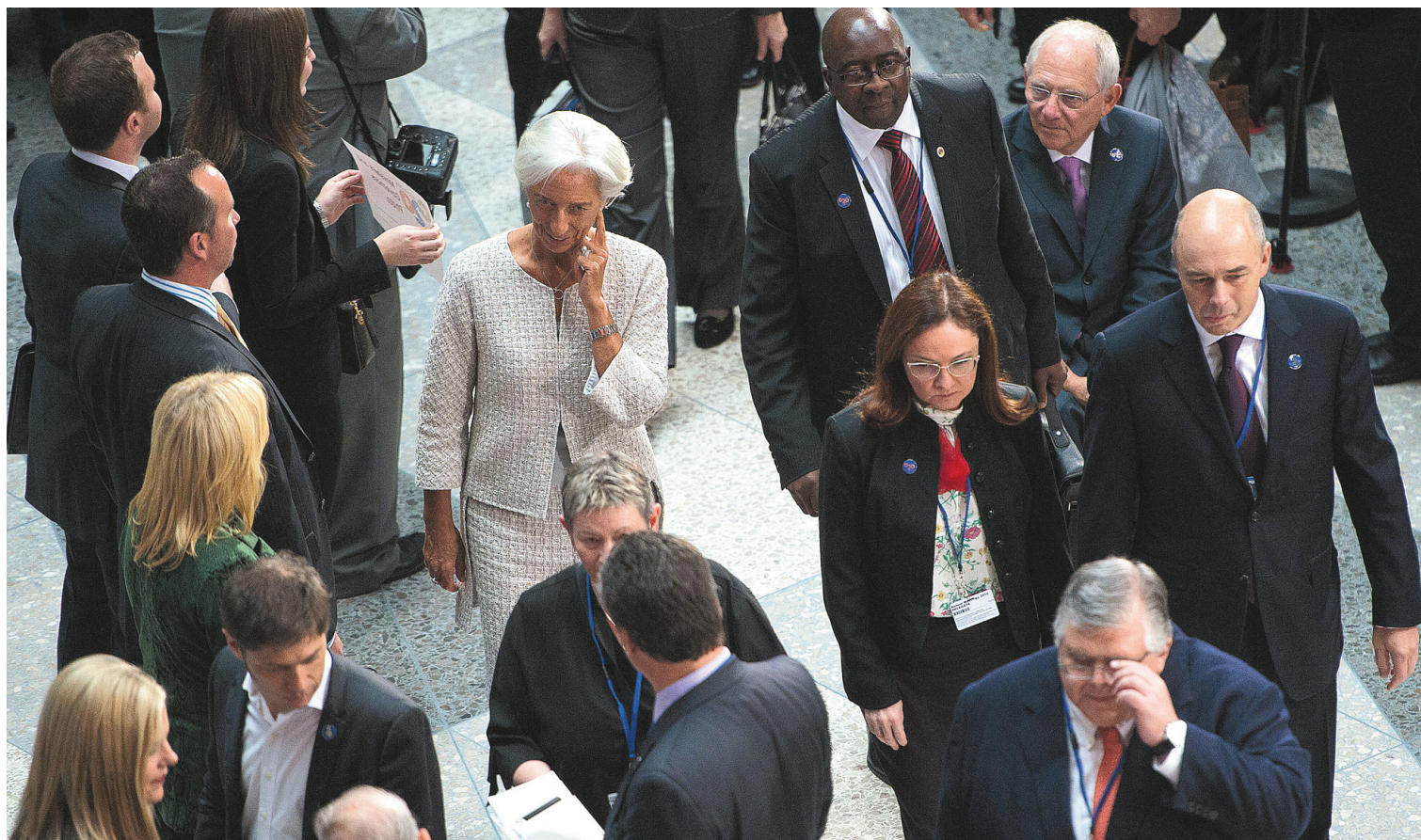
Ministres des Finances et banquiers étaient réunis à Washington au cours des derniers jours à l'occasion des réunions d'automne du FMI et de la Banque mondiale. Au centre de la photo, la directrice du FMI, Christine Lagarde.