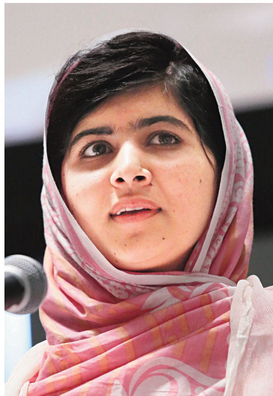
Kailash Satyarthi et Malala Yousafzai, deux défenseurs des enfants.

aplomb saisissant a refusé de se laisser intimider et multiplié les appels pour l'éducation et la tolérance. «Menons le combat contre l'analphabétisme, la pauvreté et le terrorisme, nos livres et nos crayons sont nos meilleures armes», a-t-elle déclaré de sa voix admirablement ferme l'an dernier dans un discours très applaudi à l'ONU.