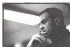
Costumes Luc J. Bêland