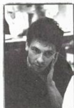
Environnement sonore Larsen Lupin (en collaboration avec tous les concepteurs et comédiens)