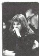
Assistance à la mise en scène et régie Geneviève Lagacé