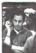
Éclairages Martin Labrecque