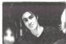
Maquillages et coiffures Angelo Barsetti