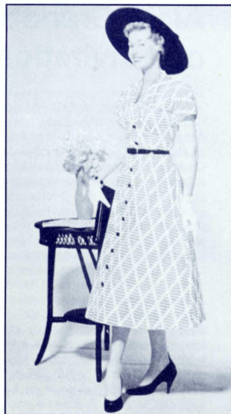
Couverture de La revue populaire , mai 1956.

Quant à la dernière décennie, elle se distingue surtout par la diversité des styles : autant chez l'homme que chez la femme, tous les «looks» sont à la mode et toutes les couleurs se portent. Plus d'une quarantaine de périodiques québécois traitant de mode ont vu le jour entre 1980 et 1990.