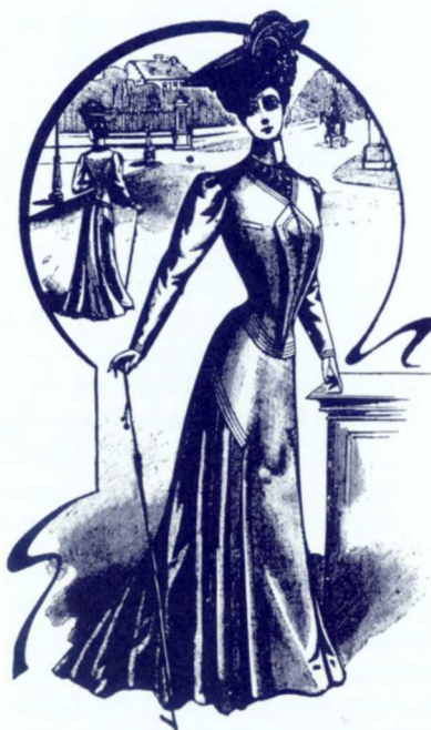
Une élégante du Montréal mode , 15 avril 1905, p. 9.

Avant 1900, très peu de périodiques spécialisés dans ce domaine se publient au Québec; quelques hebdomadaires montréalais tels que The Canadian Illustrated News (1869-1883), Le monde illustré , suivi de l'Album universel (1884-1907) et de Pictorial Times (1887), offrent à leurs abonnés une chronique de mode enrichie de gravures, mais les descriptions sont souvent très brèves. Le journal Les modes françaises illustrées = The French illustrated fashions (1887-1892) fait toutefois exception. Dans son numéro du 2 juillet 1887, on peut compter quatorze gravures, huit pages de texte et une chronique de mode sur la lingerie. Il est même