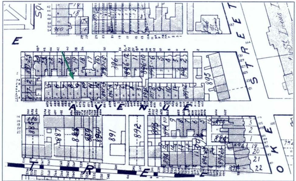
2. Quadrilatère Sherbrooke – Laval – Prince-Arthur – Hôtel-de-Ville dans Atlas of the island and city of Montreal de A. Pinsonneault, 1907.

Les annuaires Lovell's , pour Montréal et les autres municipalités de l'Île, peuvent également rendre de nombreux services. Ils comportent deux listes. La première donne le nom des résidents, rue par rue, dans l'ordre des numéros civiques, et comporte une introduction traitant des chan-