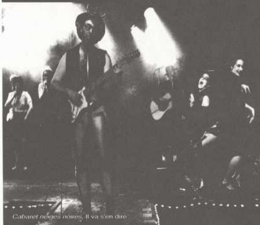
Cabaret nègres noirs, il va s'en dire

4012, rue Saint-Denis Coin Duluth tél.: 844-1919